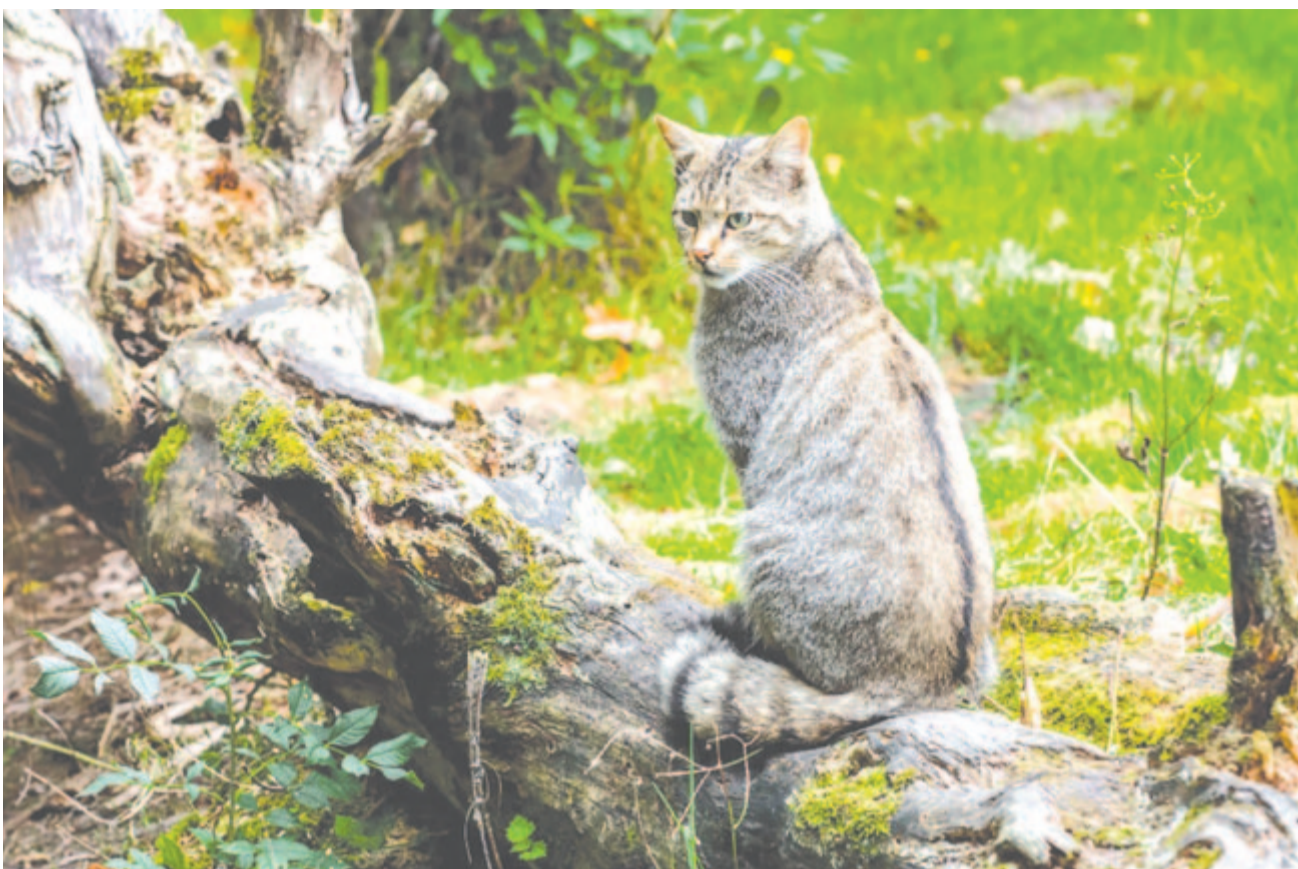
Európai vadmacska ( Felis silvestris )

205 évvel ezelőtt, 1819. április 19-én született Marosvásárhely első darwini tanokat népszerűsítő tanárebere, Mentovich Ferenc , a református kollégiumban Bolyai Farkas mathezistanszékének megöröklője, a nagyszerű népnevelő. Első verskötetében, az Uniódalokban (Kolozsvár, 1847) Erdély politikai követeléseit szólaltatja meg. 1849-ben löpörgyárban dolgozott. Őt is, mint oly sok mást, 1850-