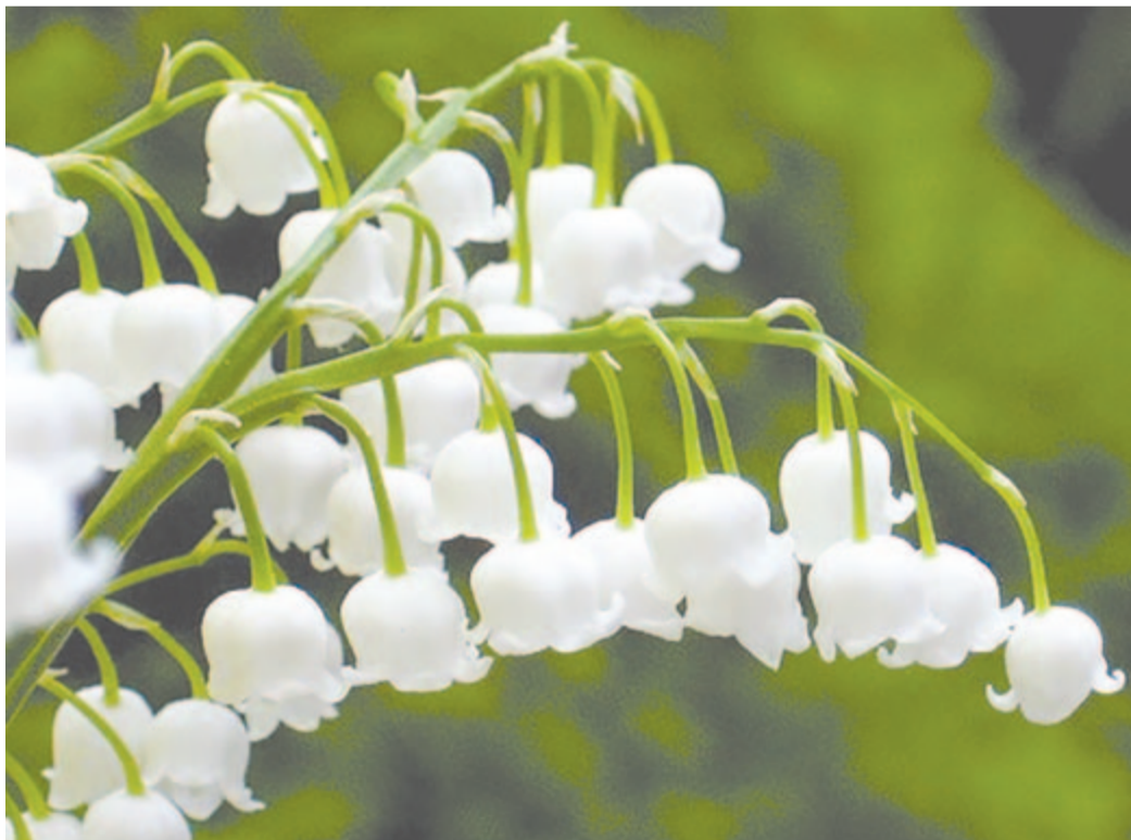
Májusi gyöngyvirág ( Convallaria majalis )

Kelt 2024-ben, 134 évvel Orbán Balázs 1890-ben bekövetkezett halála után