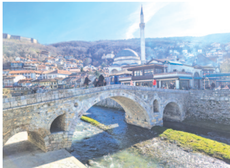
Török köhíd, mecset, vár (Berat, Albánia)

A fentiek alapján a közember legyinthet a balkanizmus, e pejoratív kifejezés hallatán, hogy az barbár és primitív. Nahát, teljes mértékben tudatlan az, aki ennél az érzésnél megreked! A Balkán-félsziget ugyanis az emberiség történelmében és különösen Európa ókori kultúrájának a megőrzésében irigylésre méltó küldetést és szerepet töltött be, és annak maradványai lépten-nyomon fel-lelhetők ma is. Délkelet-Európa minden szögletében római és bizánci műemlékek hirdetik a dicsó múltat, európaiságunkat, keresztény értékeinket, kulturális örökségünket. Az európai embernek büszkének kell lennie erre a hatalmas és felbecsülhetetlen értékű örökségre. Arra a tényre, hogy amikor Európa nyugati fele vált barbárrá („balkaniasodott el”), akkor éppen a keleti rész őrizte meg azo-