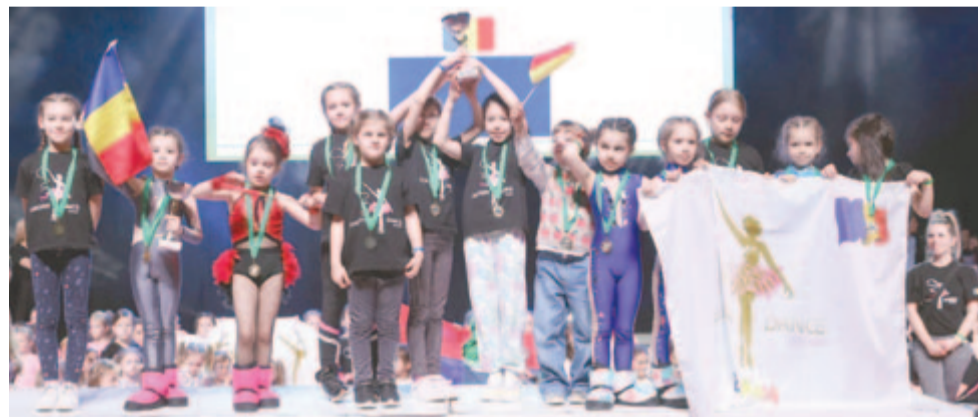
Picike lányok a dobogó legfelső fokán, első nemzetközi versenyükön