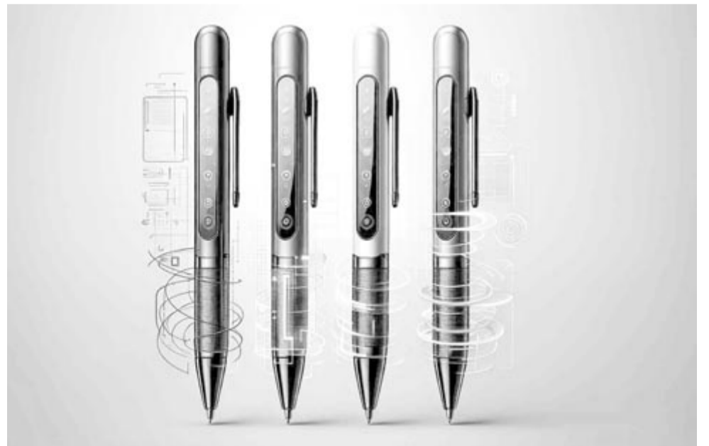
Intelligens tollak, illusztráció