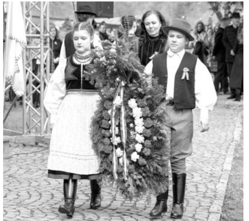
Ezen a napon fejet hajtunk a márciusi ifjak és a szabadságharc hősei előtt