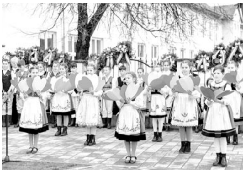
Idén a negyedikesek tartották látványos megemlékezést Nyárádszeredában