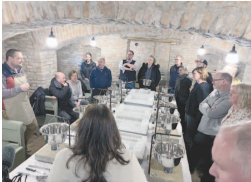
A sajtiskola első résztvevői