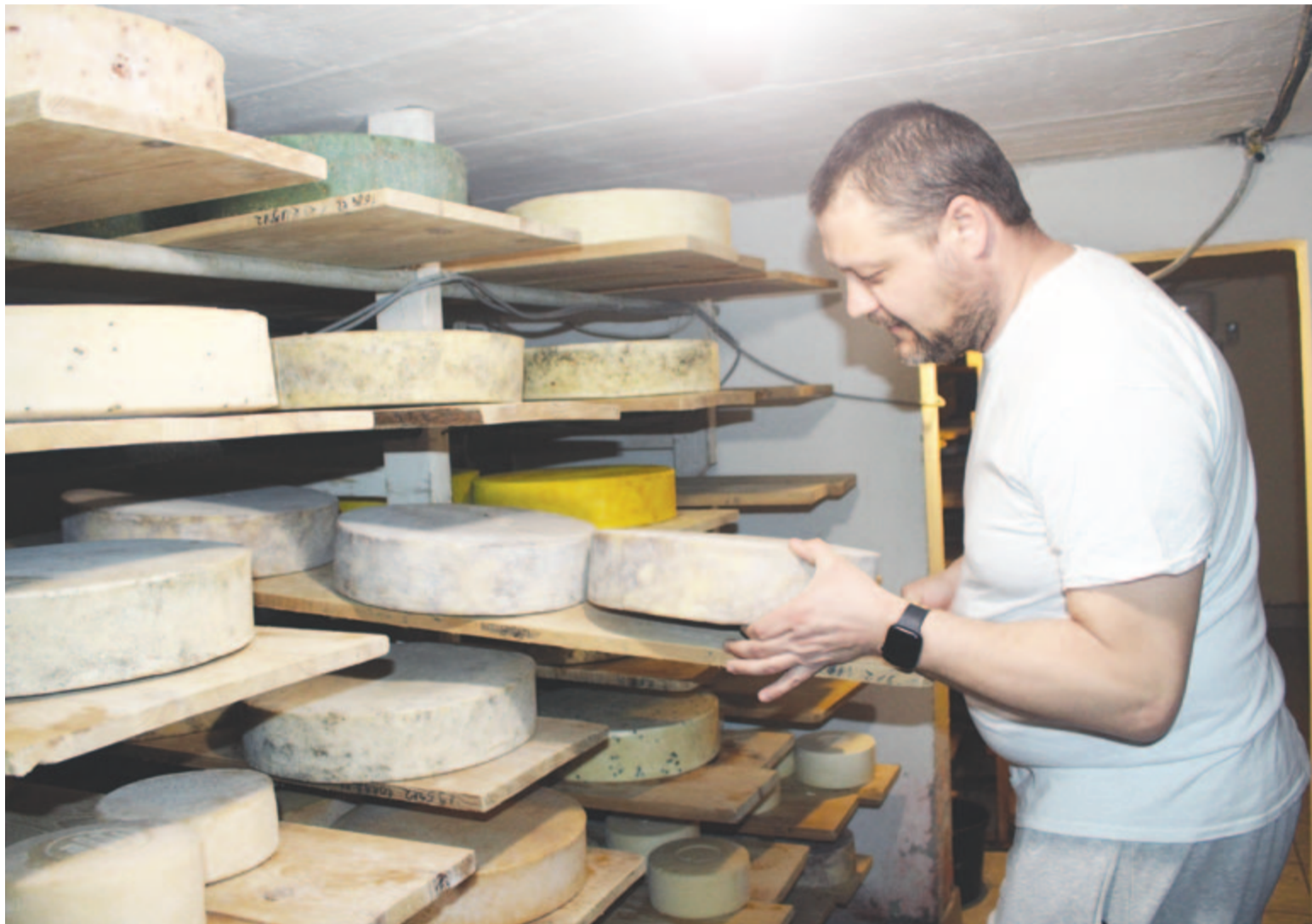
A sörös sajt, az új termékkülönlegesség