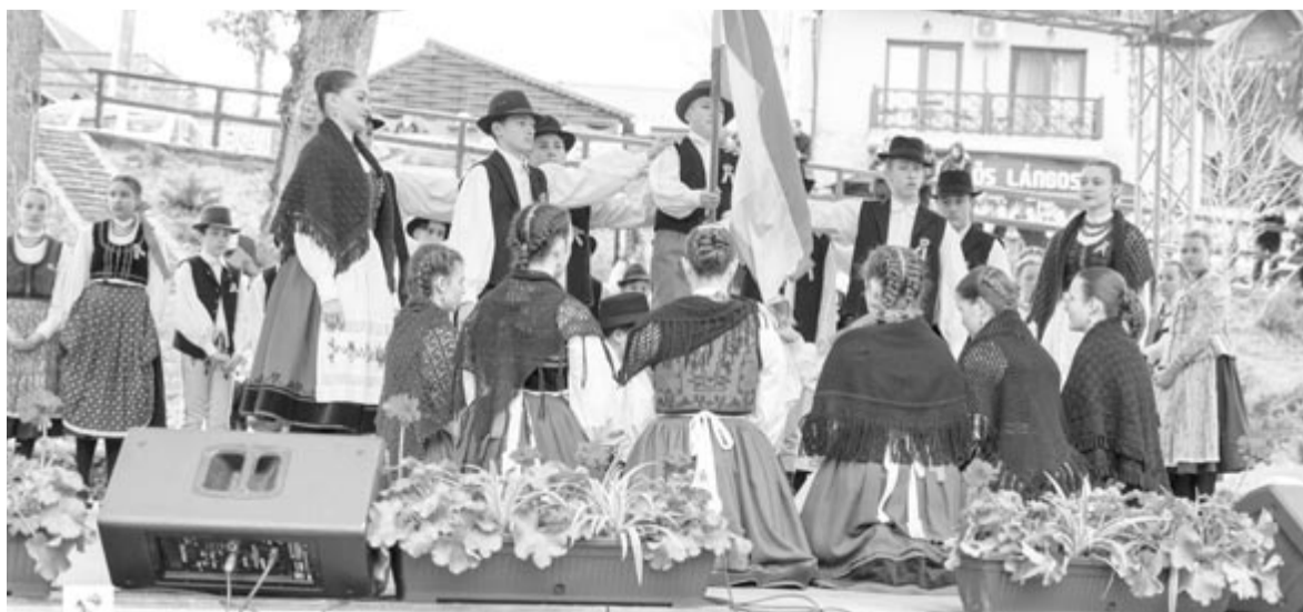
Szovátán a középiskolások és a Sirülők néptáncgyűttes ünnepi műsorában is gyönyörködhetek az érdeklődők