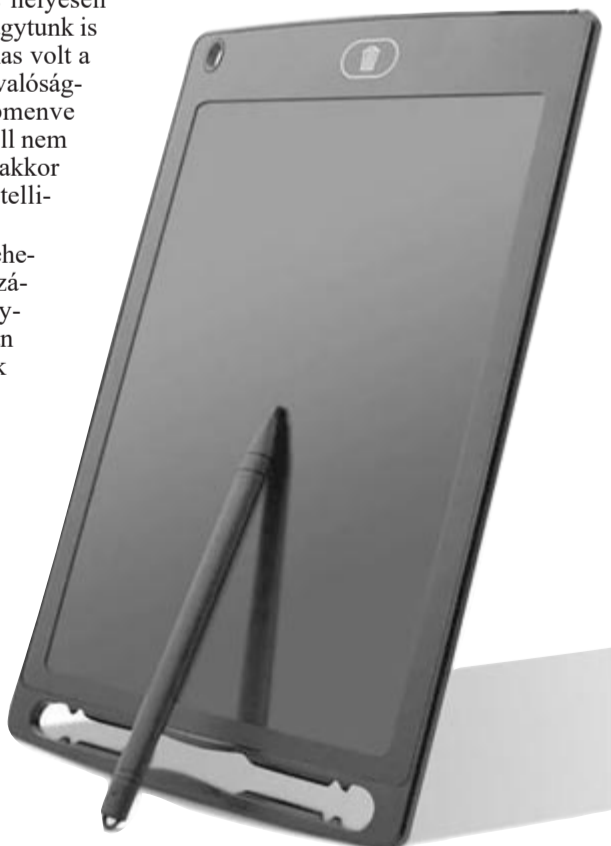
Digitális jegyzetelés, illusztráció

Összességében nézve nem feltétlenül rossz az intelligens tollak, egyértelműen megvan az előnyük, azonban ezek nélkül is el lehet látni azokat a feladatokat, amelyek megoldására tervezték őket. A profi rajzolóknak, festőknek viszont ezek szinte biztosan nem jó megoldások, mivel az érzékenységük közel sem éri el egy grafikus táblát.