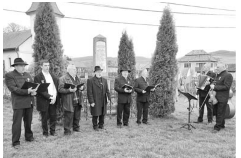
Csíkfalva községben a Nagy Ferenc férfikar hazafias dalokkal és Kossuth-nótákkal tiszteleg a megemlékezéseken

kell menni szavazni, és biztosítani, hogy Erdélynek legyen erős hangja Európában. „Március 15-e jó alkalom arra, hogy hangos szóval, számosan elmondjuk: Nyárádszeredában és Székelyföldön mi itthon vagyunk és itthon maradunk. Ma ugyanazt akarjuk, mint elődeink 1848-ban: győzzön a szabadság, győzzön a testvériség, győzzön az egyenlőség. Győzzenek a magyarok!” – szólította fel az ünneplőket a politikus. Az EP-képviselő szavai után a politikusok, az intézmények, civil szervezetek, egyházak képviselői helyezték el a szobornál a kegyelet virágait, az ünnepnap délután a főtéri református templomban a helyi diákkórusok ünnepi műsorával zárult. Vasárnap azonban folytatódott a főhajtás, Szentannán és Székelytompán az emlékoszlopoknál koszorúztak az ünnepi istentisztelet után, az andrásfalviak pedig Deák Farkas sírjánál tisztelegtek.