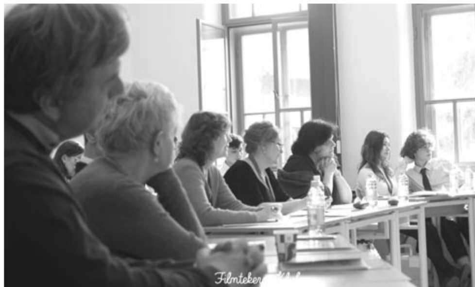
Gondban a zsűri

Az idei vetélkedőn 13 erdélyi középiskola diákjai mérték össze tudományos érdeklődésük eredményét hat szekcióban. Teljesítményüket egyetemi oktatók, kutatóintézetek munkatársai értékelték díjakkal és dicsérettel. Az élet- és műszaki tudományok szekció volt a legnépesebb, amelyben tíz tudományos dolgozatot mutattak be.