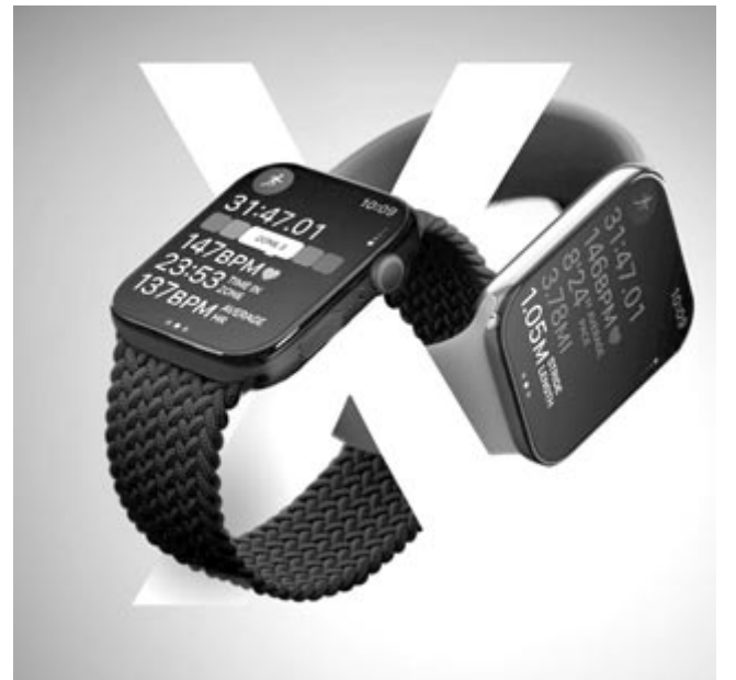
Tizedik generációs Apple Watch, koncepció

További újdonság az alvási apnoe észlelése, tünetei közé tartozik a hangos horkolás és az alvás közbeni légzéskima-