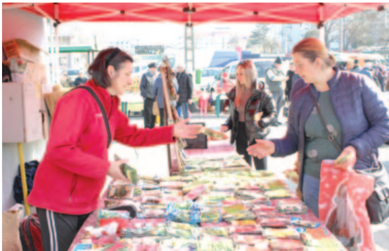
Ferenczi Ildikó magáros és őstermelő

A Szánthó házaspár ezenkívül árult még propolisztinktúrát, ami immunrendszer-erősítő, gyomorfe-