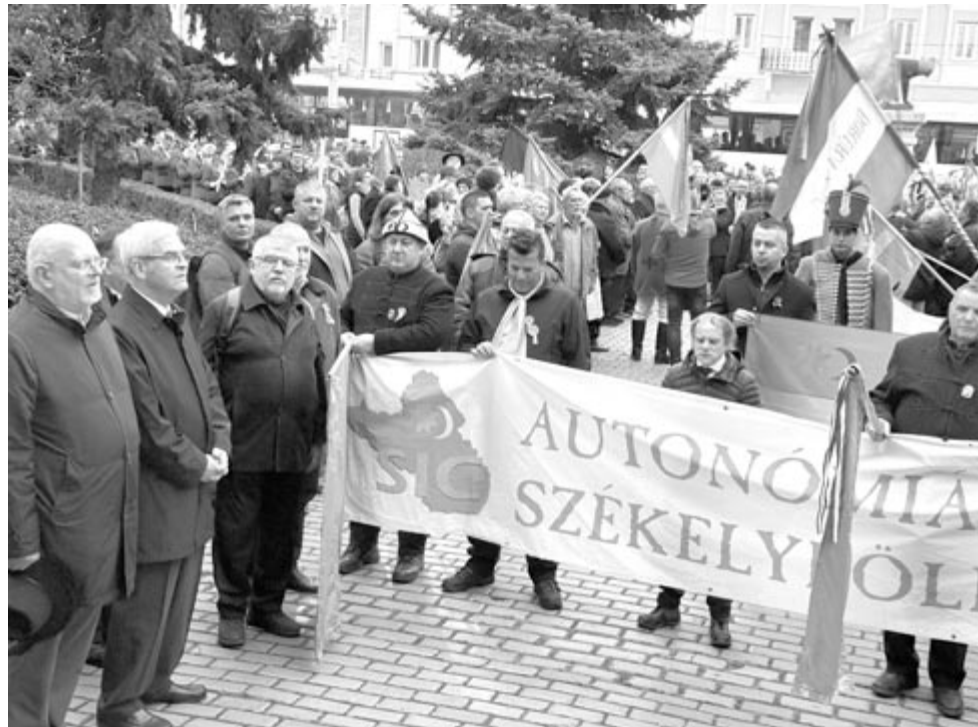
Az eseményen résztvevők a prefektúra előtt