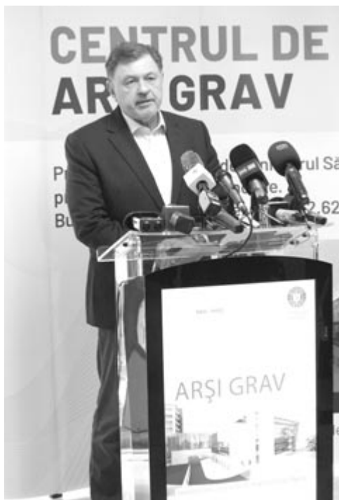
Alexandru Rafila egészségügyi miniszter

A miniszter elmondta, hogy a regionális kórházak építése is folyamatban van, Iaşiban, Kolozsváron és Craiován is, az Országos Helyreállítási Terv által biztosított pénzből. Marosvásárhelyen több mint 100 millió lejes