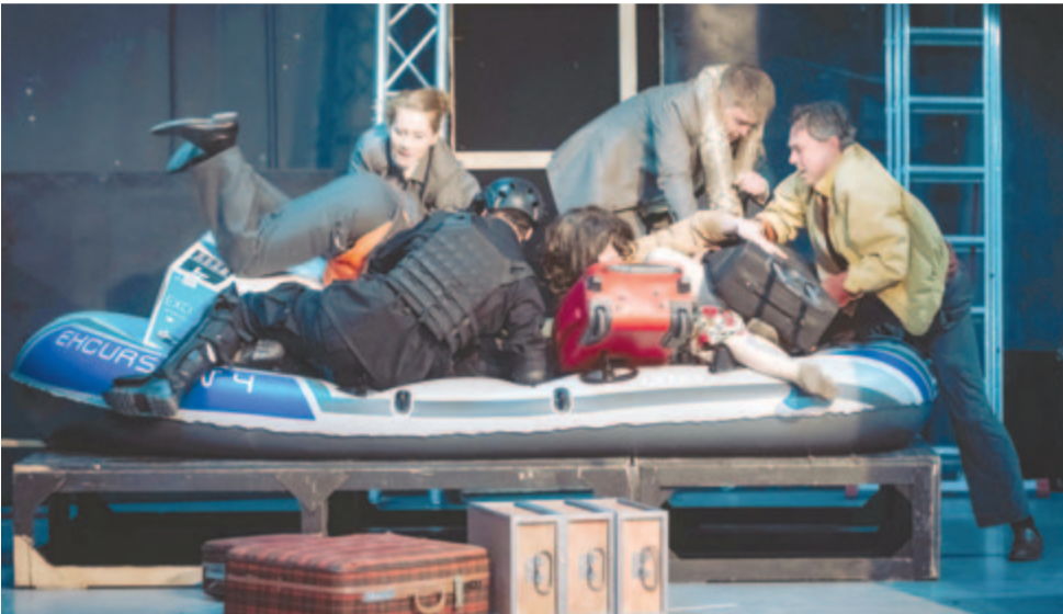
Csónak, avagy előttünk az özönvíz – próbatétel

Zeneszerző: Bocszárdi Magor. Koreográfus: Bezsán Noémi. Dizlettervező: Bartha József. Jelmeztervező: Irina Moscu. Light designer: Bányai Tamás. A rendező munkatársa: Kiliti Krisztián. Súly: Simon Noémi. Ügyelő: Rigmányi Lehel. Rendező: Bocszárdi László. Az előadás plakátja Csóka Szilárd Zsolt alkotása.