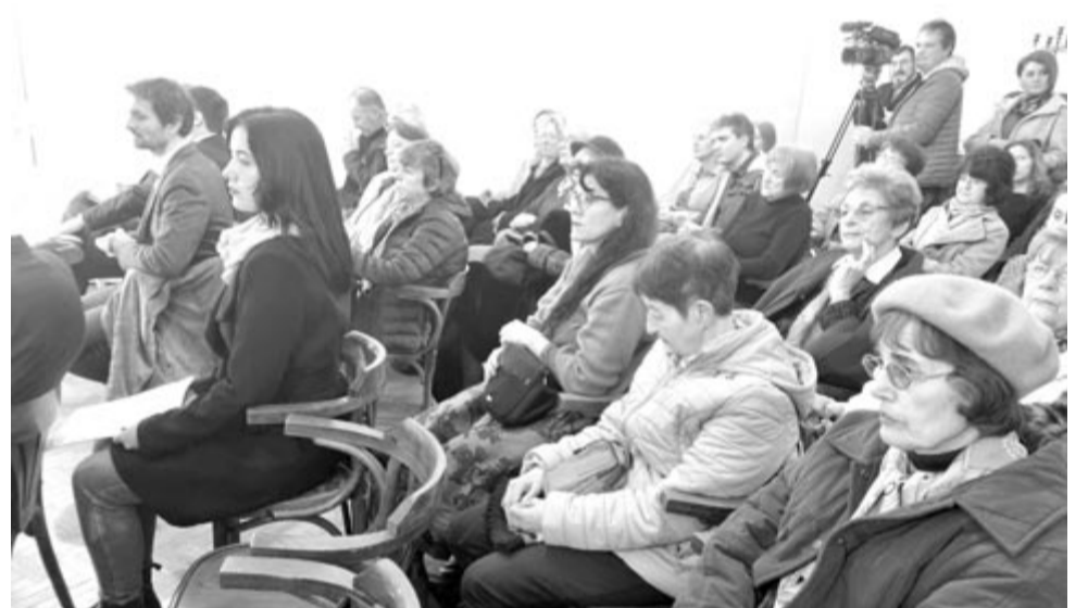
A megnyitó résztvevői