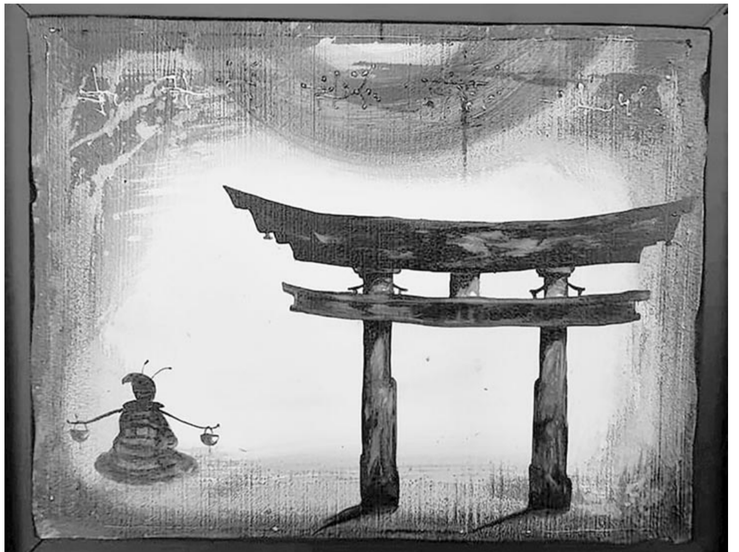
Mellékletünket Bajkó Attila alkotásaival illusztráltuk