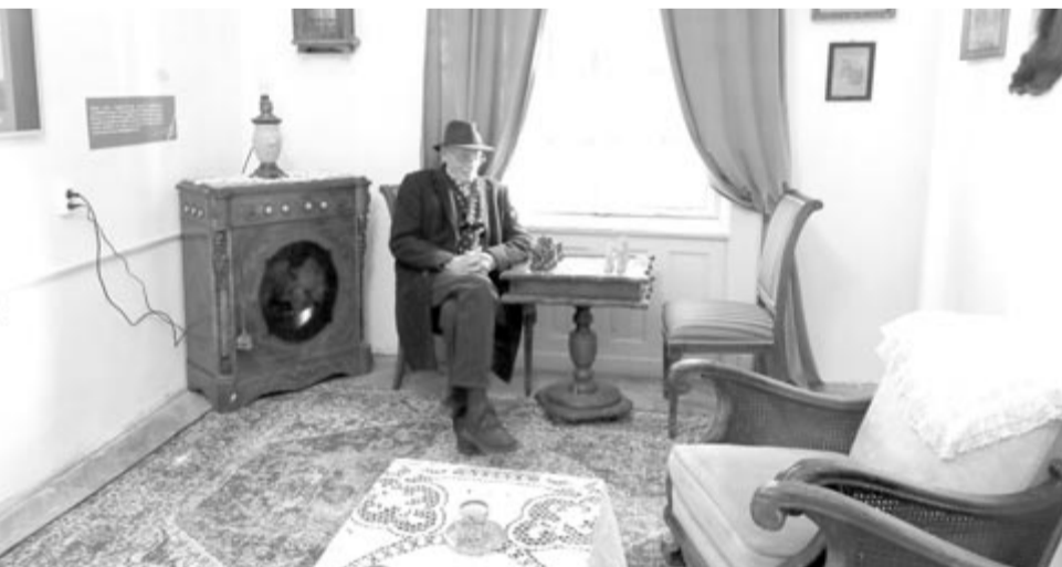
Tisza Kálmán a kutyfalvi emlékszobában