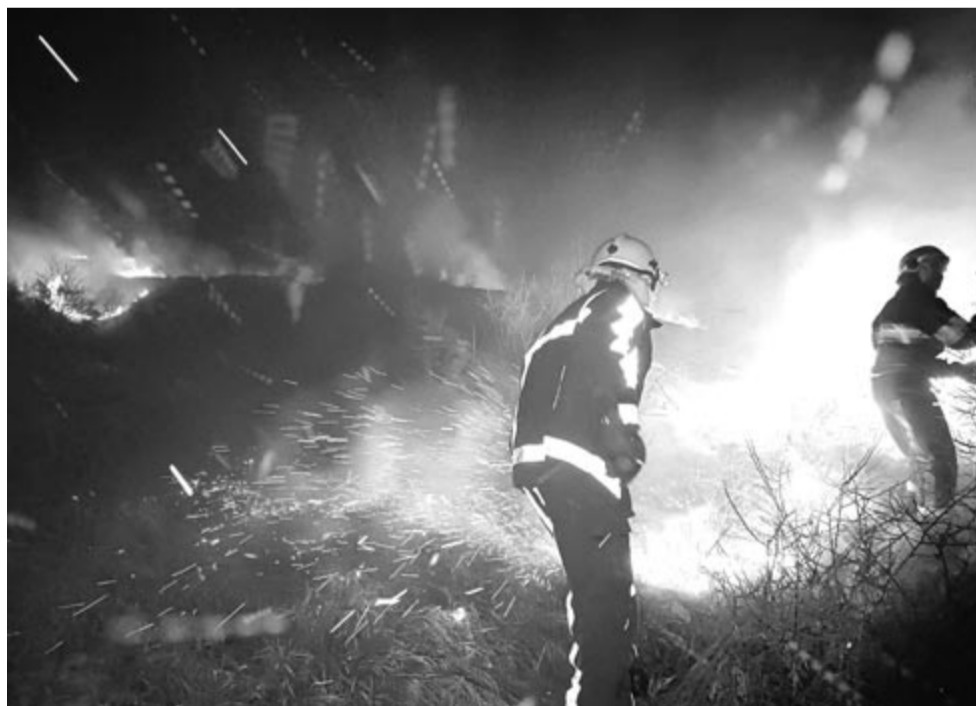
Geges környékén legalább ötven hektár borult lángba, öt órán át harcoltak a tűzzel