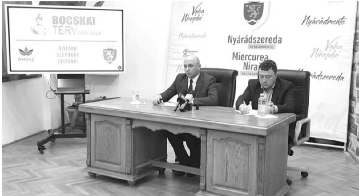
Sikeres volt az elmúlt négy év, a munka folytatódik

A következő négy év a folyamatban levő vagy hamarosan kezdődő 33 projekt megvalósításáról fog szólni, ezt foglalja magában a Bocskai-terv 2.0 nevű, felújított fejlesztési stratégia. Az iskolák felújítása, a székelysárdi és székelytompai iskolák bővítése, tornaterem építése az andrásfalvi iskola mellé, vala-