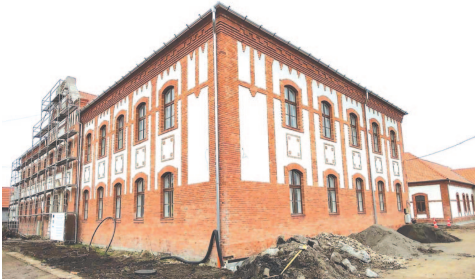
Hamarosan beindul az inkubátorház, gazdaságélénkítést várnak tőle