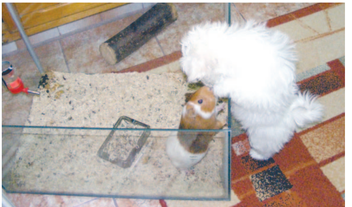
Malacka és Pamac – tengerimalac-kutya barátság