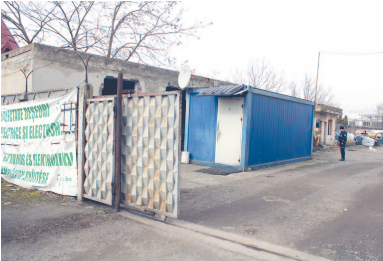
A tavaszi lomtalanítási akció lejárta után is lesz lehetőség a nagy méretű hulladék elhelyezésére a Raktár utca 24. szám alatti hulladéklerakatban