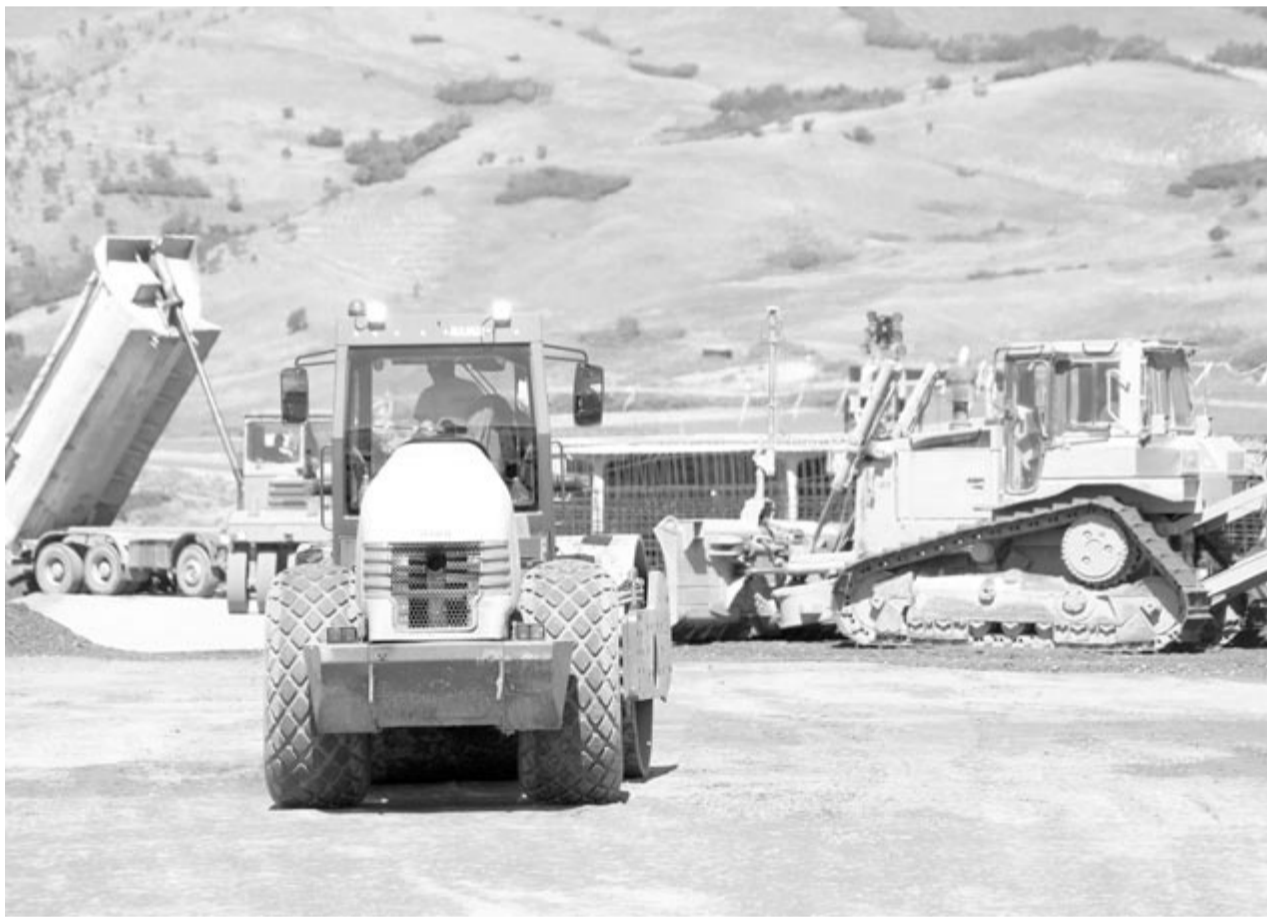
Véget ért a hercehurca, a törökök építenek a Nyárádmentén

A moldovai vagy Egyesülés autópályának nevezett A8-as sztráda összesen 304 km hosszú, és Marosvásárhelytől a moldovai határig, Ungheni-ig vezet (ahol egy híd épül a Pruton, amellyel összekötik a két országot). Ennek a Marosvásárhely–Németvásár közötti 211 kilométeres szakaszát szeretné megvalósítani PNRR-finanszírozással a szállításiügyi tárca, és ennek a két végső szakaszára írt ki versenytárgyalást a tavaly. Az A8-as autópálya építése kapcsán tavaly csak a harmadik, Németvásár–Leghin közötti 30 kilométeres harmadik részre kötötték szerződést szeptemberben 1,56 milliárd lej értékben, miközben a pálya első, nyárádmenti szakaszára eredetileg tavaly nyáron szerettek volna szerződést kötni.