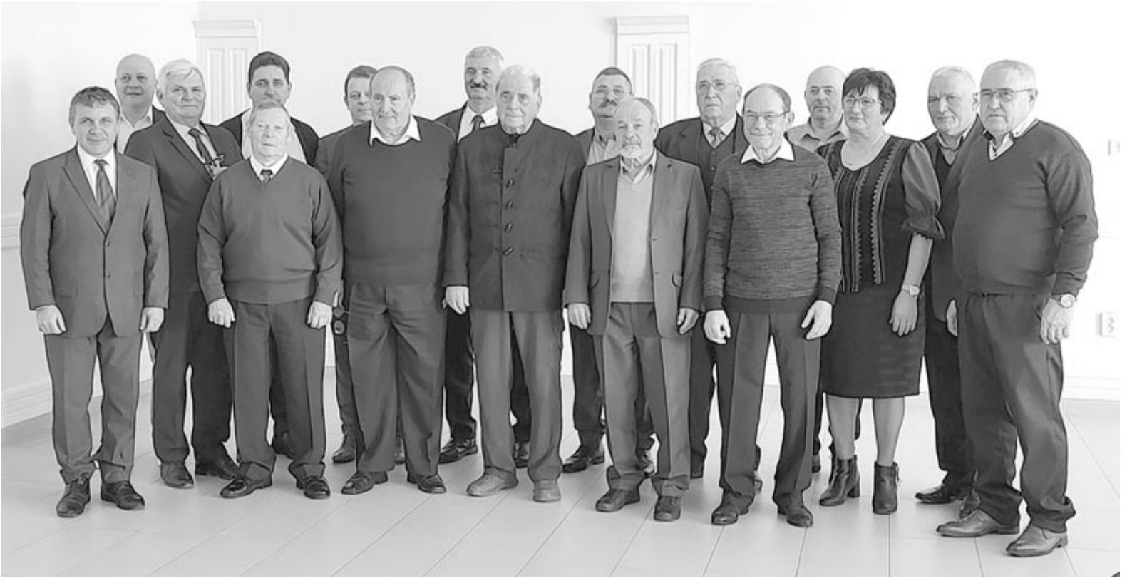
Évente egyszer találkoznak a vidék volt és jelenlegi polgármesterei