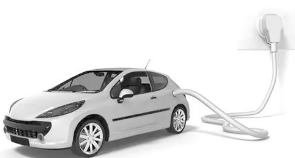
Elektromos autó, illusztráció

vítása, illetve azzal sincsenek tisztában az emberek, hogy egy 6-7 éves akkumulátor mennyire nevezhető jónak. Utóbbi reális kétely, hiszen az idősebb akkumulátorcsomagok már nem képesek az energiát olyan hatékonyan tárolni, ami azt jelenti, hogy a gyári adatokhoz képest komolyan csökkenhet a villanyautók hatótávolsága, valamint idővel mindenképpen szükségessé válik az akkumulátorcsomag karbantartása is, hívta fel a figyelmet dr. Csíki Ottó. Azonban ez a karbantartás nem azt jelenti, hogy az egészet ki kell cserélni, ami hatalmas összeg lenne. Az esetek túlnyomó többségében elég csak egy modult kicserélni, ez pedig nem olyan féltelmetesen drága, mint ahogyan azt sokan gondolják.