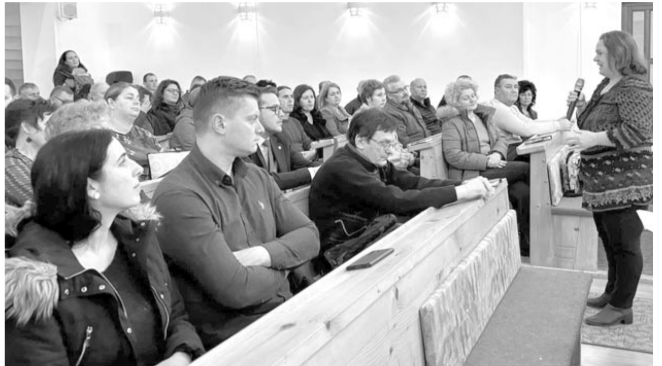
Sok helyen számos érdekesség, kérdés és tanács hangzik el ilyenkor a házasság sikerkulcsairól és buktatóiról

Balavásáron múlt szombaton vette kezdetét a rendezvénysorozat, 65 házaspár ünnepelt, hálát adva, boldogan, gyertyafényes, zenés vacsora keretében, és jelképesen szemeteszsákba dobták a házasság szentségének megromító elemeit, szívüket tisztogatták, hogy szeretet, megbocsátás, hűség töltse be, a sérült virágszirmokból újat, épet készítették, egy csodálatos virágokertet újítottak fel, akárcsak a házasság mindennapjaiban. (GRL)