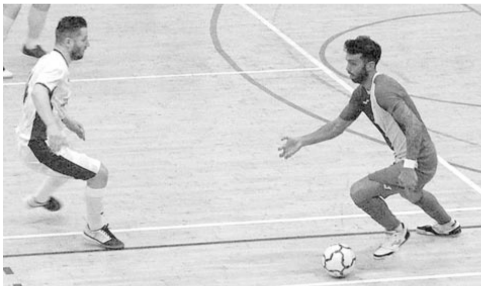
Fotó: a Dévai CSM közösségi oldala