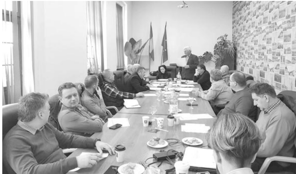
Hét intézkedés keretében elosztható pénzről dönthet a közgyűlés, ha a stratégia megkapja a támogatást

a magán- és civil szektorból való. A 2017–2023-as fejlesztési ciklusban a Nyárádmente Leader Egyesület a rendelkezésre álló pályázati források 98 százalékát ítélte oda 56 pályázat támogatására öt intézkedés keretében, a fennmaradt 50 ezer eurót a következő év végéig lehet felhasználni egy újabb pályázati kiírás nyomán.