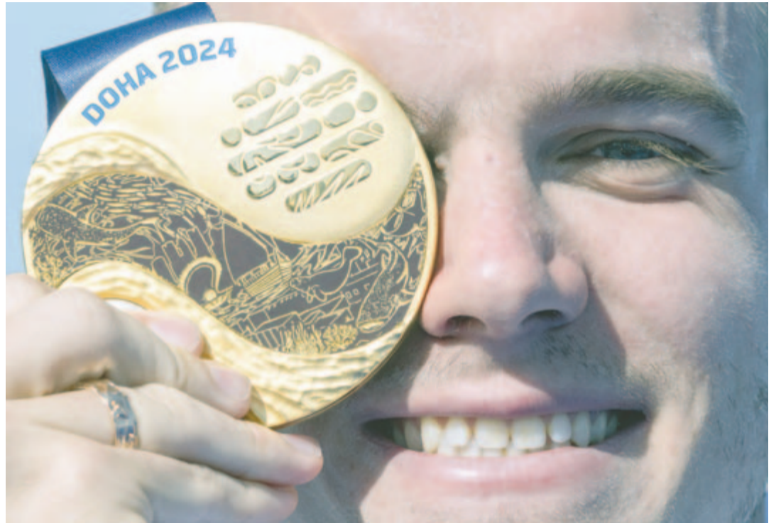
Az aranyérmes Rasovszky Kristóf a férfi nyílt vízi úszók 10 kilométeres versenye után a dohai vizes világbajnokságon 2024. február 4-én