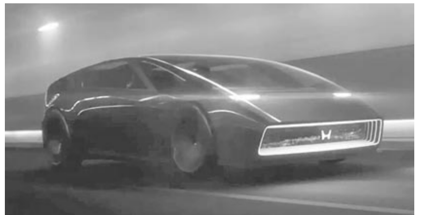
A Honda 0 szériás retró-futurisztikus autója

Az új embléma várhatóan a már említett 0 szériás autók debütál majd, várhatóan 2026-ban.