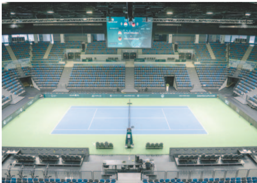
A Magyarország – Németország tenisz Davis-kupa-selejtező helyszíne, a Tatabányai Multifunkciós Csarnok 2024. február 1-jén