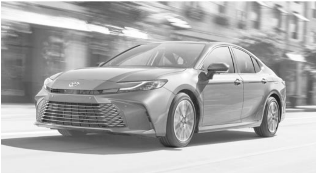
Az új Toyota Camry, amely már csak hibrid hajtással lesz elérhető

Az S&P Global arra is kitért, hogy mely elektromos és hibrid autók uralkodók a piacon. Ennek értelmében a Teslát semmi nem tudja lenyomni a villanyautók piacán, az első helyen a Tesla Model Y áll, az ezüstérmes pedig a Model 3. Harmadik helyen a Volkswagen ID.4 van, viszont ez is mérföldekre le van maradva a Teslától. Hibridfronton pedig a Honda és a Toyota áll a mezőny élén, ami nem is meglepő, hiszen