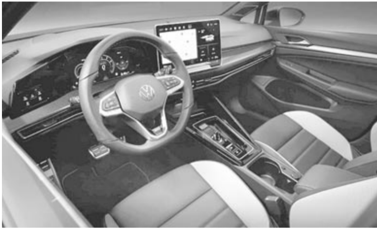
Volkswagen Golf VIII GTI, ráncfelvarrott változat, belső tér