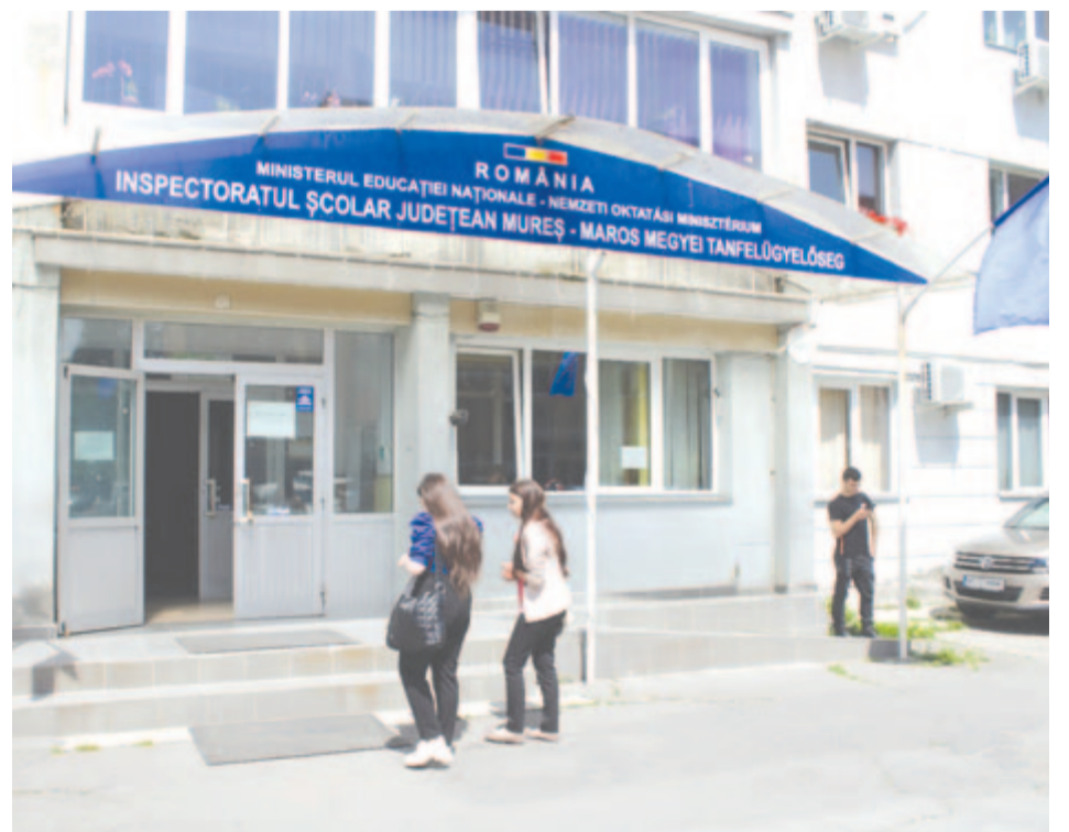
A felvétel illusztráció