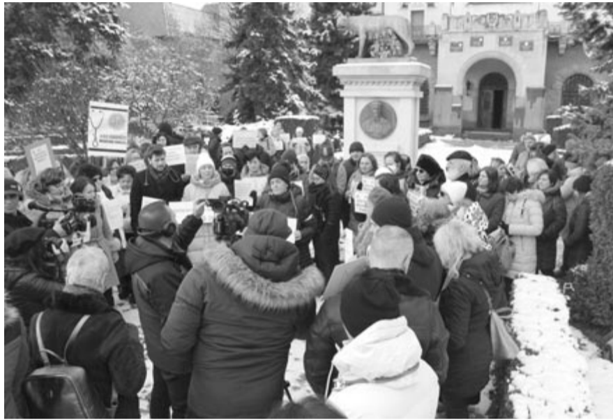
Marosvásárhelyen tüntető családorvosok