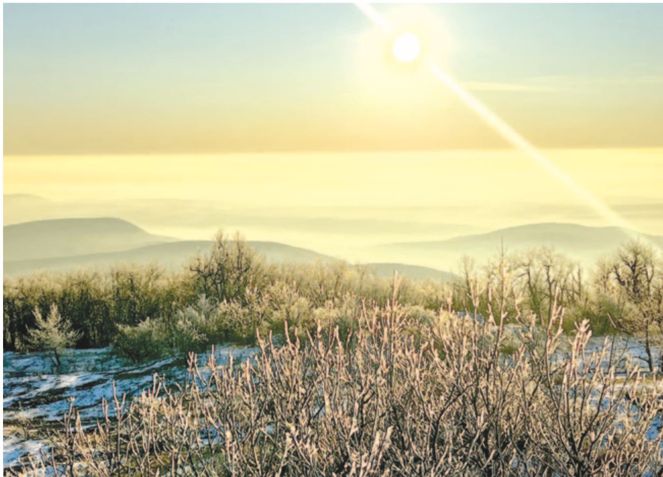
A Kárpátok bércéi felett – nap villogtatja bükkcserjén a dért

Kelt 2024-ben, három Föld-forgásnyira a magyar kultúra napjától