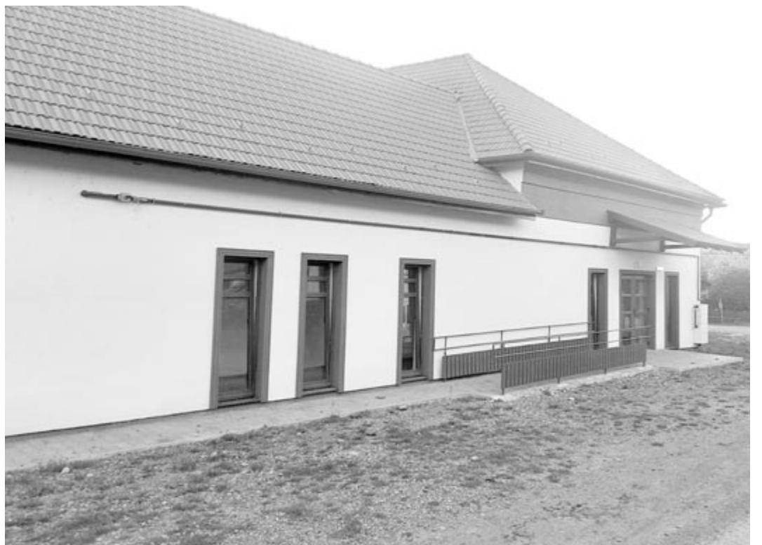
Kálváriát jártak két kultúrotthon felújításával, nehéz volt, de megérte

Sikeresen lezárták a községi közvilágítás felújításának projektjét is, a községhez tartozó mind a négy településen befejezték a tennivalókat. Az 1.077.776 lej értékű beruházáshoz az állam biztosította a finanszírozás nagy részét a Környezetvédelmi Alap révén, ebből a község 215.555 lej önrészt kellett felvállaljon. Voltak olyan utcák, ahová új közvilágítási vezetéke-