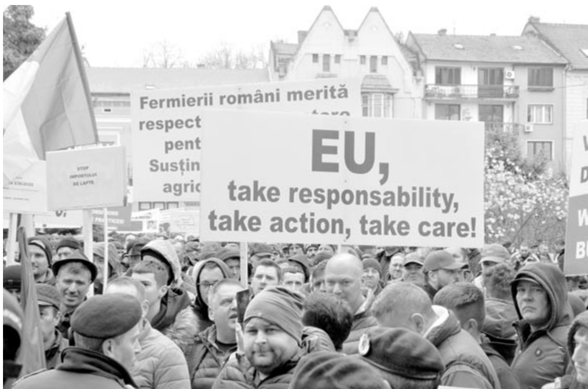
Több tiszteletet kérnek a gazdálkodók

A gazdák ellenzik Ukrajna EU-csatlakozását, ameddig nem teljesíti teljes mértékben mindazokat a mezőgazdasági követelményeket, amelyek érvényesek az összes tagállamra. Új törvényt szeretnének a mezőgazdasági erdős védősávok kialakítására, illetve olyan vetőmaghibridek kifejlesztésére, amelyek ellenállnak a szárazságnak és a kórokozónak. Módosítani kellene az európai nagyvadvédelmet szolgáló