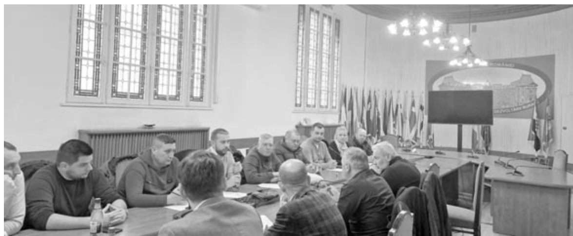
Január 13-én a mezőgazdasági miniszter találkozott a tiltakozók képviselőivel

A hétfői tárgyalások után kiderült, hogy a gazdák megfelelő válaszokat kapnak-e követeléseikre, vagy folytatják tiltakozó akciójukat.