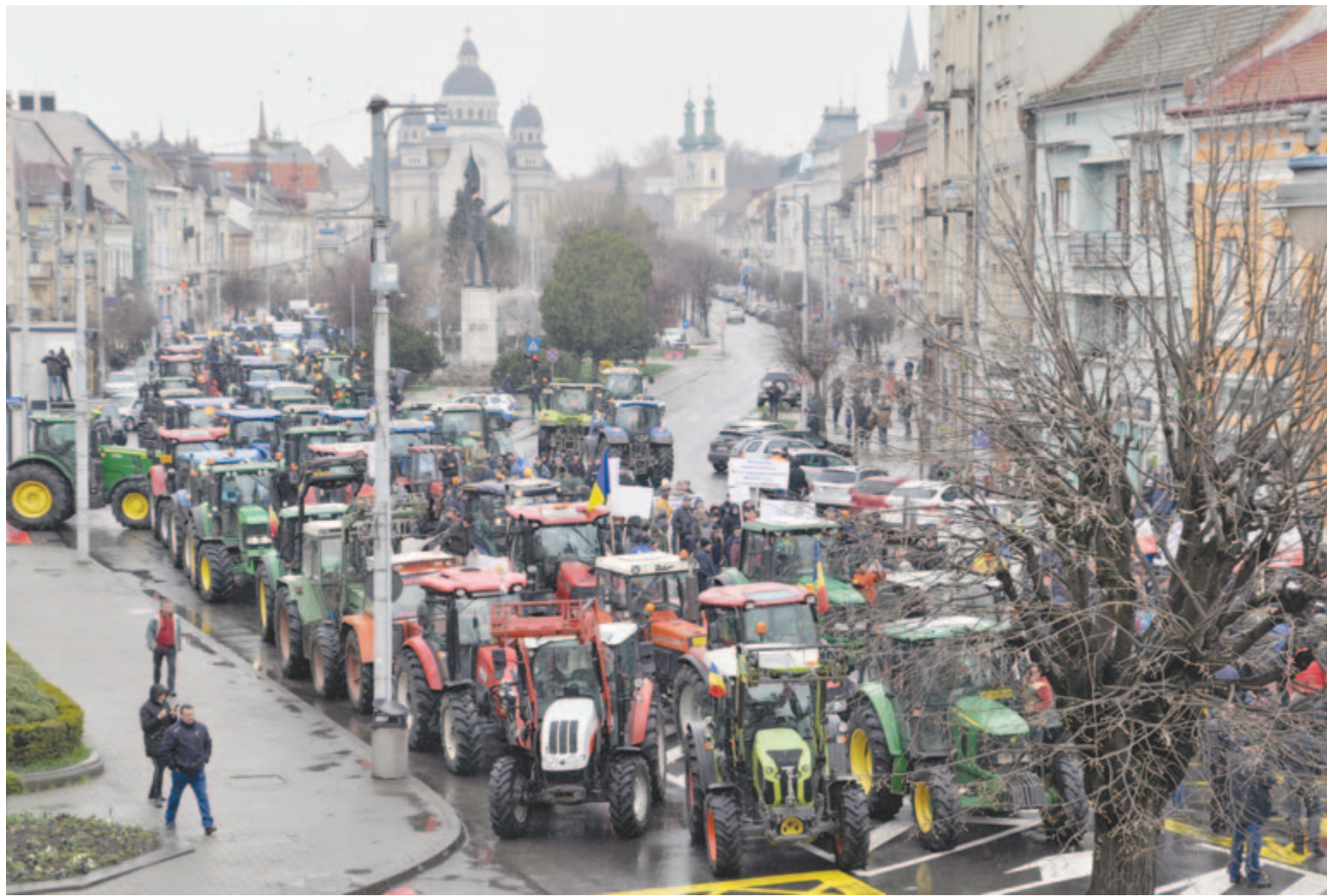
Ezúttal nem munkagépes felvonulásra kaptak engedélyt a gazdák