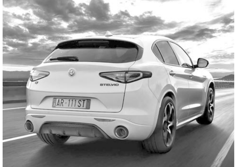
Alfa Romeo Stelvio, az olasz márka legnagyobb SUV-je