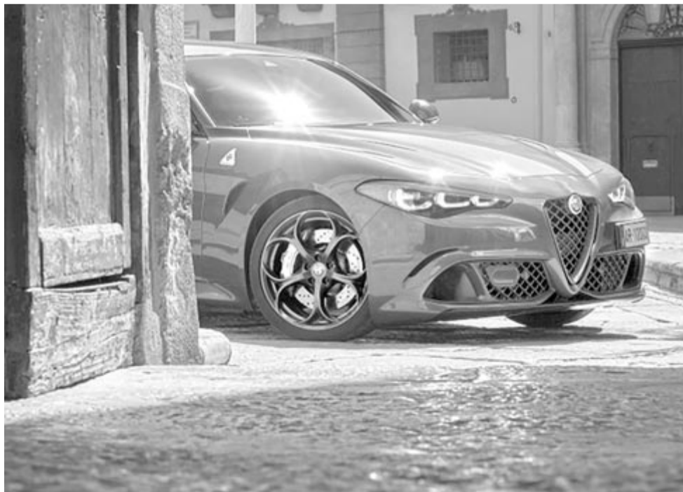
Alfa Romeo Giulia

Az viszont már évek óta látszik, különösen Európában, hogy a szedánok piaca szenved, az Alfa Romeo vezérigazgatója pedig nem vak, ő maga is elismerte, hogy ez az olasz márka esetében is problémát jelent. Azonban, úgy fogalmazott, hogy nem szeretné, ha az Alfa Romeo egy SUV-bázisú márkává válna, még akkor sem, ha a világ ebbe az irányba halad. Ez egy olyan vállalás, amit kevés autógyártó vezetőjétől hallunk, és tagadhatatlan, hogy az Alfának nem a Giulia az egyetlen típusa, amiért kár lenne, ha átfaragná SUV-nek. Aztán az idő majd eldönti, hogy mennyire sikerül az olasz márkának tartania a tervét.