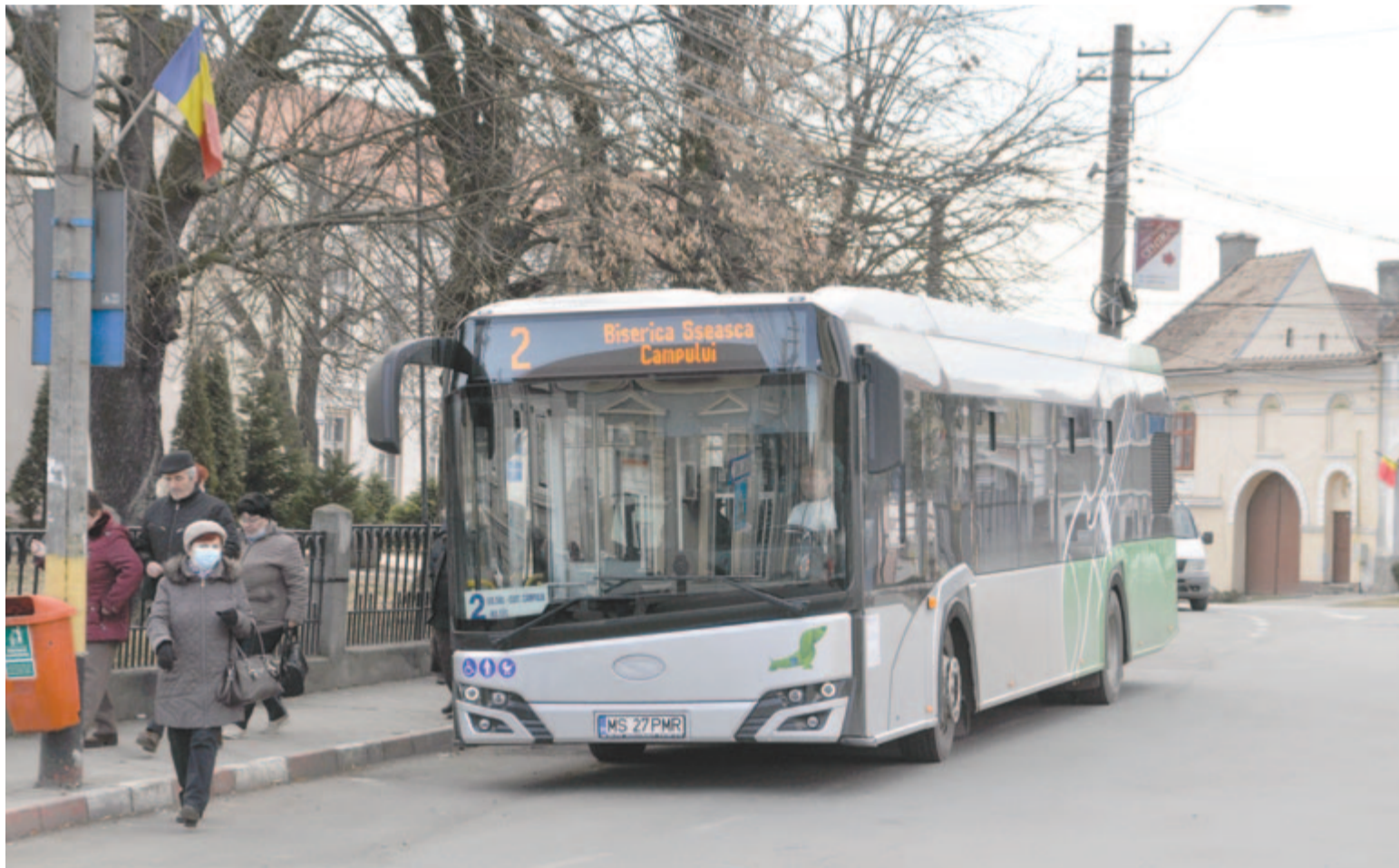
Jó ideje elektromos autóbuszok közlekednek a városban

Ne feledje idejében megújítani előfizetését! Ha előfizet, biztosan kézhez kapja, féláron, mint ha megvásárolná!