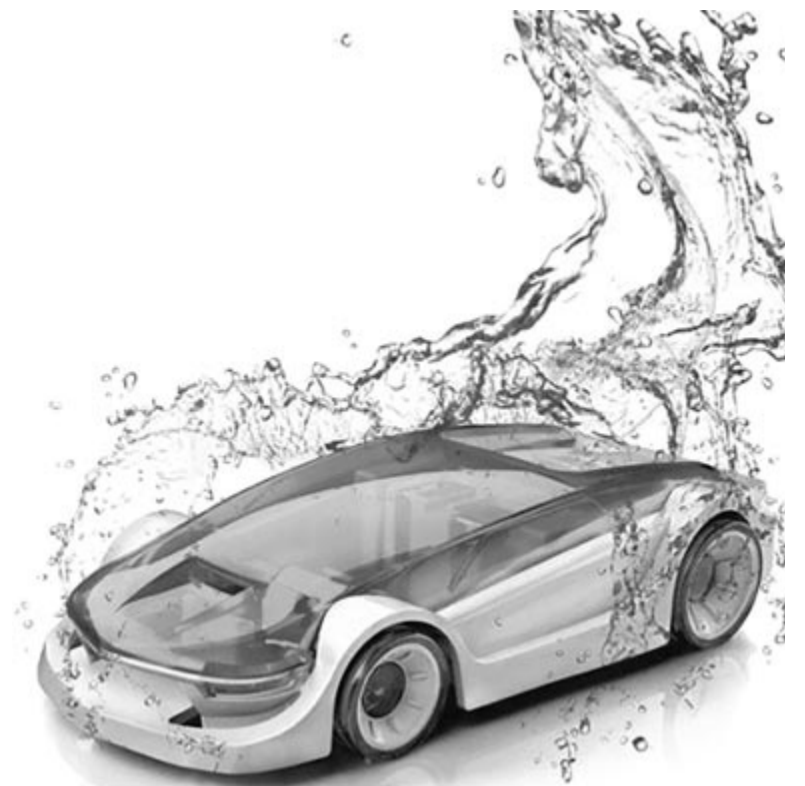
Vízzel hajtott autó, ami soha nem lesz. Illusztráció

kor politikusok szájába tesznek mondatokat, aminek, ahogy az iménti példa is mutatja, sokan bedőlnek? De nem muszáj ekkora horderejű dolgokra gondolni, elég egy kisváros, község vagy falu polgármesterének az állítólagos üzenete, amely felkerül a közösségi hálóra, ahol futótűzként terjed, de gondolhatunk olyan anyagi vonzattal bíró csalásokra is, amelyeknek bárki a keresztútjába kerülhet. A közösségi média rengeteget elárul a felhasználóiról, ezzel pedig a csalók, különösen most, a mesterséges intelligencia révén, könnyen vissza tudnak élni, áldozat pedig bárkiből lehet mindössze pár pillanat alatt. Lehet haragudni a mesterséges intelligenciára, hogy ilyeneket művel, viszont semmi értelme, nem a technológia a hibás, hanem azok a személyek, akik ilyen vagy ehhez hasonló dolgokra használják. Ezért is kell nagyon figyelni azzal kapcsolatban, hogy mit hiszünk el, hiszen az interneten eddig is fellelhetők voltak a csalások, ez pedig a jövőben még rosszabb lehet. Talán ezért