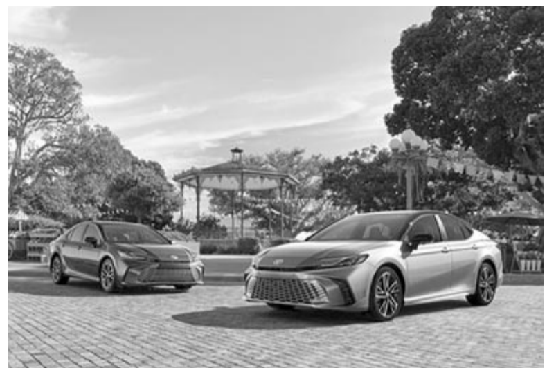
Toyota Camry 2025

Ami a hajtásláncot illeti, a Camry csak hibrid rendszerben lesz elérhető, tisztán elektromos változat