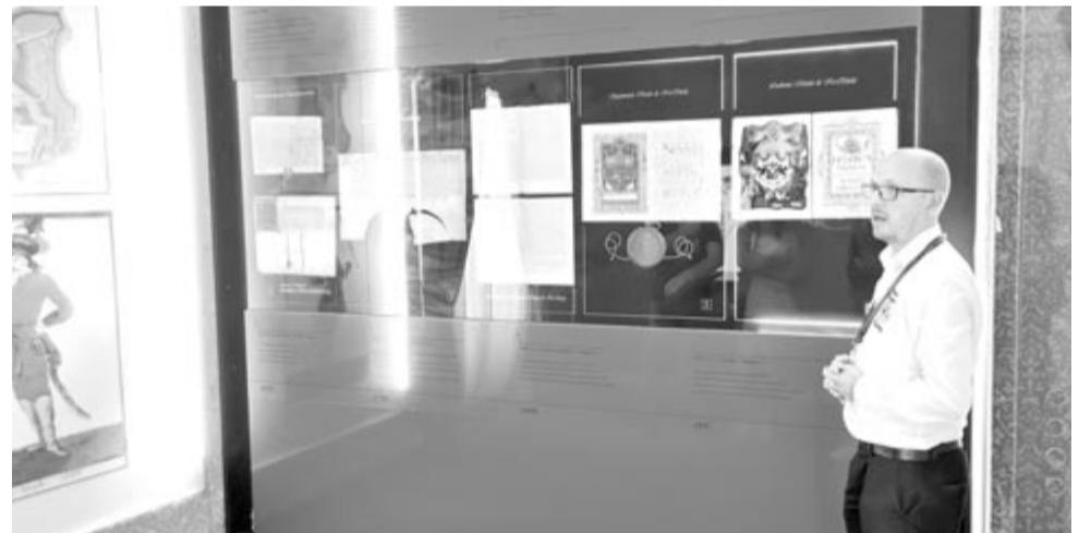
A turistáknak tetszik az interaktív tárlatvezetés

E gy kisgyermek lelkébe néha – vagy inkább nagyon is gyakran – az egész világ becsomagolódik. Nemcsak a megnyugtatóan szép és kedves mozaikdarabkák, hanem az ijesztően komorak, zordak is, amelyeket felnőtként a legszörnyesebben meg sem látnánk, és ha mégis, akkor minden bizonnyal elmarasztalunk. Az alábbi történetet egy kisiskolás leányka édesanyja osztotta meg velem a minap, és egyetértünk abban, hogy ebből a szívmengető adventi igaz meséből másokat is jó lesz „megkínálni”, mint a frissen süttöt, puha mindennapi kenyérből, ami a hiány időszakában csodálatos módon megszorodik.