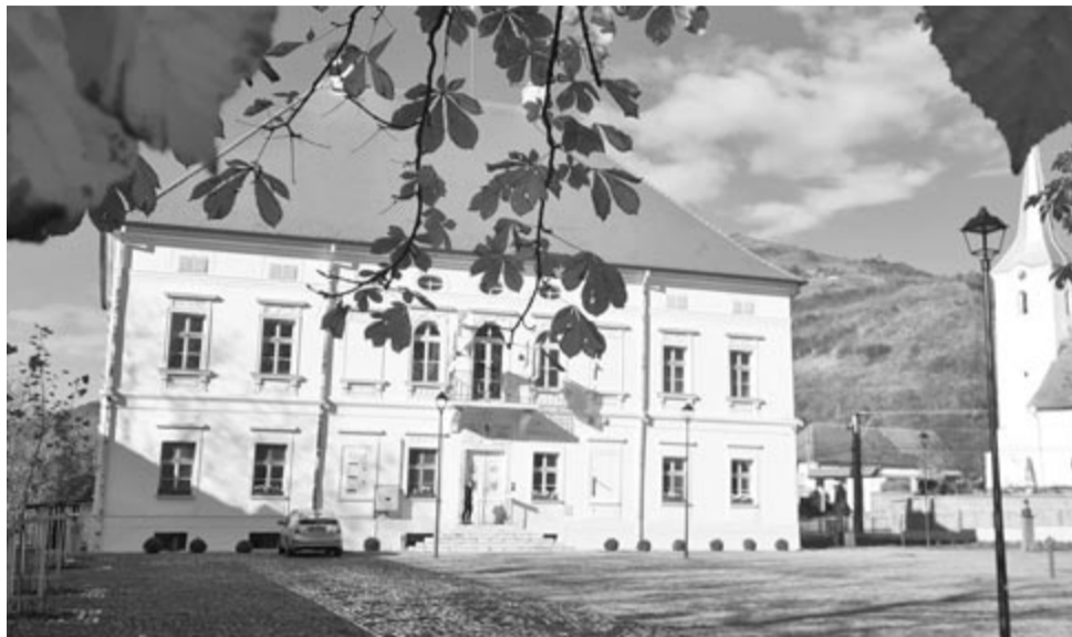
Az erdőszentgyörgyi kastély hamar a turisták kedvence lett

Azért is népszerű a turisták körében az erdőszentgyörgyi kastély, mivel a látogatói visszajelzések 4-5 csillagosak, ezért az internetes keresőmotorok az elsők között „dobják be” ezt az objektumot. A turisták többnyire tudatosan választják ezt a célpontot: a világ bármely táján élő magyarok már úgy érkeznek, hogy tudják, ki volt Rhédey Klaudia. Ez nem volt elmondható a román tu-