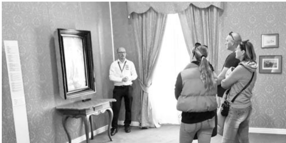
Idén rendkívül sokan voltak kíváncsiak a tárlatokra