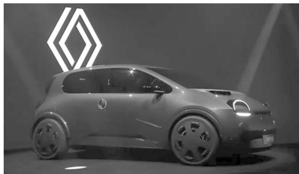
Elektromos Renault Twingo-koncepció

az arról is beszélt, elmondása szerint a cél az, hogy egy olcsó városi elektromos autót tudjanak létrehozni, amely megközelítőleg 20.000 euróról indul. Ez a szám egyelőre nem több hangzatos ígéretnél, mert senki nem láthatja előre, hogy milyen lesz a gazdasági környezet három év múlva, valamint azt