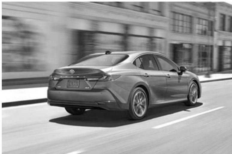
Az új Toyota Camry hátulról

így sokkal komfortosabb és kiszámíthatóbb lesz. Továbbá a típus megkapja az összes jelenleg elérhető vezetéstámogató rendszert, mint például távolságtartó tempomat, sávellahagyásra figyelmeztető rendszer, illetve vészfékasszisztens. Az alapkivitelbe azért minden figyelmeztető rendszer nem fér bele, tehát például a holttérfigyelőhöz már egy kicsit mélyebben a zsebébe kell nyúljon a vásárló. Azt viszont nem tudni, hogy mennyivel, mivel árat még nem közölték. Igaz, még korai is lett volna, hiszen 2025 messze van. Azt viszont elárulta a Toyota, hogy az új Camryt egyelőre csak az Egyesült Államokba szánja. Azt nem tudni, hogy idővel eljut-e a modell Európába, ami nem kizárt, hiszen a jelenlegi változat is népszerű az öreg kontinensen.