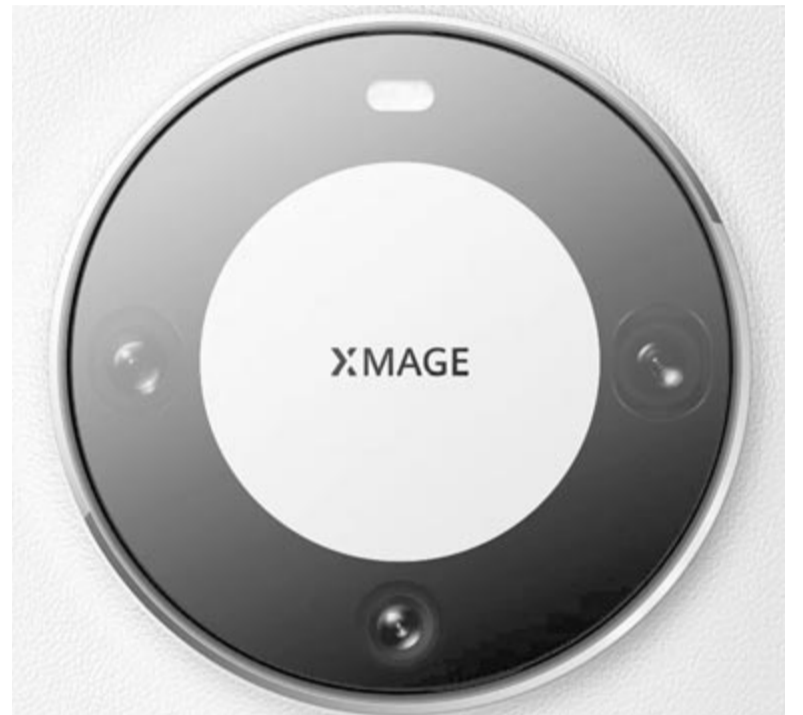
Huawei Mate 60 Pro+ kamerarendszer

Az amerikai–kínai kereskedelmi háború miatt a Huawei a Leica lencsegyártóval sem dolgozhat együtt, így nem díszel a telefon kameráján a Leica felirat, ami már önmagában is vásárlásösztönző volt. Ennek ellenére a hátdoldali főkamera 48 megapixel felbontású ké-