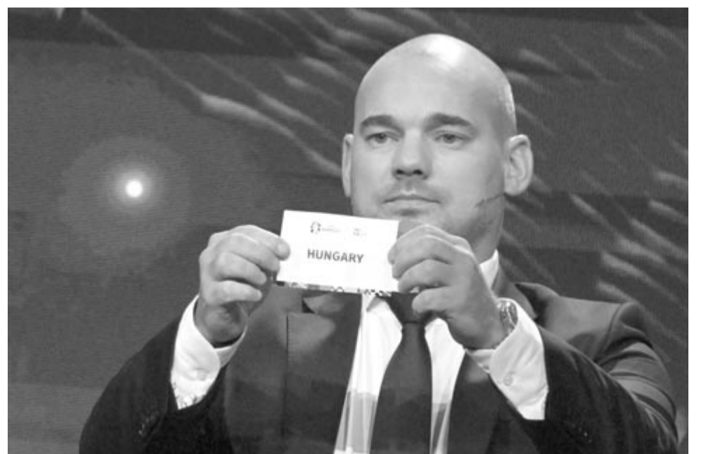
Wesley Sneijder visszavonult holland labdarúgó mutatja Magyarország nevét a 2024-es németországi labdarúgó-Európa-bajnokság csoportosorsolásán a hamburgi Elbphilharmonie épületében 2023. december 2-án.

kel játszanak, június 23-án pedig ugyanitt a skótokkal találkozni a kontinenstornán. Románia Belgiummal és Szlovákiával, valamint az Izrael/Bosznia-Hercegovina/Ukrajna/Izland pótselejtezős négyes győztesével került azonos csoportba. A csoportokból az első kettő továbbjut, a hat csoport harmadikból pedig a legjobb négy folytathatja az Eb nyolcaddöntőjében.