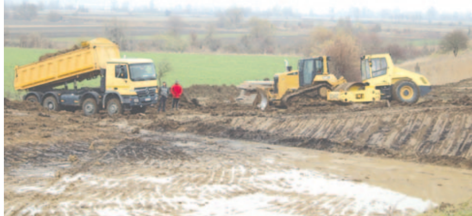
Készül a hulladékudvar

Ugyancsak egy nyertes pályázatnak köszönhetően már épül Egrestő és Kend között, a szennyvíztisztító állomás szomszédságában a szelektív hulladékudvar, ami lehetőséget biztosít majd a lakosságnak, hogy megszabaduljon azokról a hulladéktípusokról, amelyeket nem visz el a szemétszállítással megbízott cég. A pályázat két részből áll: a 2400 négyzetméteres betonplatform megépítése az önkormányzat feladata, a mérleg biztosítása szintén, a konténereket pedig a szaktárca biztosítja. A hulladékudvarban külön konténert állítanak fel a növényi maradványoknak, az építkezési törmeléknek, a veszélyes hulladéknak, az állattetemeknek, bútordaraboknak, a gumiabroncsoknak, a kartonnak, papírnak, a műanyagoknak pedig kompressziós konténer lesz biztosítva. Amíg az időjárás engedi, dolgozik a kivitelező, a szerződés értelmében szeptemberre kell elkészülnie a beruházás – tudtuk meg a község vezetőjétől.