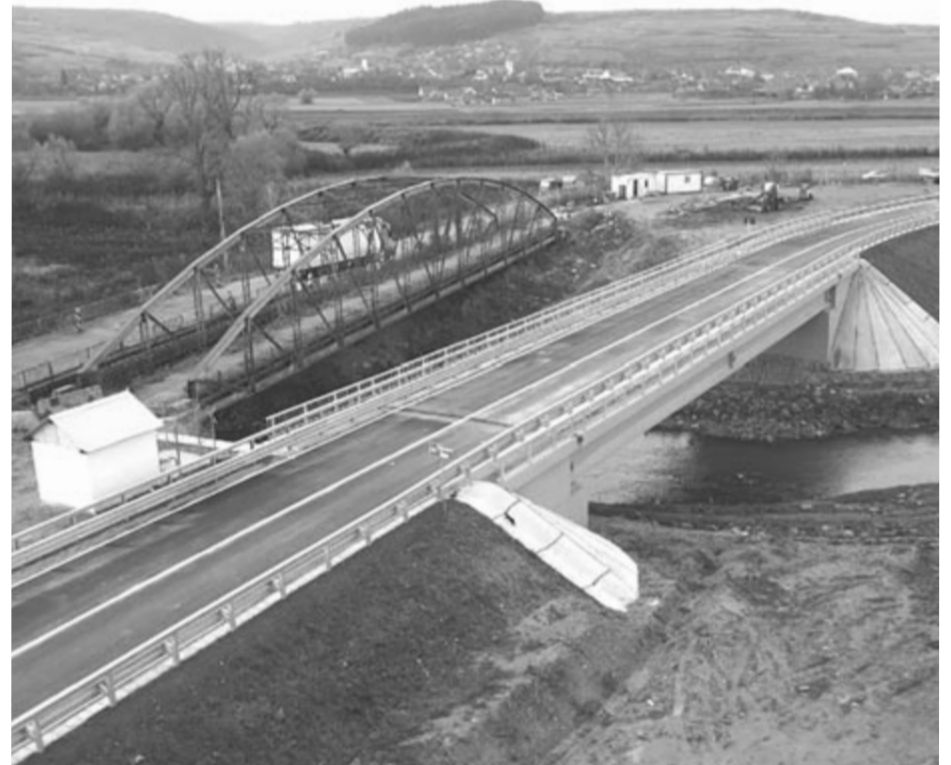
Az új híd mellett a régi vashíd