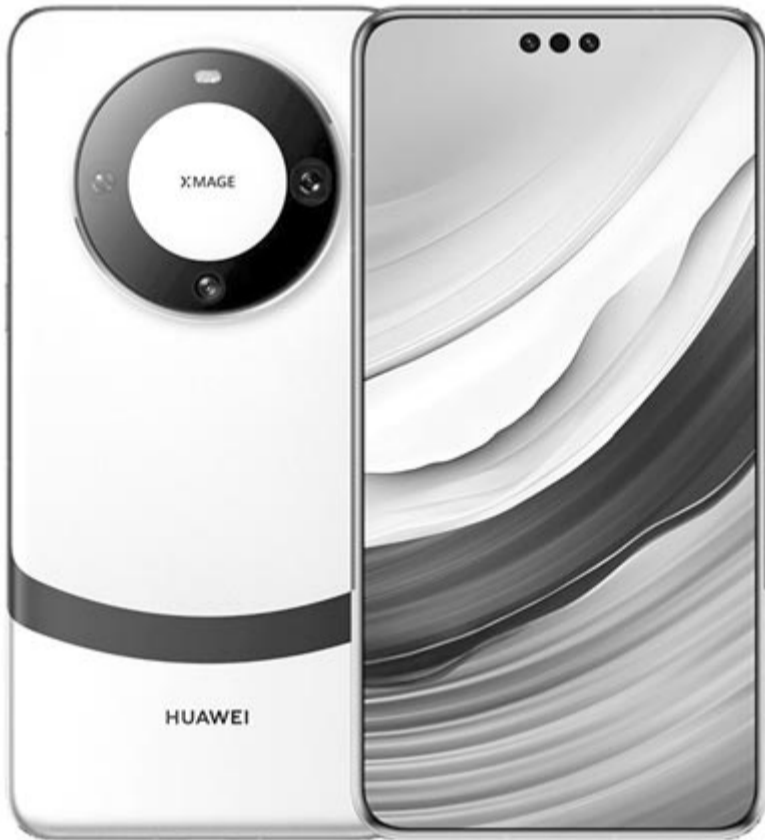
Huawei Mate 60 Pro+