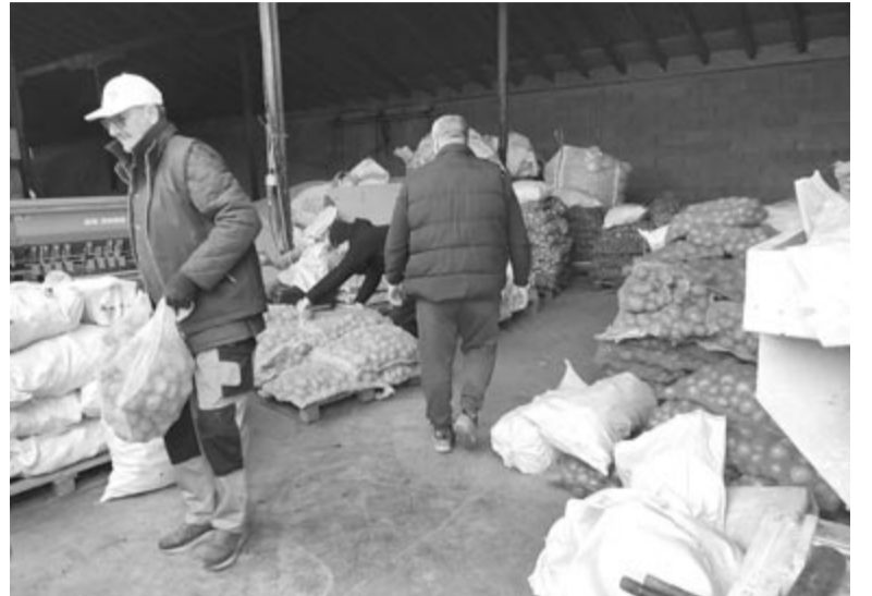
A megyénkbe érkező mennyiséget idős- és gyermekotthonok, szörványkollégiumok és segélyszervezetek között osztják szét