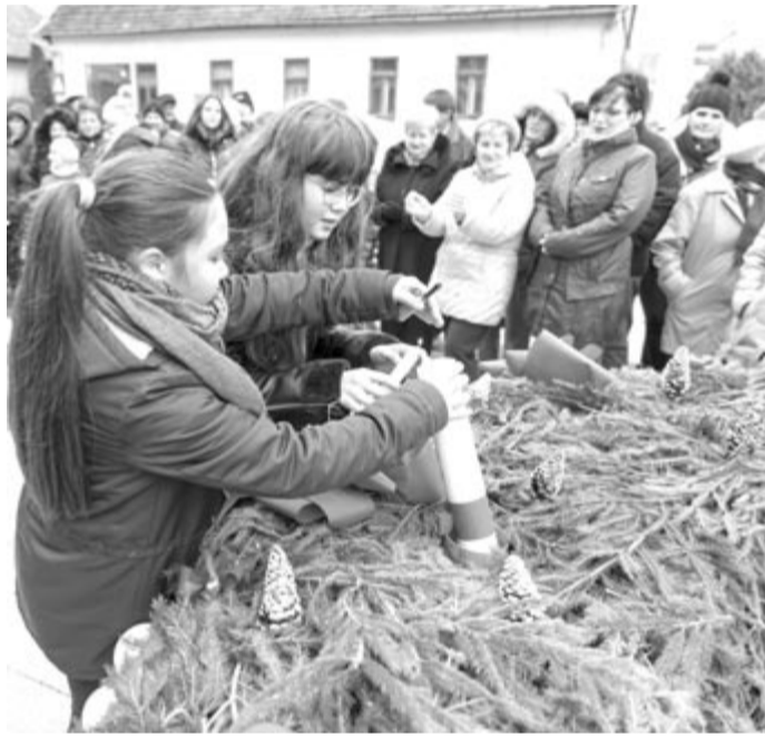
Sok helyen közösségben is meggyújtják a gyertyákat, együtt várják a Megváltó érkezését.