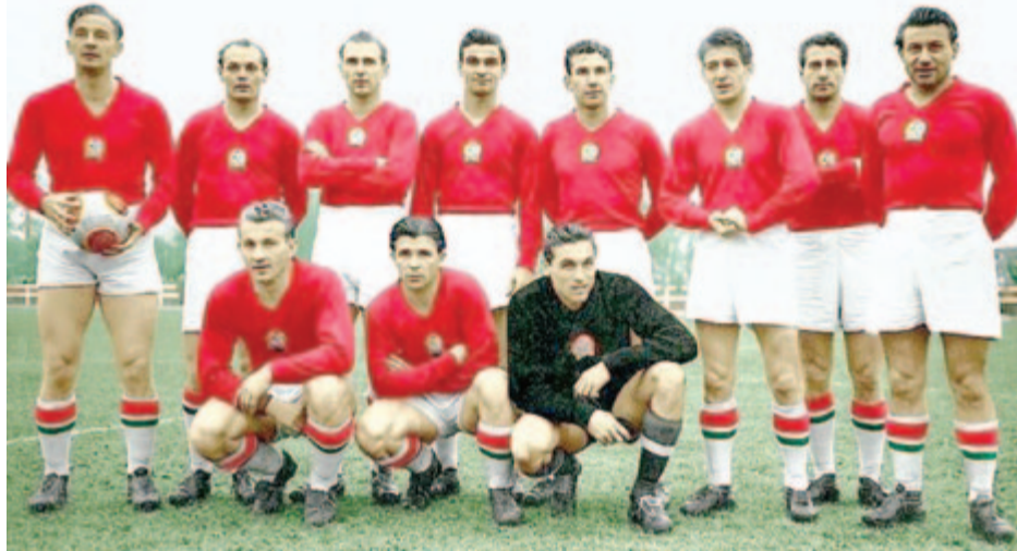
A Londonban győztes Aranycsapat: Grosics Gyula, Gellér Sándor, Buzánszki Jenő, Lóránt Gyula, Lantos Mihály, Bozsik József, Zakariás József, Budai II. László, Kocsis Sándor, Hidegkuti Nándor, Puskás Ferenc, Czibor Zoltán.

Magyarország: Grosics (Gellér, 74.) – Buzánszky, Lóránt, Lantos – Bozsik, Zakariás – Budai, Kocsis, Hidegkuti, Puskás, Czibor.