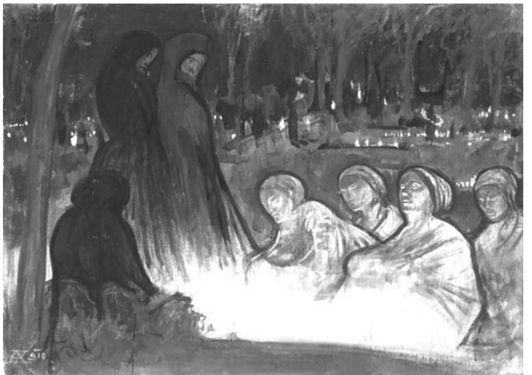
Kőrösfői Kriesch Aladár: Halottak napja, 1910

75 éve, 1948. július 25-én született Szekszárdon a József Attila-díjas költő, műfordító, a Digitális Irodalmi Akadémia posztumusz tagja. Elhunyt 1995. szeptember 20-án Szegeden.