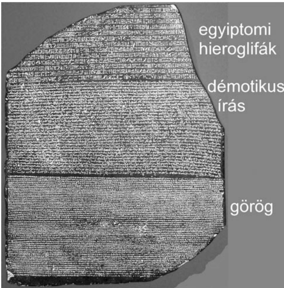
A rosette-i kő

A történet egy rendkívüli emberrel áll szoros kapcsolatban. Thomas Young 1773-ban született egy Somerset nevű angliai városban. A család egy roppant ritka vallási felekezetnek volt a tagja. A kvéker mozgalom a kereszténységhez tartozik, de nincs saját hitvallása. Ez a XVII. században Angliában megalakult vallási felekezet az igazságon, egyenlőségen és a békén alapul, hivatalos nevük Barátok Vallásos Társasága. A vallási irányzat egy másik érdekessége, hogy istentiszteleteiken nem egy prédikátor hirdeti az igét, hanem a gyülekezeti tagok osztják meg egymással hitbeli nézeteiket, amit a Szentírás alapján közösen megbeszélnek. A felekezet tagjai egyszerűen öltözködnek, beszédük visszafogott és alázatos, üzleti életükben nincs alkudozás, sikereikkel nem hivatkoznak. Young e vallási felekezethez való tartozása különös jelentőséget kap a hieroglifák megfejtésének történetében.