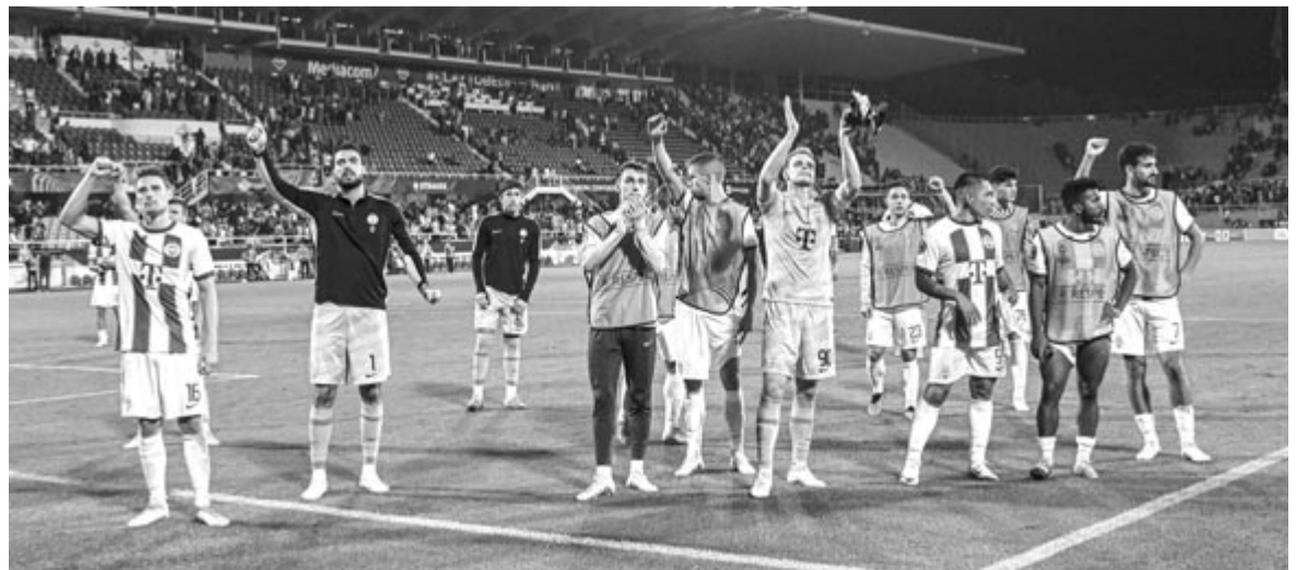
A firenzei vendégjáték (Fiorentina – FTC 2-2) után ismét idegenben lép pályára a Ferencváros

A Genk – Ferencváros találkozót ma 22 órától az M4 Sport és a Kosuth rádió is élőben közvetíti.