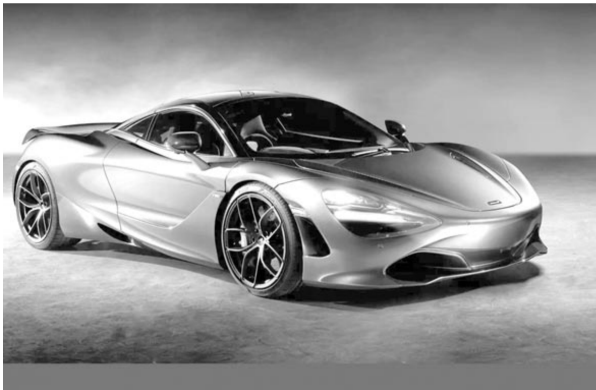
McLaren 720S Coupe, illusztráció

Egyelőre nem tudni, mi lesz a McLaren következő lépése, ami az SUV-kat illeti, viszont egy darabig valószínűleg nem érkezik elektromos modell tőlük. Azonban borítékolható, hogy a mindennapi autózásban az elektrifikáció jelenti a jövőt.