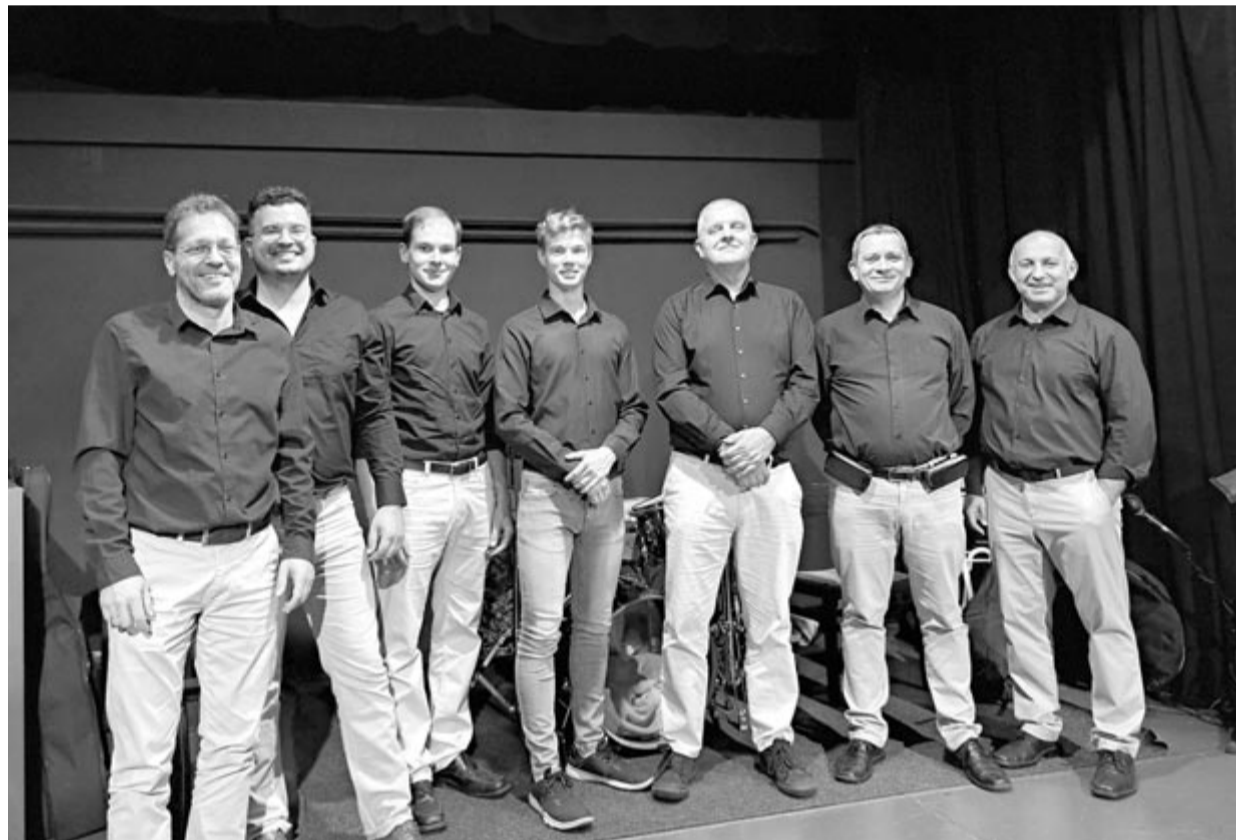
Bohém Ragtime Jazz Band

lyi Nemzeti Színház, a Liszt Intézet – Magyar Kulturális Központ, Bukarest. Főtámogatók: Marosvásárhely Polgármesteri Hivatala, a Kultúrminisztérium, a Communitas Alapítvány, a Román Nemzeti Filmintézet, a Bethlen Gábor Alap (Magyarország). További részletek az alternativeiff.ro oldalon.