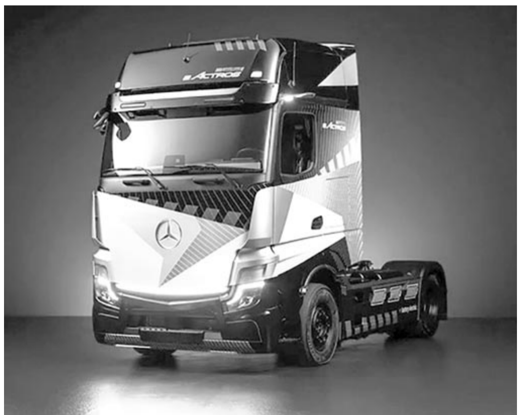
Mercedes-Benz eActros 600, LongHaul

Az eActros LongHaul hosszú távú használat mellett 536 lóerőt és ideiglenesen 804 lóerőt tud leadni. A gyártó elmondása szerint a típust úgy tervezik, hogy legalább 10 évig és 1,2 millió kilométerig ne legyen vele nagyobb probléma. Az október 10-én bemutatott típus első példányai jövőben érkehetnek meg az ügyfelekhez.