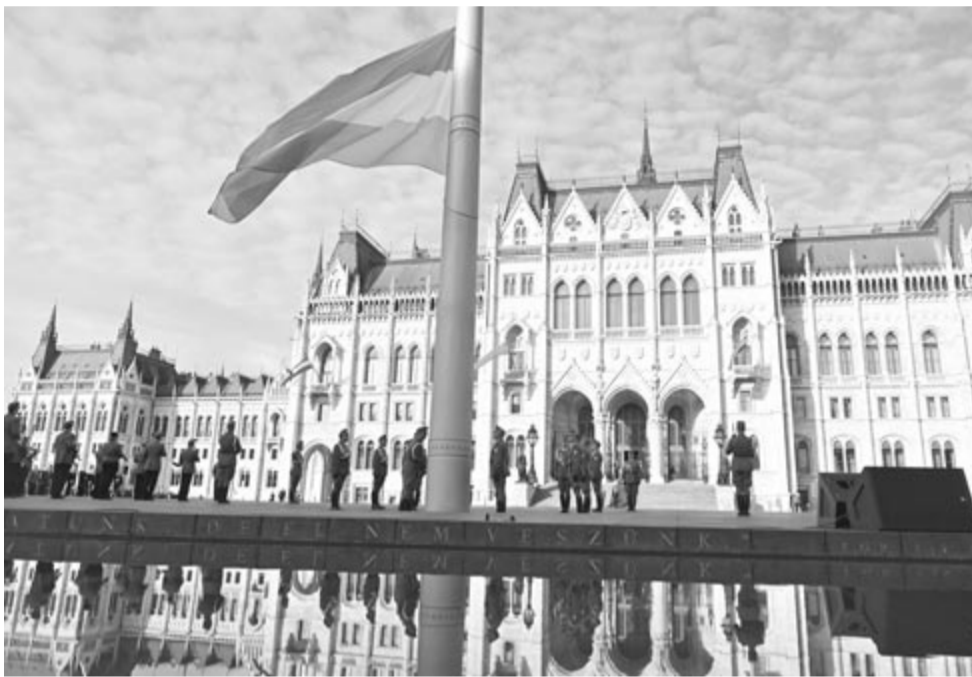
Budapesti megemlékezés október 23-án

A rendszerváltozás után összeülő első szabad Országgyűlés első ülésnapján, 1990. május 2-án, első törvényében az 1956. évi forradalom és szabadságharc emlékét örökítette meg, október 23-át pedig nemzeti ünnepé nyilvánította. 1992 novemberében Borisz Jelcin orosz államfő magyarországi látogatása során az Országgyűlésben mondott beszédében megkövette a magyar nemzetet az 1956-os szovjet beavatkozásért.