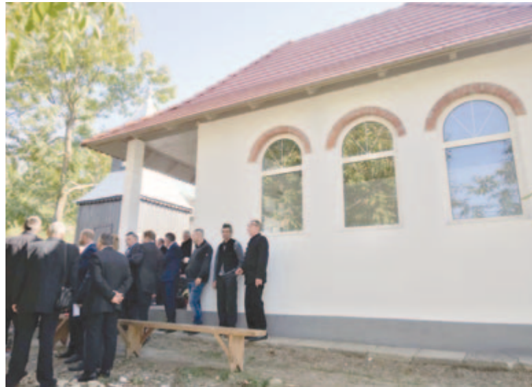
A szálteleki templom