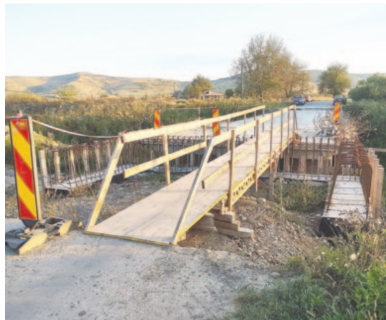
Több mint három hónapja szünetel a munka a hídnál