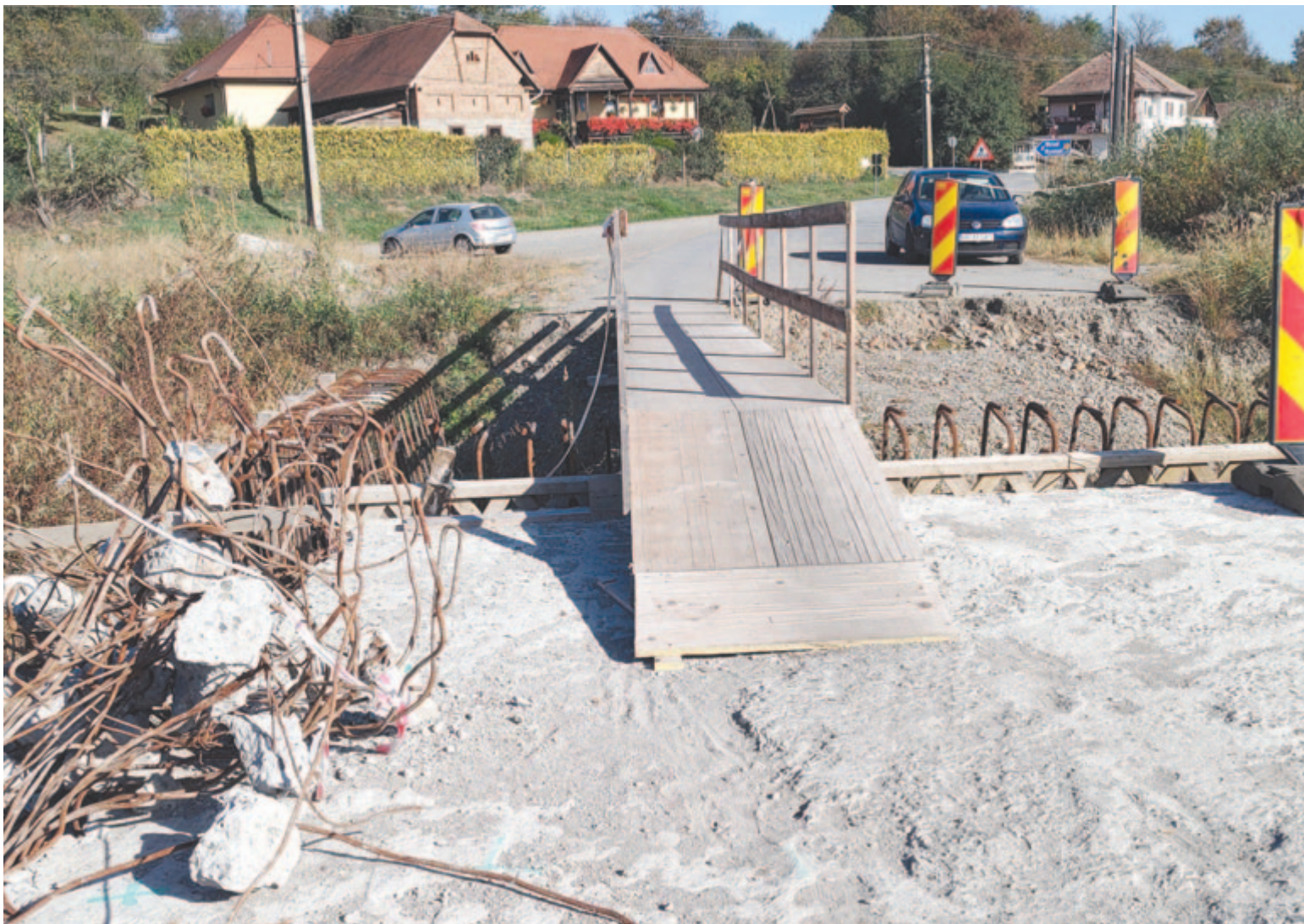
A híd és a járda eredeti vasazata rozsdamarta, nem megfelelő, nem biztonságos, ezért új műszaki megoldásokra van szükség

Bő három hónapja nem dolgoznak a munkások a Nyárad-híd felújításán a Nyárádszereda és Ákosfalva közötti 151D jelzésű megyei úton, Nyárádszentlászlón. Többen tervezési hibákra gondolnak a munkabeszüntetés háttereként, tény azonban, hogy a beruházás idén már nem fejeződik be. Ennek okairól kértünk felvilágosítást.