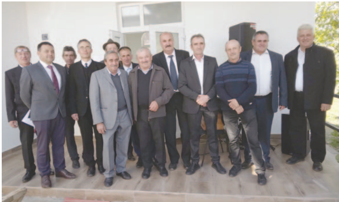
A mezőbergenyei templomépítők

Az összefogás szép példáját élhettük meg a templomszentelésen, ahol az is elhangzott, hogy a bergenyeci lelkészcsalád női tagjai, akik profi muzikusok, a közeljövőben szimfonikus koncerttel is megörvendeztetik a közösséget.