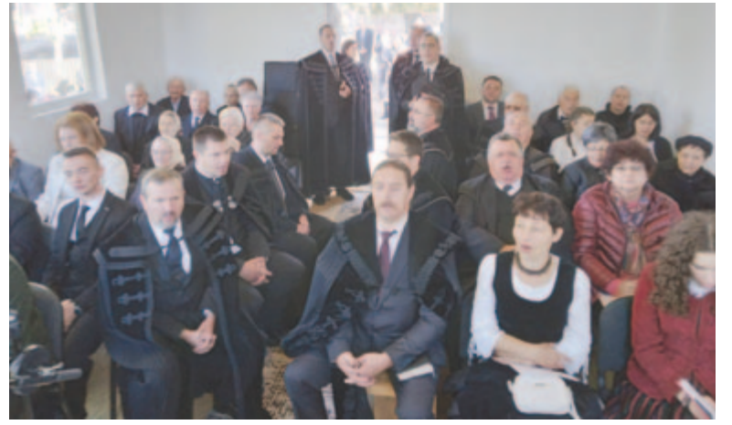
Az ünneplő gyülekezet

A munka terhének nagy része a mezőbergenyei gyülekezetre hárult, ahol az ötlet született. Sok segítség érkezett a mezőbándi önkormányzattól. 2021 őszén kitakarították a telket, s következő tavasszal kijelöl-