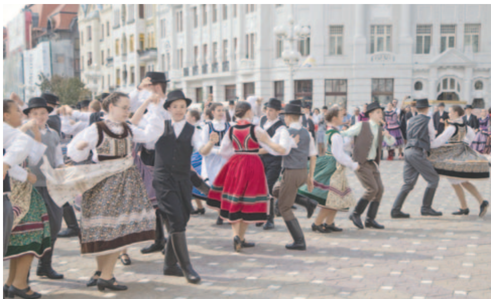
Néptáncos villámcsődület Temesváron