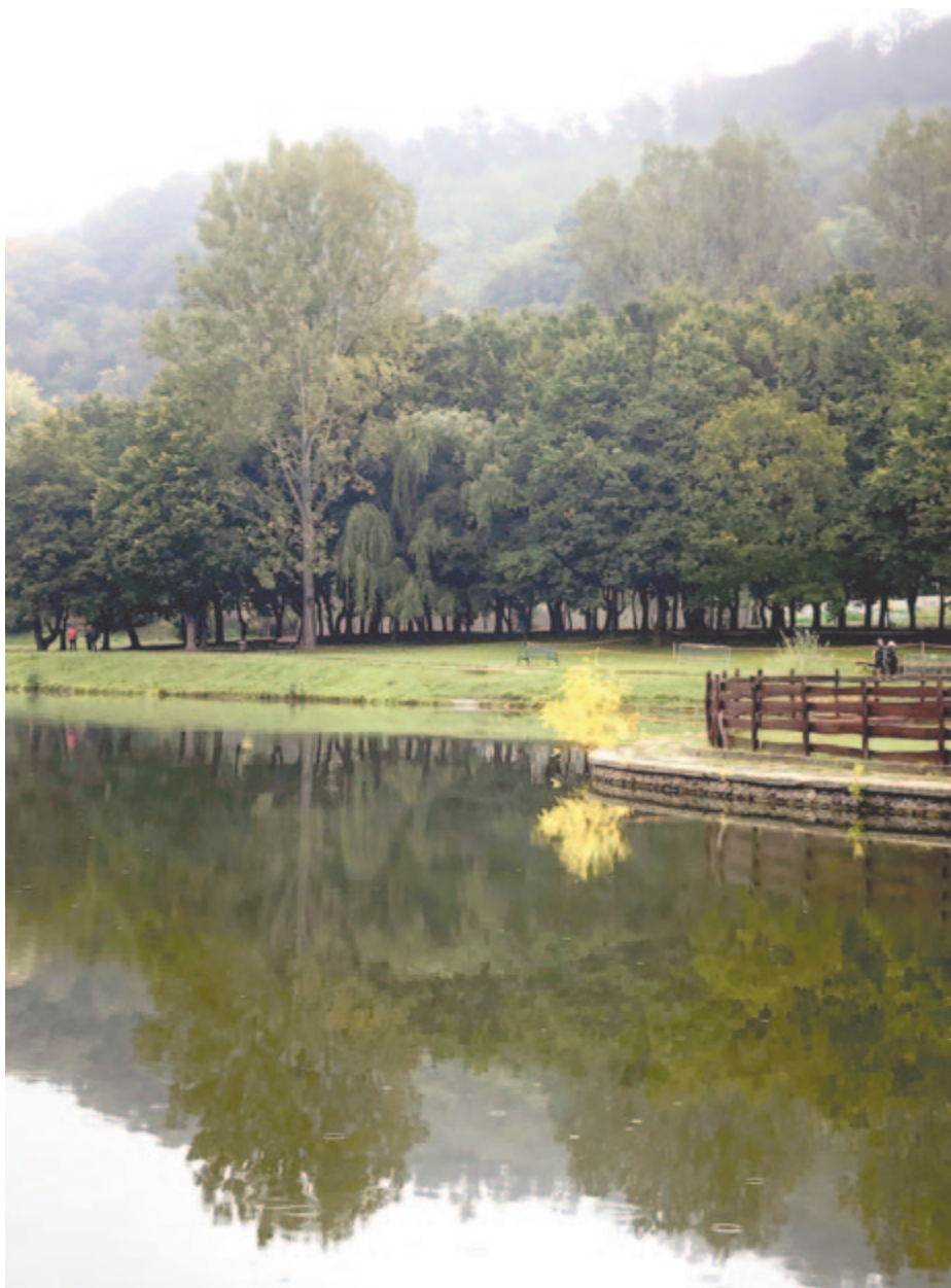
Mesélt a csönd és az árnyék vele