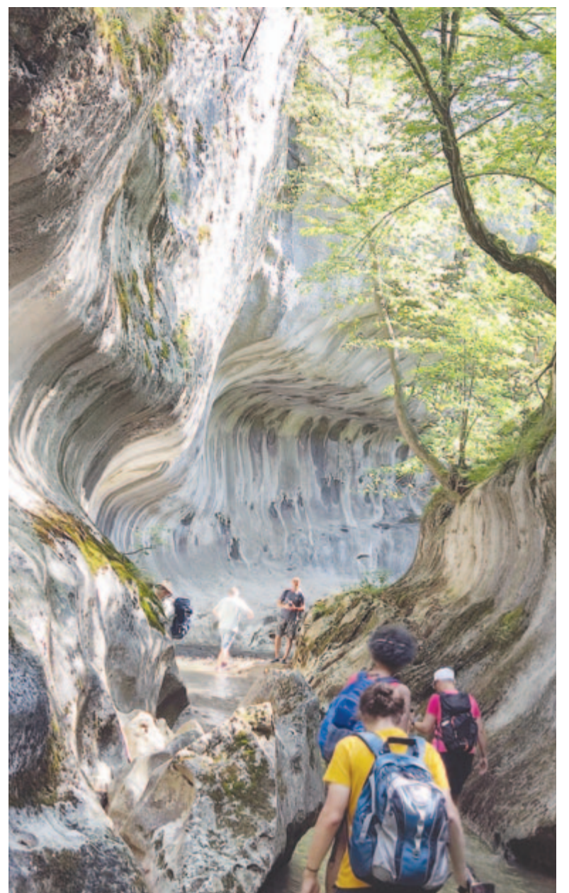
A Véka-szurdok →