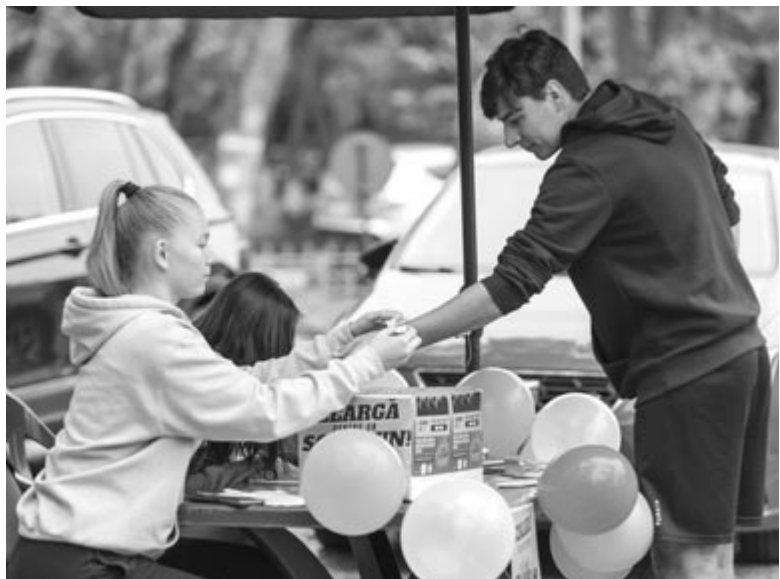
Az adományozók vasárnap karszalagot kaptak, amellyel bemehettek az állatkertbe is

hogy vannak, akik tényleg mindent megtesznek azért, hogy segítsenek, még akkor is, ha sokaknak egyre nehezebb a megélhetés. A nem tétlenkedők a reménységnek, akik a nehéz helyzetben levőknek segítenek bizakodni. A mostani adománygyűjtést is fiatalok végzik, akik szintén fiatalok akarnak segíteni. Ez pedig még szebbé, nemesebbé teszi az akciót! Így nemcsak a fiatalok, hanem mi is arra buzdítanánk mindenkit, hogy segítsen a rászorulóknak lábbelivel vagy anyagi támogatással!