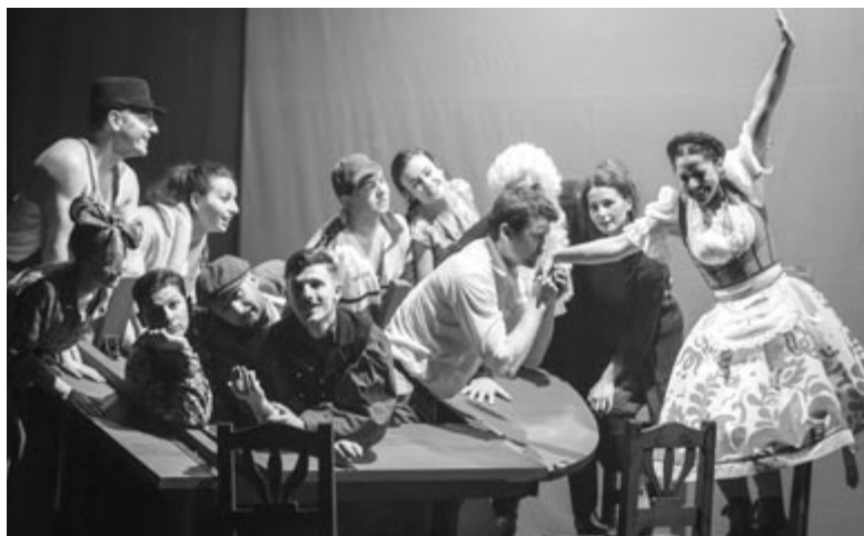
A helység kalapácsa

– Szeptember végén már megvolt az első fellépésünk, október 25-én 19 órától pedig a helység kalapácsát mutatjuk be a Stúdió közönségének.