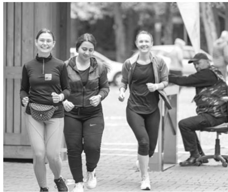
Valóban jó célért szaladtak!

A fiatalok már ezért is nagyon hálásak, és a közösségi médiában minden résztvevőnek és adakozónak megköszönték a segítségnyújtást. Az elért összeget egyáltalán nem érzik kudarnak, viszont arról is beszámolnak, hogy ebből nem telik 80 pár cipőre. Azonban nem adják fel! Bízunk az összefogás erejében, és arra kérnek mindenkit, akinek van (31-től 39-es méretig) elemi iskolásoknak való házipapíra vagy téli bakancsa, amit adományba adna, az segítse az akció-