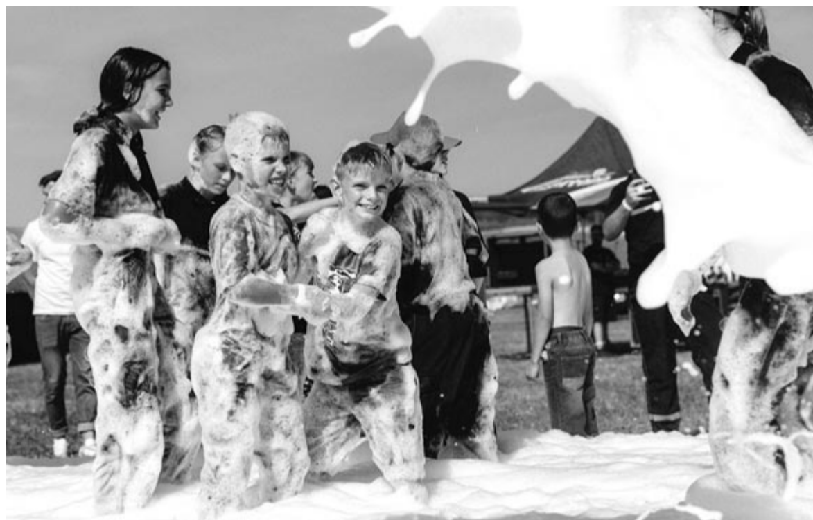
Meglepetés: a nyárádszeredai tűzoltók habpartit is rendeztek a gyerekeknek

válra is belépő ellenében engedtek be. Az új szervezési forma nem mindenkinek nyerte el a tetszését, volt, aki sokallta a 10 lejes parkolási illetéket és a 20 lejes belépőt, vagy éppen kevesellte az ezért nyújtott szolgáltatást. Ennek ellenére nagyon sokan megfordultak a hétvégi rendezvényen, amelyet a szervezők sikeresnek minősítettek.