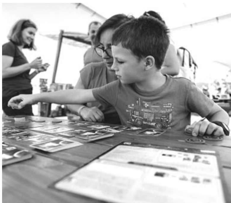
Számos szórakoztató, kézműves- és társasjáték, foglalkozás, koncert várta a kisgyerekeket