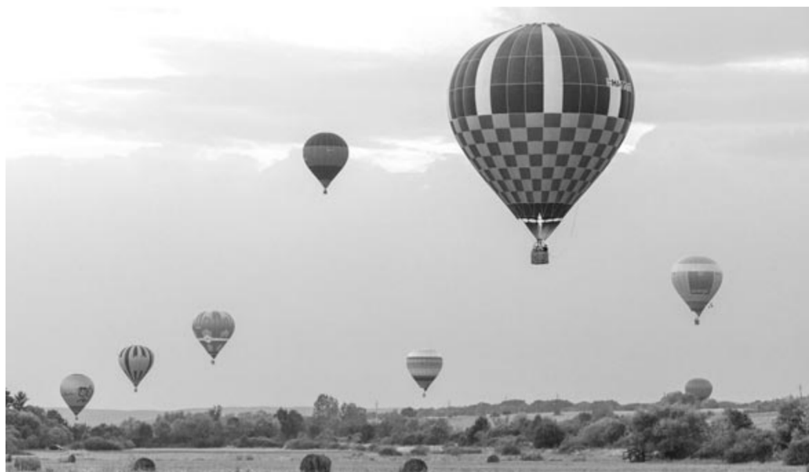
Mindig gyönyörű a léggömbök látványa, és a táj is a léggömbből

A szervezésben és megvalósításban komoly csapat vette ki a részét, önkéntesek, szervezők, és külön csapat dokumentálta az eseményeket, hogy azok is képet kaphassanak róla, akik nem tudtak részt venni. A mintegy 150 fős gárda mellett a léggömbös klubok is hozták a maguk stábját, ami további közel száz személyt jelent.