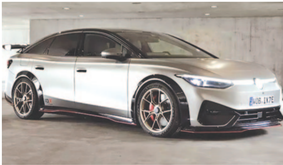
Volkswagen ID.X Performance, az 550 lóerős elektromos Passat-utód