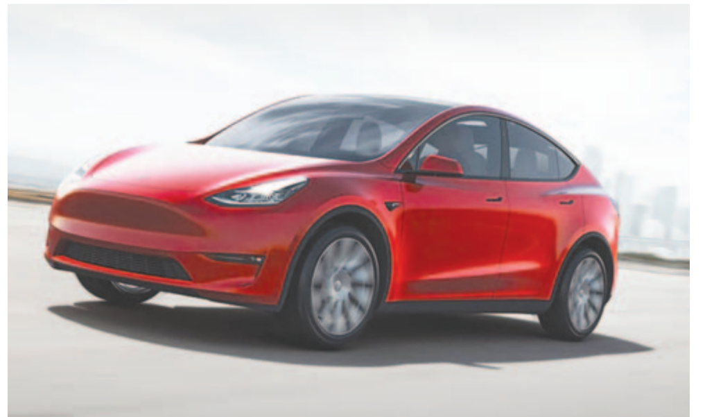
Tesla Model Y, a legnagyobb példányszámban eladott típus Európában az idei első fél évben

Ha alkategóriákra bontjuk az eladási ranglistát, akkor az figyelhető meg, hogy a legnagyobb példányszámban a kis SUV-k fogytak, ezekből 1,13 millió talált gazdára. Második helyen a kompakt SUV-k állnak, amelyekből 999 ezret értékesítettek a kontinensen. A harmadik kategória viszont nem a hobbiterepjáróké, hanem egy sokkal racionálisabb formavilág, a kisautóké, ezekből 913 ezret adtak el az első fél évben.