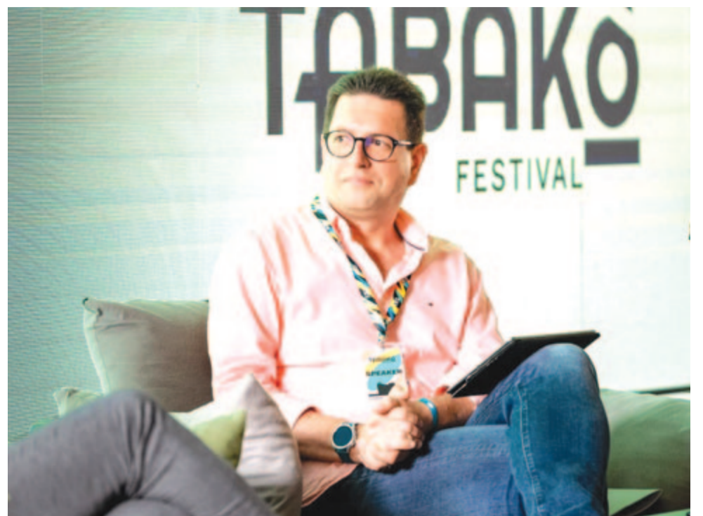
Vincze Loránt európai parlamenti képviselő