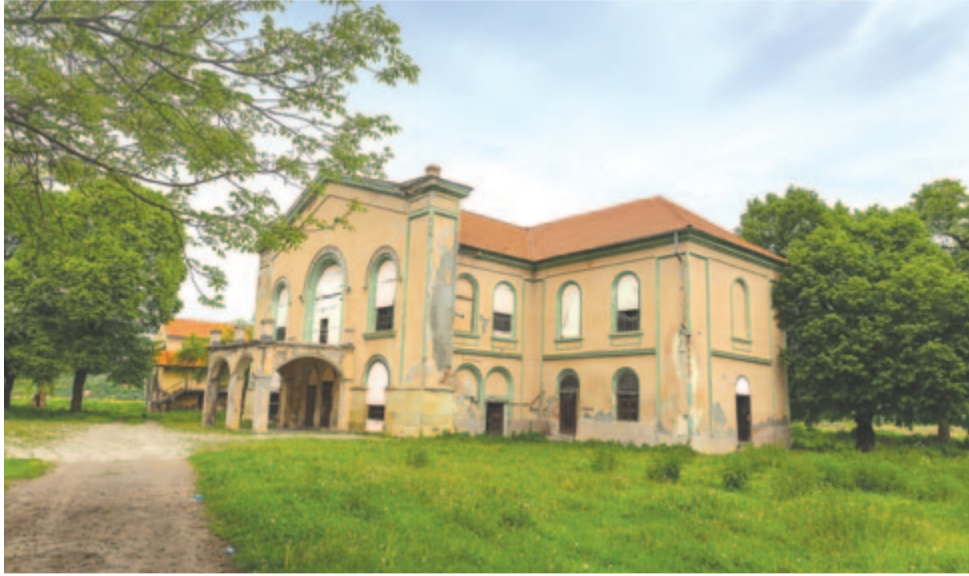
Bonyha, a Bethlen-kastély