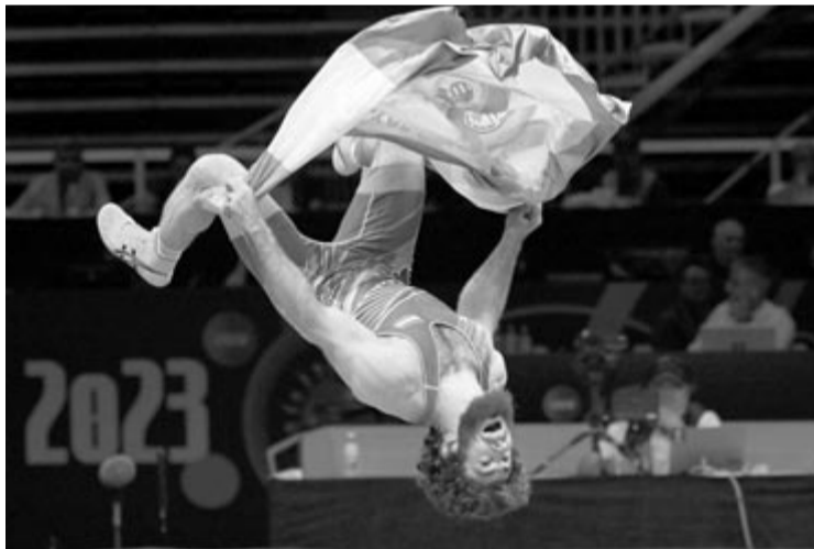
A magyar színekben versenyző, kabardföldi származású Muszukajev Ismail, miután győzött a Puerto Ricó-i Sebastian Rivera ellen a férfi szabadfogású birkózók 65 kilogrammos súlycsoportjának döntőjében a belgrádi olimpiai kvalifikációs világbajnokságon 2023. szeptember 19-én.

A 30 éves klasszis a magyar birkózósport 21. vb-győztese és a 31. vb-aranyat szerezte most meg, ami 44 év után a szabadfogású szakág második vb-diadala. Az elsőt Kovács István nyerte 1979-ben.