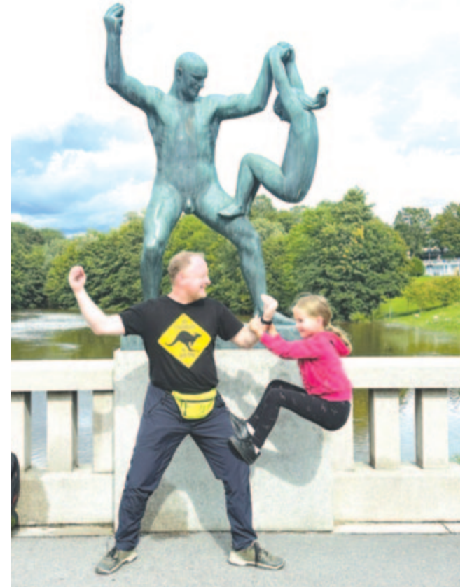
Gustav Vigeland egyik szobra a Frogner parkban

Am Oslo nem csupán a fentebb említett, illetve a Thor Heyerdahl típusú megszállott és vakmerő világjárókról ismert. Megtekintjük a Nobel-békedíj átadásának helyet adó városházát, a tengerparton magasodó Akershus erődöt, majd a főváros művészeti csodakertjében gyönyörködünk, a Frogner parkban. Itt szó szerint tobzódunk a kiállított szobrok között, és azon gondolkodunk, hogy miként alkothat egyetlen művész ennyi csodát. Mert Gustav Vigeland munkássága maga a kézzelfogható, tapintható varázslat, és nem csupán azért, mert a 20. század elejének formavilágába kalauzol, hanem mert az életünkről szól, arról az ajándékról, amelyet Istentől kapunk, de csak kölcsön. A legismertebb norvég szobrász munkásságát az élet és a halál, a férfi és a nő közötti kapcsolat, a gyermekekhez fűződő viszonyunk hatják át. A közel 200 szobor és dombormű között ügyelegetve ráismerünk önmagunkra, felfedezve az élet apró örömeit, nehézségeit. Felismerjük, hogy nem csupán a saját életünket kapjuk ajándékba, hanem a szüleinkét, szerelmünkét, gyermekeinkét, unokáinkét is, ugyanakkor tudatosul bennünk az is, hogy az életben, párkapcsolatainkban buktatók, kemény csaták is vannak, amelyeket ki-ki meg kell harcoljon. Mire végigrohanunk az emberi lét fontos stációin, a születéstől a gyermek- és ifjúkoron át az érett felnőtt-, majd időskorig, már csak a rothadó porhüvely jelzi, hogy mennyire mulandók vagyunk.