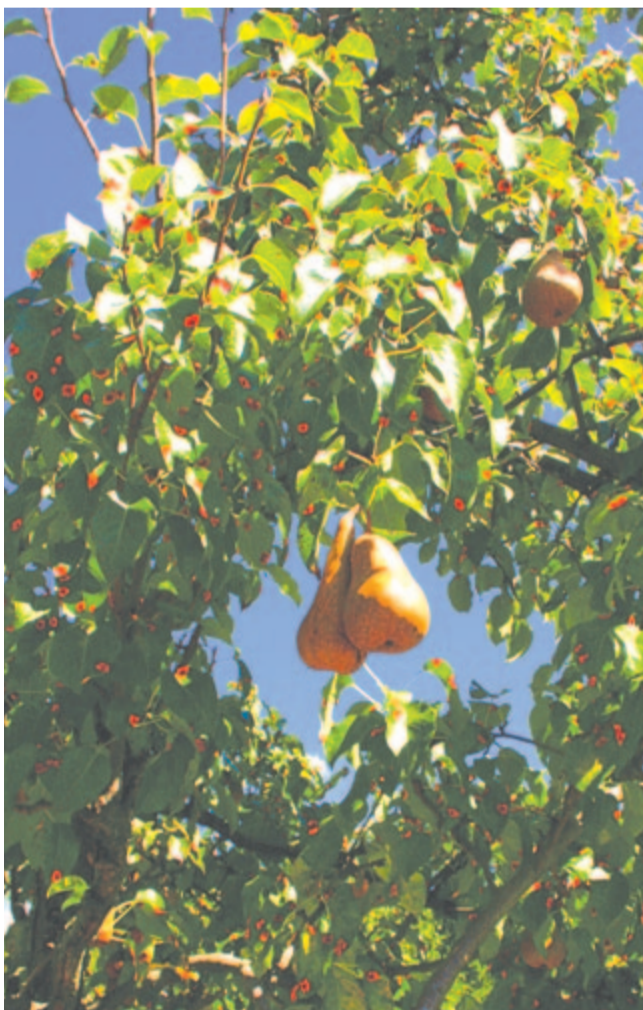
Még zöld mezőben játszik a két érő körte is

Vagy talán úgy, ahogy Faludy Georg Trakl Gyönyörű őszi ígértét tolmácsolja: