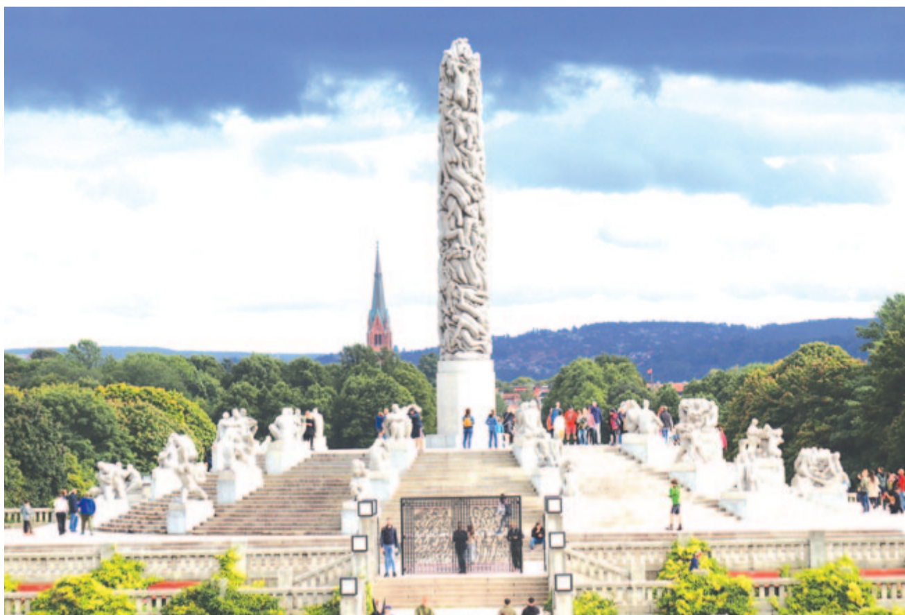
A Frogner park Oslóban

Felfrissülve vágunk neki, hogy megtegyük a hátralevő néhány száz kilométert. Ezernyi tó, alagút, mintagazdaság, kifogástalan külsejű ház, zöldellő táj, egyre magasabb hegyek, mignem megérkezünk utazásunk fő célpontjához, a Lysefjord bejáratához. A partok között komppal kelünk át, a húszperces út felér egy önálló, látványos hajókirándulással. Arcomban érzem a szabadság fuvallatát. A festői Jørpelandot választjuk főhadiszállásunknak, s miközben a vendégfogadónk teraszáról legeltetjük szemünket a jachtkikötő árbcain, némán borít be öblöt, várost az északi éjszaka csendje.