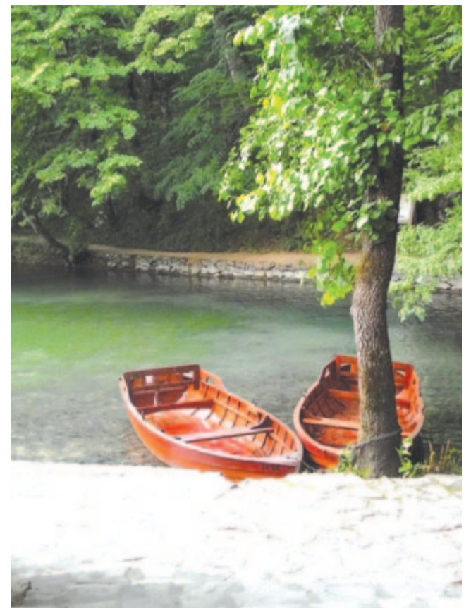
Két csónak megtér a csendhez

Szeptember 24. a fehér kendő napja . Az ősi Grúziában a férfiak befejezték a háborúskodást, ha a nők közéjük dobták fehér kendőjüket. 1993 szeptemberében Sziko Dolidze grúz filmrendező felhívással fordult az asszonyokhoz: a nők a maguk eszközeivel vegyék fel a küzdelmet a háború ellen. A felhívásra több ezer nő vonult ki fehér kendőben, így lett e nap a fehér kendő, a megbékélés napja. Ábránd csupán, de jó lenne, ha Ukrajnában is, Örményországban is hatásos lenne az idén a nemzetközi fehér kendő napja.