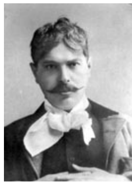
Bródy Sándor portréja (1915)

(Sorozatunkat szeptember közepétől folytatjuk.)