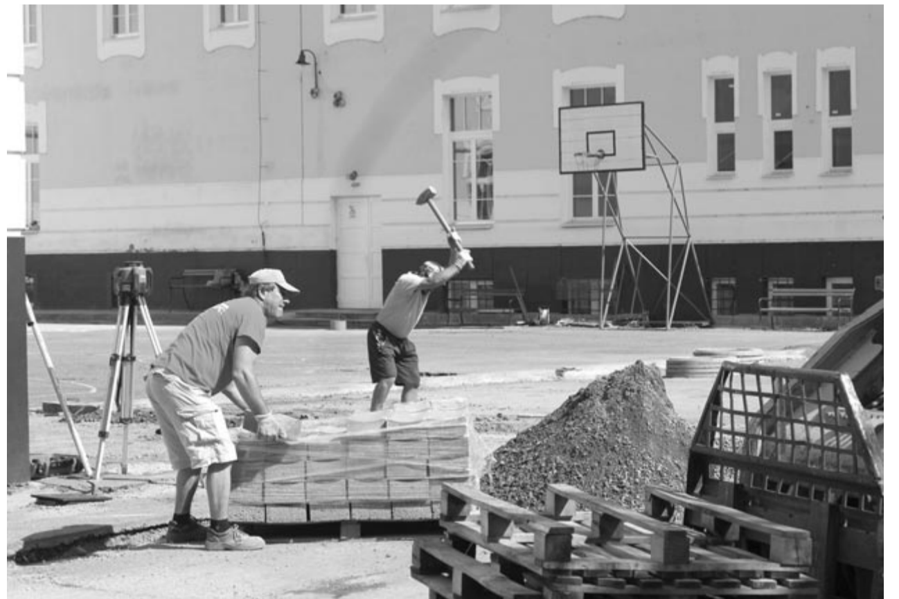
Munkálatok a Bernády György Általános Iskola sportpályáján

Nem a tanintézmények felújításához tartozik, de az oktatási hálózat bővítéséhez igen, hogy a Belvedere negyedben új bölcsőde és óvoda épül, ennek alapozása most kezdődik. Az építkezést uniós alapokból finanszírozták.