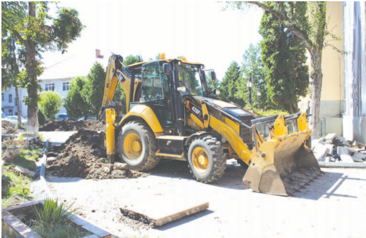
Járdafelújítás a Constantin Brâncuș Szakközépiskolában