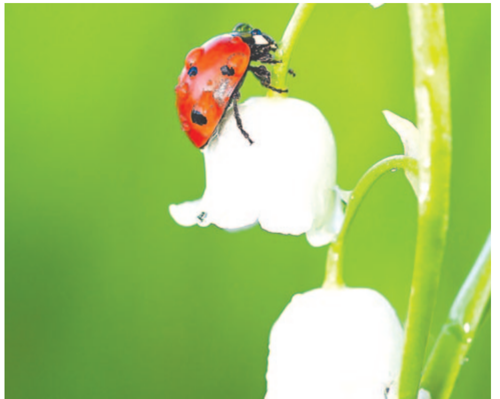
Harmatcseppek a katicabogár pöttyös kabátján

Augusztus 9. – a második atombombatámadás. Az amerikaiak a Fat Man nevű bombát elsődlegesen Kokura városra dobták volna; az ottani kedvezőtlen időjárás, a vastag felhőréteg miatt választották a másodlagos