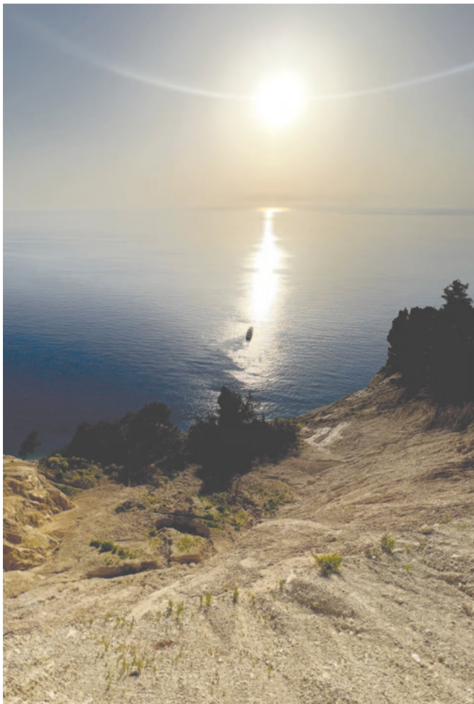
... beletűnt a szikrázó kékségbe