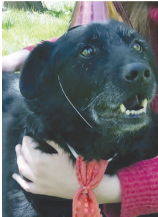
A 16 éves Pici a születésnapján hústortájával

A mindennapi életben figyelni kell az idős háziállatok jeleire, kommunikációjára, a testtartásra, a hangokra és a viselkedésre. Az állat egyedi jelzéseit és reakcióit könnyebb megérteni, azt, hogy mire van szüksége, de azt is, hogy mikor érzi magát kényelmetlenül. Az idős állatok igénylik a csendes és nyugodt pihenőhelyet, ahová elvonulhatnak. Nem elhanyagolható az sem, hogy megfelelő hőmérsékletű helyiségben tartózkodjanak. Az idős háziállatok érzékenyebbek lehetnek a hidegre vagy a melegre, ezért, ha szükséges, nyári hőségben ajánlatos kiegészítő hűtést, télen pedig melegítést biztosítani. Előrehaladott korban a háziállatoknak időre van szükségük, hogy alkalmazkodjanak egy új környezethez, és a változások stresszt okozhatnak számukra. Nem árt elkerülni a környezeti változásokat, a költözéseket. Ha azonban elkerülhetetlen a költözés, gondoskodni kell arról, hogy az állat számára nyugodt és ismerős környezetet teremtsen a gazda, ami segíthet a stressz csökkentésében. Minél több kellemes élményt kell szerezni, hogy kedvencünk utolsó éveit boldogságban teljenek, és a gazdi az együtt töltött évek szép emlékeit őrizhesse meg.