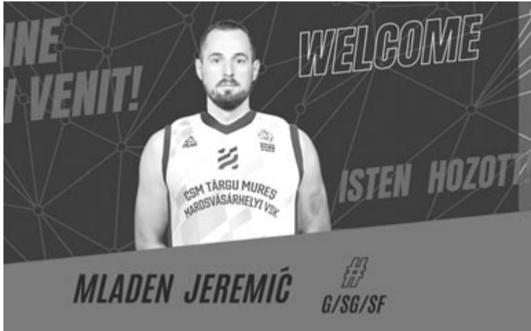
A román bajnokság egyik legtapasztaltabb játékosa Marosvásárhelyen folytatja