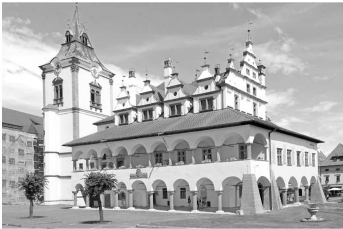
A lőcsei városháza

„Az igazságra törekedett kétségkívül, ennél fogva nem volt rossz ember. Nem, nem, Görgey pusztán megsavanyodott kedély volt, kit a csapások idegessé tettek. Hiába volt a vármegye esze, ha három dolgot