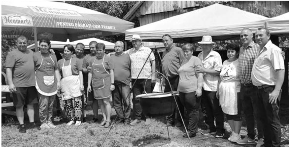
A nyárádmagyarósi önkormányzat főzte a legfinomabb falatokat