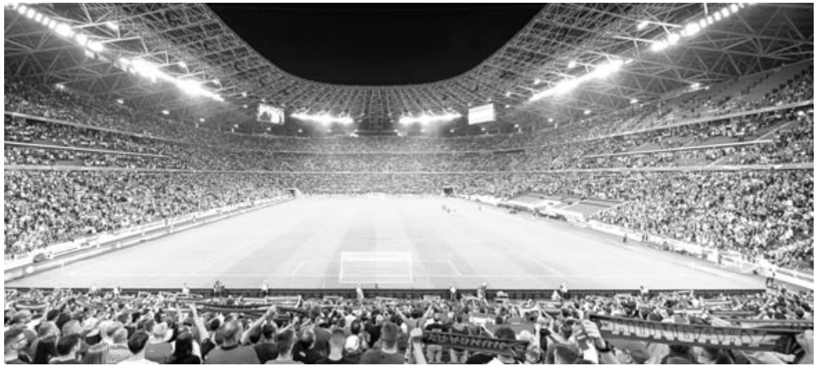
A Puskás Arénában rendeznék Bajnokok Ligája-finálét