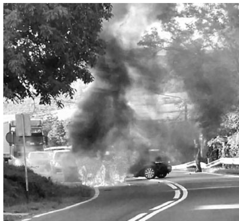
Tűzoltás Botorka főútján