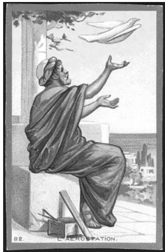
Arkhüasz ábrázolása a fagalambbal

https://www.ancient-origins.net/history-famous-people/steam-powered-pigeon-002179