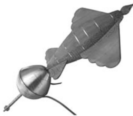
A fagalamb működési elve

Arkhüasz a püthagoreus hangskálát másképp osztotta fel. Püthagorasz még két egymás mellé helyezett kvárt hangközből (két tetra-chordból, vagyis dó-ré-mi-fá és szol-lá-szi-dó) hangközre osztotta az oktávot. Arkhüasz azonban szerencsésebbnek találta egy kvintre és