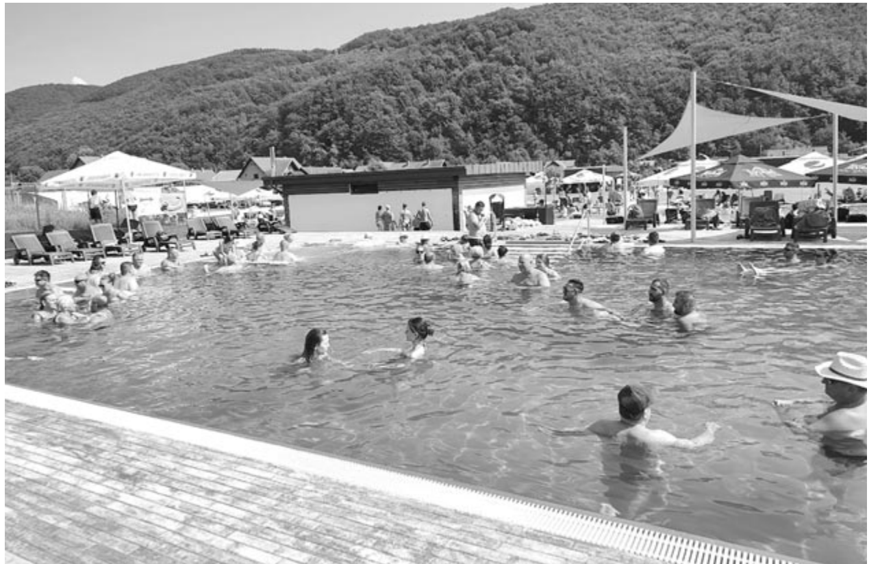
Parajdon igényes kivitelezésű, tavaly nyitott strand is várja a vendégeket

A szabadtéri létesítmény igényes kivitelezésével, gondozott zöldövezetével, teraszával, ahol enni-inni lehet és a medencék szomszédságában kialakított minigolfpályájával jó lehetőség a felüdülésre. A belépővel egész napos bent-tartózkodásra van lehetőség, de délután rövidebb időre olcsóbban is lehet jegyet váltani.