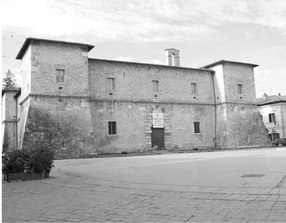
A radnóti kastély olasz előképe. Giacomo Barozzi da Vignola: La Castellina. Norcia/Umbria. 1554–1562

Ezt a kastélyt igényelte vissza a Gyulafe-