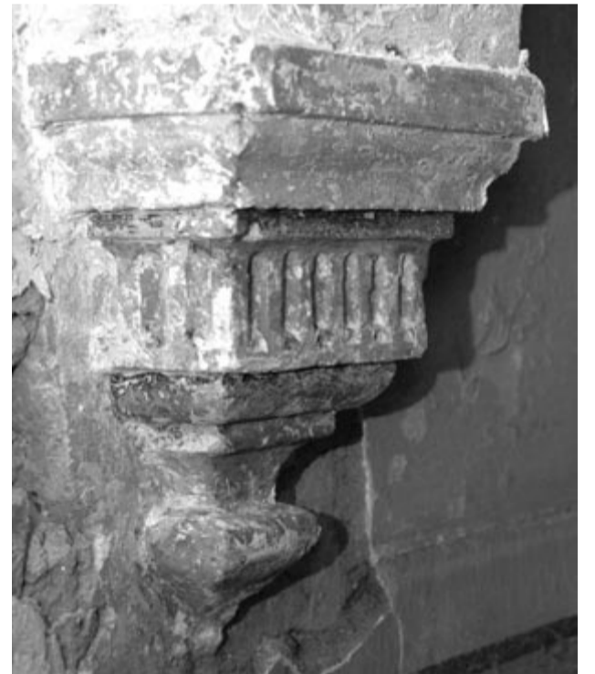
Festett díszítésű reneszánsz gyámkő, 16. század vége