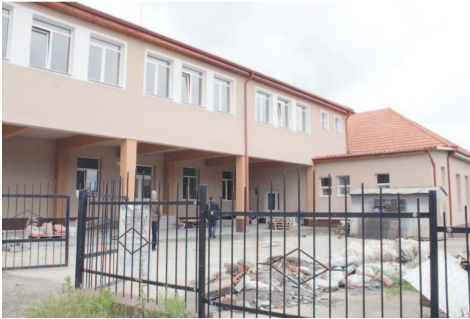
Désfalván új iskolában kezdik a tanévet