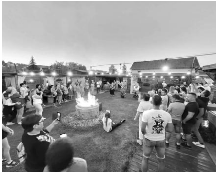
Gazdag programban és megható pillanatokban volt részük a vendégeknek

A közös programot követően Kamond polgármestere