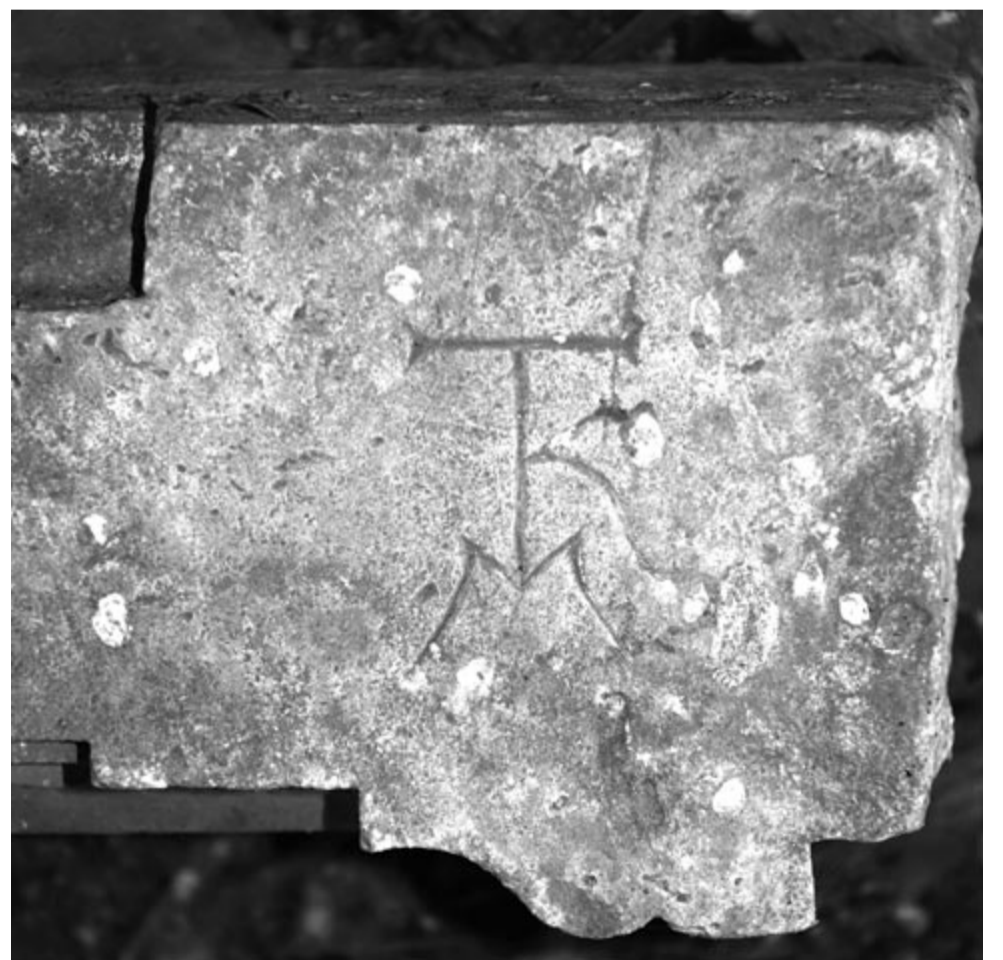
Takács Kőműves Márton kolozsvári kőfaragó mesterjegye egy reneszánsz ablakkeret töredéken, 1650 körül