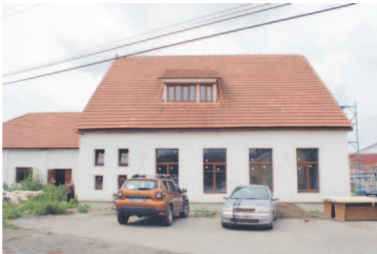
A mikefalvi kultúrotthon külső része elkészült