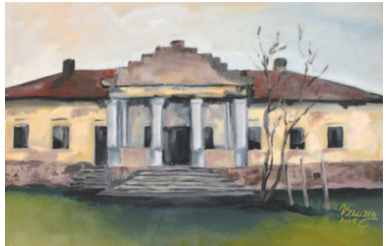
Az abosfalvi kastély egykor