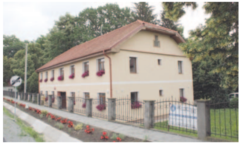
Hamarosan fogadják a betegeket az új orvosi rendelőben