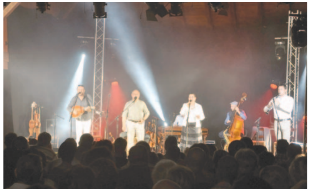
A Csik zenekar