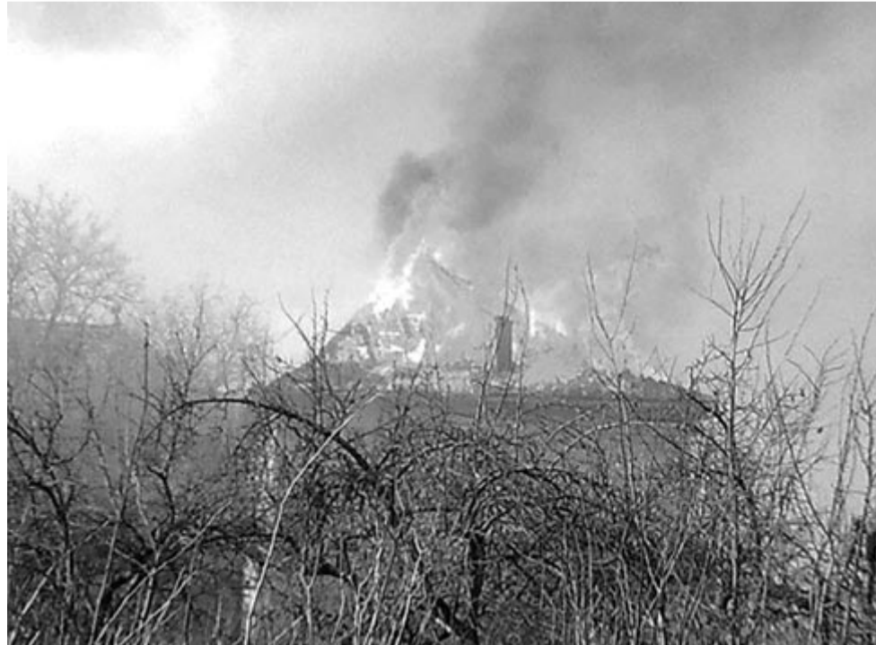
2012. március 18. A lángokban álló nyugati bástya

A két bástya teljesen leégett fedélszerkezete bizonyítja, hogy mekkora károkat okoztak nálunk a visszaszolgáltatásokkal kapcsolatos rendelkezések bürokratikus elmentmondásai. Ez az épület lakható volt a visszaszolgáltatási eljárás megindulásáig, iskola és bentlakás működött benne. A kiüri-