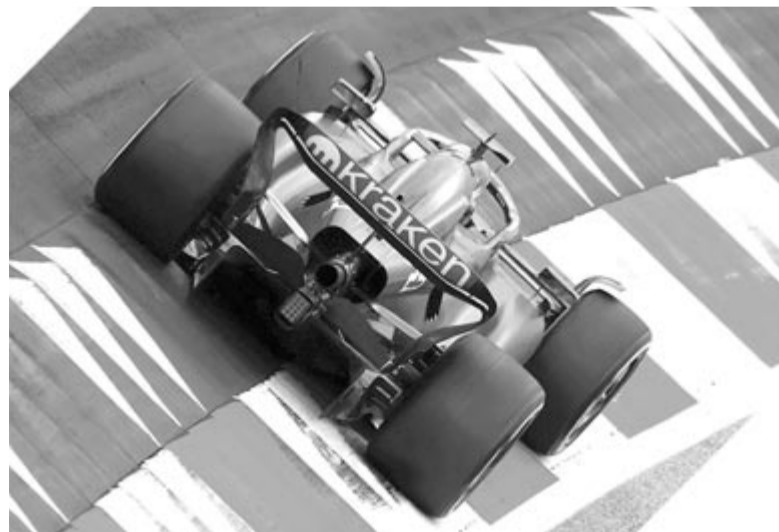
A Forma-1-es Osztrák Nagydíjon nyolc pilótát büntettek, amiért elhagyták a pályát és tiltott részen folytatták a versenyt

ces előnnyel vezetett márkatársa, a 15. helyről rajtoló Pérez előtt, ennek köszönhetően kényelmes módon belefért neki egy újabb kerécsere, amely után visszaállt az élre. Nem sokkal később Pérez is a