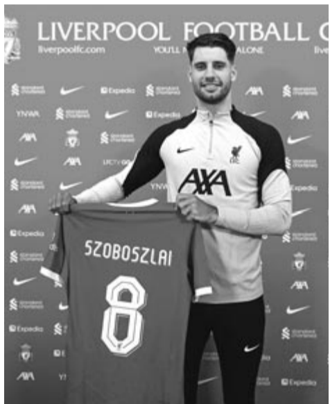
A magyar futballista új klubja mezével