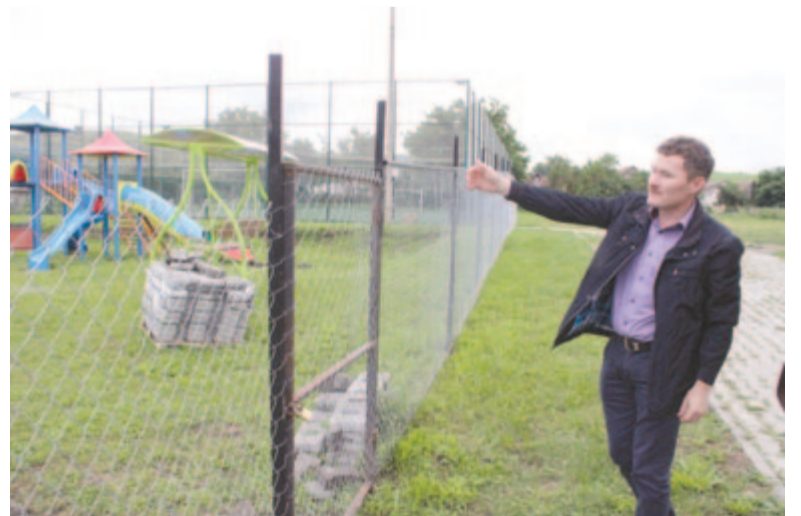
Elkészült a játszótér és a műfüves pálya