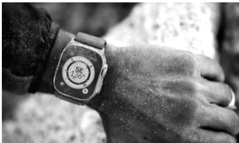
Az Apple Watchok „királya”, az Ultra

A nagy kérdés az, hogy megéri-e megvenni, megéri-e váltani vagy várni a megjelenésére? A rövid válasz az, hogy nem! Egyrészt, ha valaki most gondolkodik Apple Watch vásárlásán, akkor érdemes megvennie, és ne várjon több hónapot, hiszen nagy újdonságra nem kell számítani. Ami pedig az SE és az Ultra kivitelre, azok nem fognak az idén utódot kapni, így semmi értelme nincs rájuk várni.