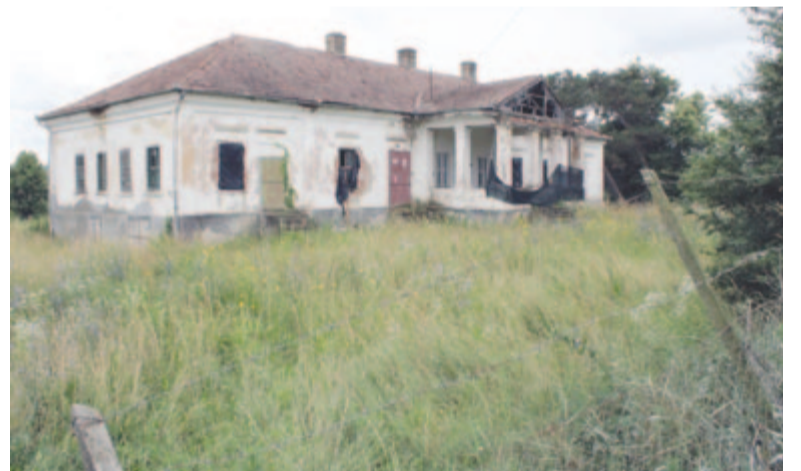
Az abosfalvi kastély most