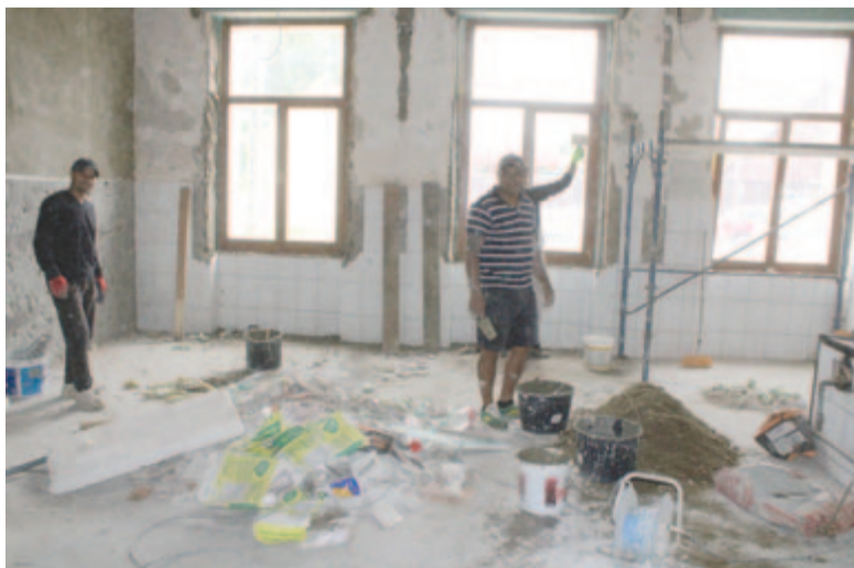
Odabent még dolgoznak a mikefalvi kultúrotthonon