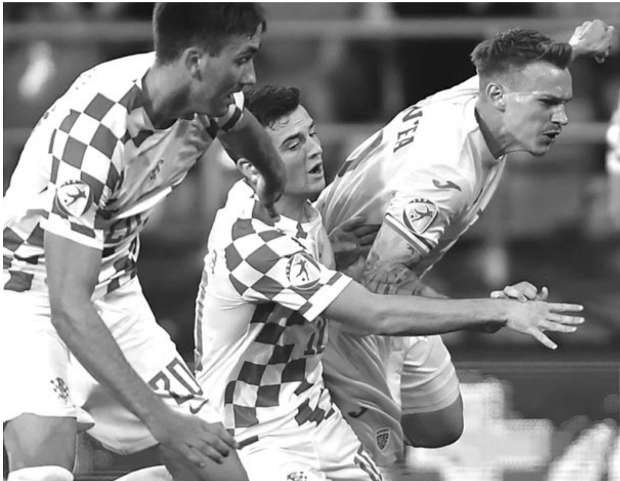
A tárházigazda együttes a horvátok elleni mérkőzésen próbálta kiköszörülni a csorbát – nem sikerült.

Az esti meccseken a D csoportban eddig 100%-os Franciaország Svájjal csapott össze. A gallok folytatták győzelmi sorozatukat, 4-1-re nyertek az utolsó csoportmeccsen, a másik találkozón pedig Norvégia 1-0-ra legyőzte Olaszországot, így Svájc lépett tovább a legjobb nyolc közé, jobb gólkülönbségének köszönhetően. A negyeddöntőket szombaton és vasárnap rendezik, a Román Televízió és az M4 Sport is élőben közvetíti.