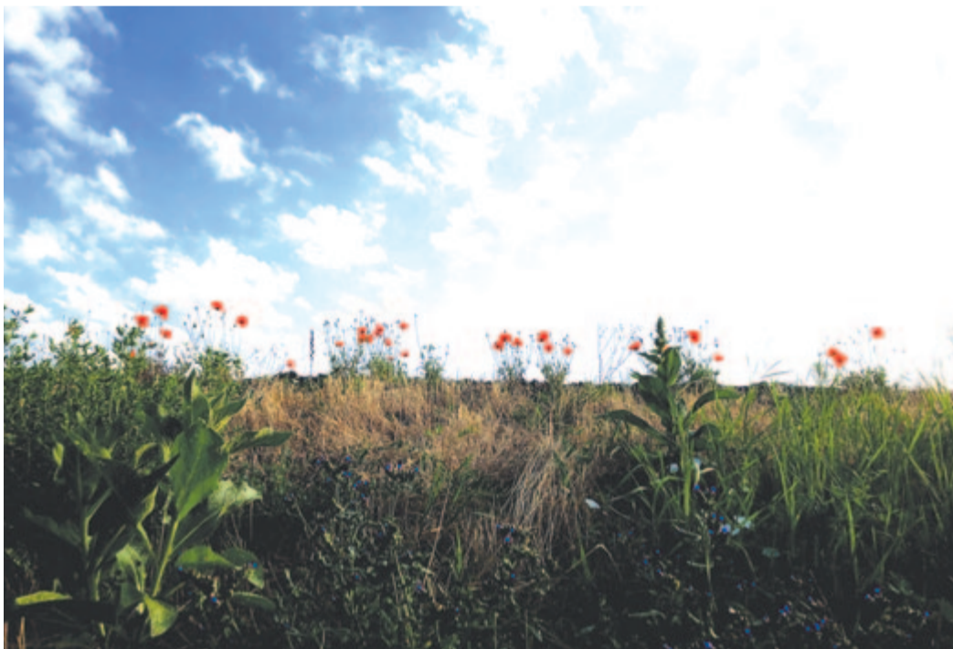
Áldás havának küszöbén álomittasan felkél a nap

Parányi pont a szilvakéken tündöklő nyárreggeli égen, de a mezői betöltve zeng föl angyal-trillája odafentről: