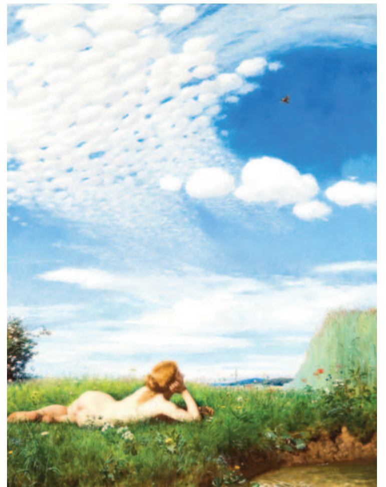
Szinyei Merse Pál: A pacsirta

Július 2. Sarlós Boldogasszony napja. A kereszténység a XIII. századtól e napon a „nehézkés” Máriának, a Jézussal terhes Szűznek Erzsébetnél, Keresztelő Szent János jövődó anyjánál tett látogatását (latinul Visitatio ) ünnepelte. Az ünnepnap megválasztásába egy kis hiba csúszott. A szóban forgó esemény idején az evangélium szerint Erzsébet a szülés előtt állt, fia születését azonban már az ősegyház 8 nappal korábban, június 24-én megünneplelte. Ez lehet az oka, hogy