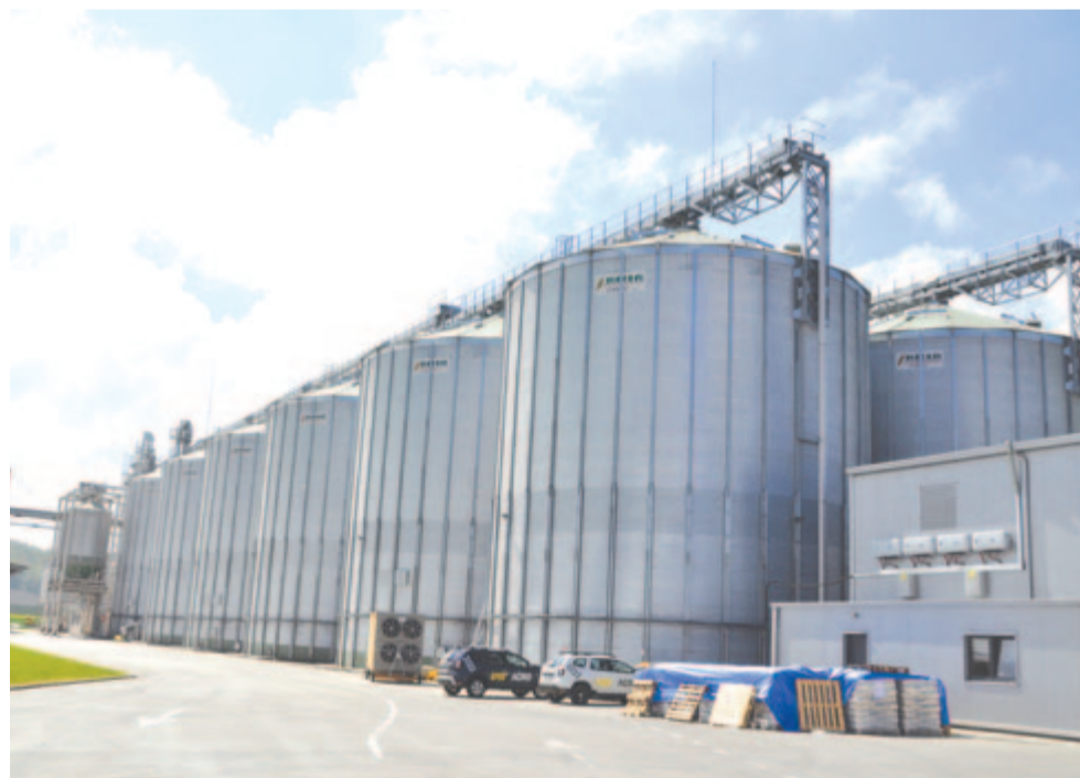
Ha az időjárás megengedi, az idén is megtelnek a gabonataralók