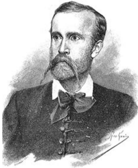
Madách Imre – Morelli Gusztáv fametszete, 1890 körül

„Madách egész élete reménytelen harc magányba húzó természete és világba űző nagy ambíciói között. Az ember egyéniség és egyben társas volta őt is felőrölte, mint hőst, Adámot” (Szerb Antal). Egyén és közösség, idealizmus (Adám) és realizmus (Lucifer) feloldhatatlan dilemmáját éppen az életosz-