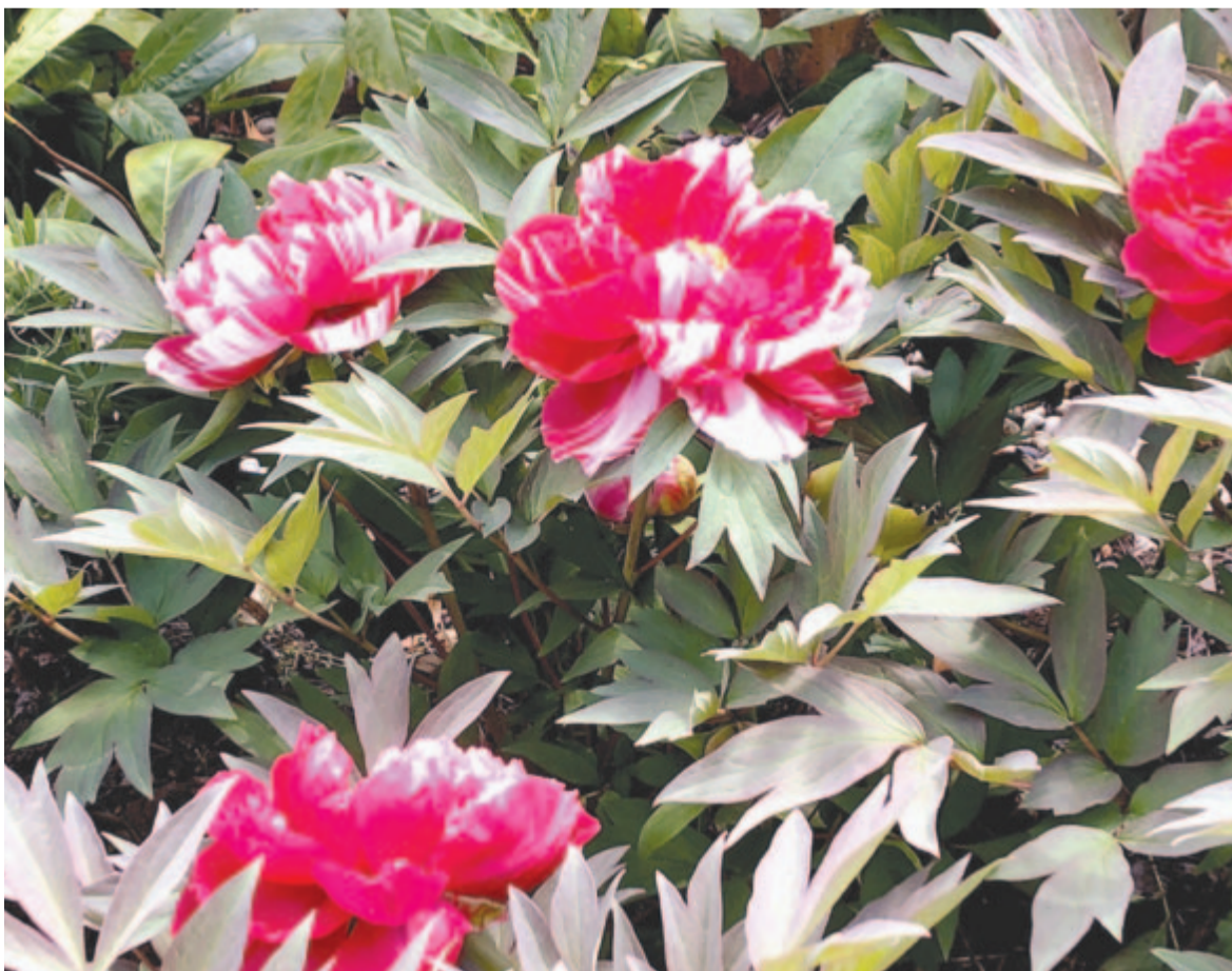
Piros pünkösdi napján hajnalban születtem

Kelt 2023-ban, 57 évvel Tamási Áron halála után