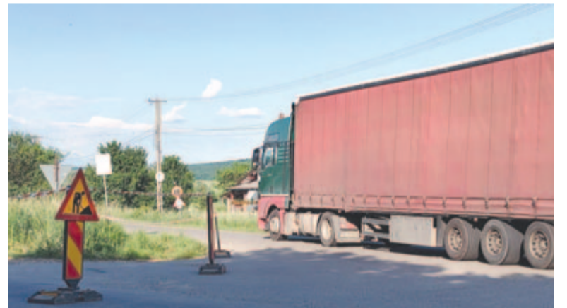
Hiába a súlykorlátozás, számos kamion ráhajt a terelőútra

A megkérdezett járművezetők sem örülnek a kitérőnek. Egyesek azt róják fel, hogy a kövezett út keskeny, két, ellentétes irányból közlekedő jármű nehezen fér el egymás mellett, mások azt nehézményezik, hogy a zúzott kőréteg nincs megfelelően lezárva a rászórt homokos apró törmelékkel, emiatt balesetveszélyes, mert kisodródhatnak az autók, másfelől pedig hamar meg bomlik az útfelület, s az első esőzés