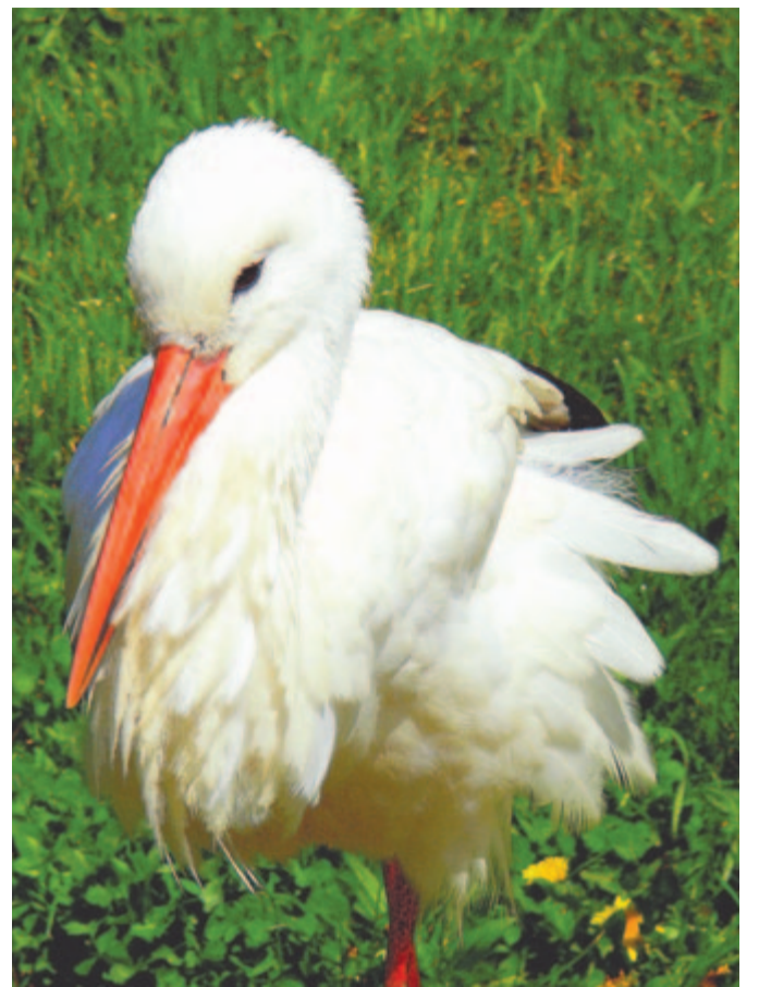
Átálmodott, szebb korból fönmaradt

Komoly fiú valék. Míg társim a hazatérő tehéncsordát Estenként kergeték: En udvarunkon a nádkúp oldalánál Húztam meg magamat, S némán szemlélttem a szárnyokat-próbáló Kis gólyafiakat.