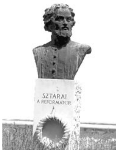
Sztárai Mihály szobra Nagyváradon