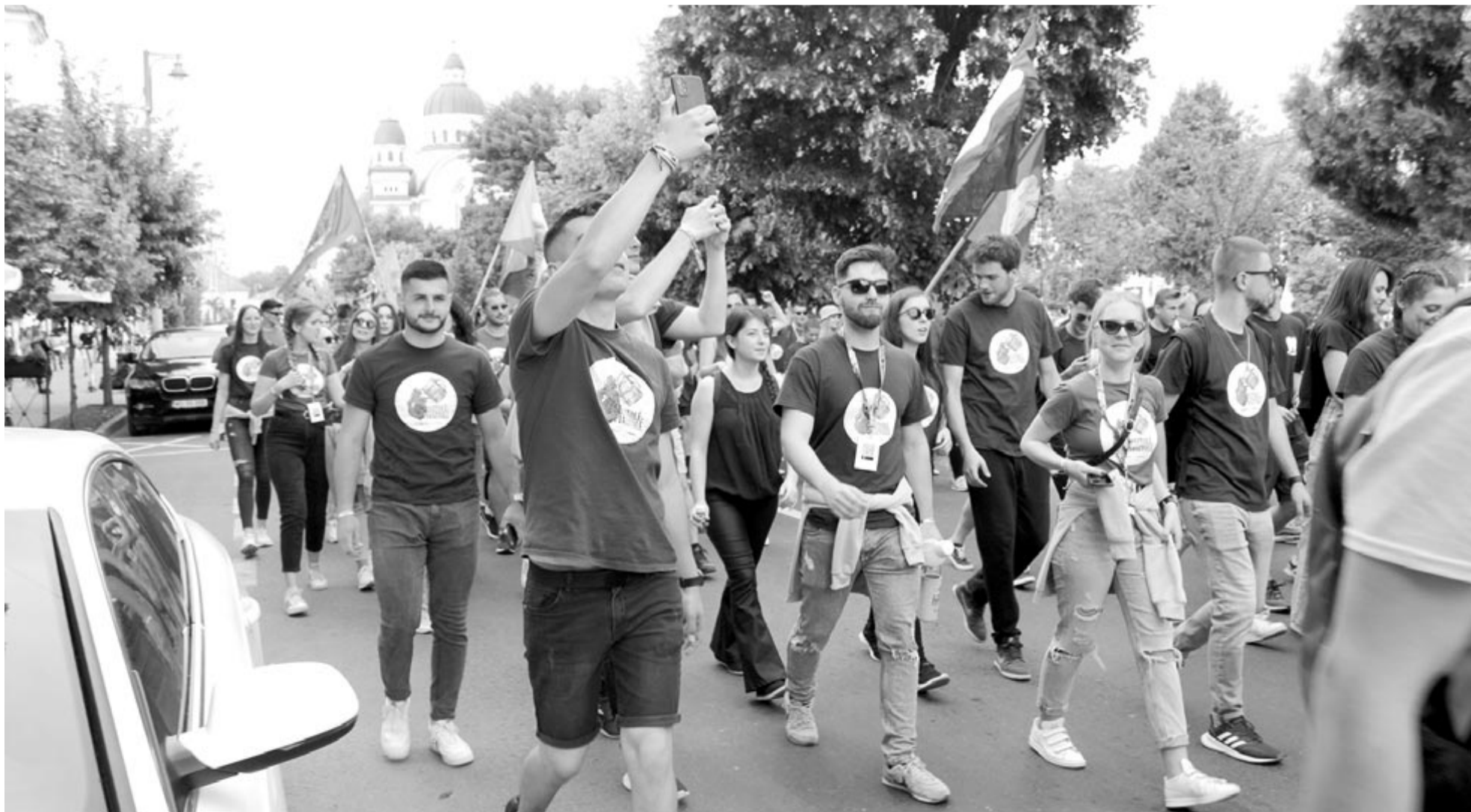
Tegnap délután több száz egyetemista vonult fel Marosvásárhely főterén, amivel kezdetét vette a 24. Marosvásárhelyi Diáknapiak és Diákfesztivál. A Marosvásárhelyi Magyar Diákszövetség (MMDSZ) által szervezett rendezvényesorozat május 24–27. között zajlik több ezer egyetemi hallgató részvételével. A szerdai felvonulást követő programokra a víkendtelepi sportbázison, a Maros-parton, a GoKartnál kerül sor