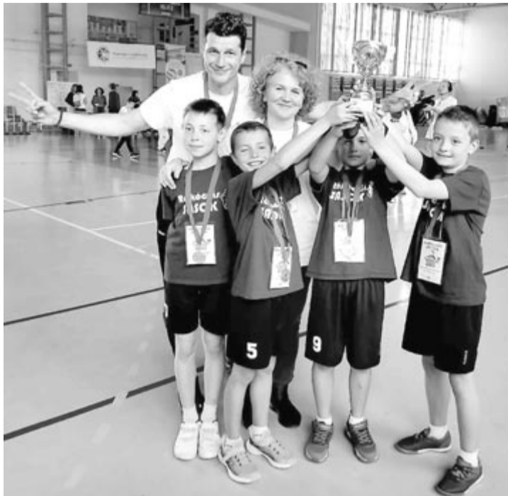
A győztes marosvásárhelyi csapat