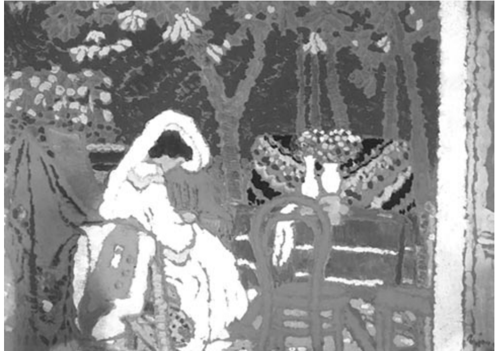
Rippl-Rónai József: Kertben, 1909

A levelet még aznap postára tette Kocsis Pistával, piacoló (és piatoló – tehát bornemissza) szomszédjával, és várta a választ. Nem táplált hiú reményeket, tisztában volt vele, hogy a hivatal lassan emészti meg az ő kérését. Nem félt attól, ami reá várt, hiszen ismerte a földmunka minden csinját-bínját, tudott írni és olvasni, még a dédapjától örökölt vastag imakönyvet is el tudta olvasni, ámbátor nem mindig értette, mit is írtak ottan az ősei, akik valószínűleg nem gondoltak Uhrmacher Ábrahámról, de az egész emberi-