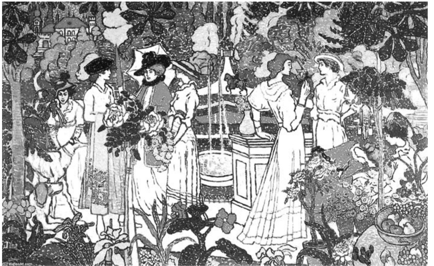
Rippl-Rónai József: Asszonyok a parkban, 1908. 162 éve, 1861. május 23-án született Kaposváron a világhírű magyar festő- és grafikusművész (elhunyt ugyanott, 1927. november 25-én)

1981. május 27-én, 42 éve hunyt el a Baumgarten-, József Attila- és Kossuth-díjas szerző, a huszadik század egyik legjelentősebb magyar költője.