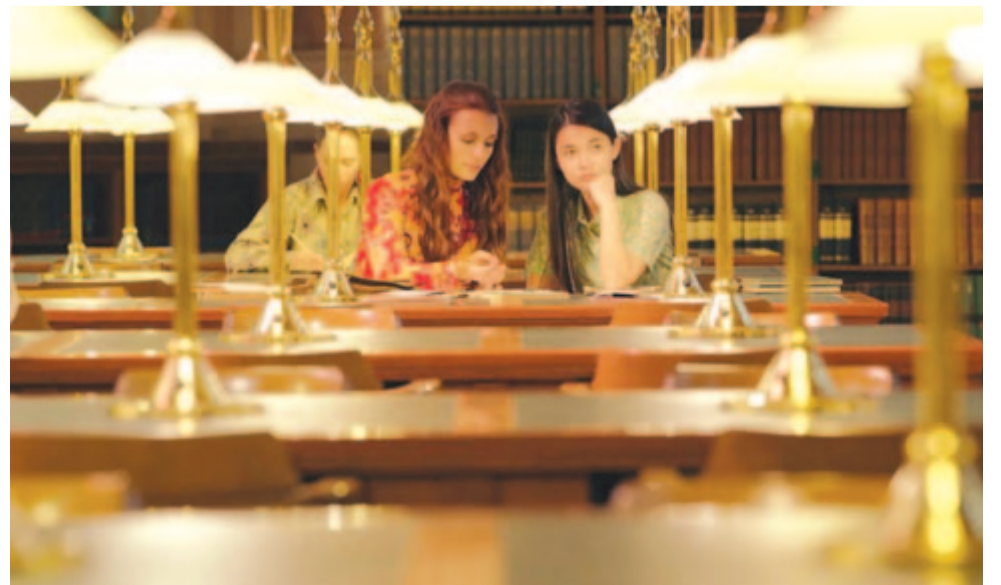
Az almafa virága

A Magyar Mozgóképek Díj (2014-2020 között Magyar Filmdíj) Magyarország 2014-ben alapított legrangosabb, évente odaítélt filmművészeti díja, amelyet műfaji és alkotói kategóriákban a megelőző év legjobbnak tartott filmjeinek és készítőinek ítélnek oda.