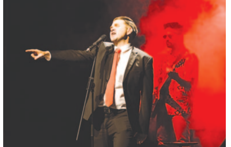
Lázadni veletek akartam

a Marosvásárhelyi Nemzeti Színház nagytermi jegypénztáránál válthatók (nyitvatartás: hétfőtől péntekig 9 és 19 óra között, tel. 0365-806.865), a helyszínen előadás előtt egy órával, valamint online a honlapon. (Knb.)