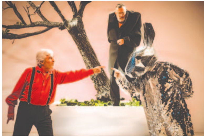
A tavasz ébredése