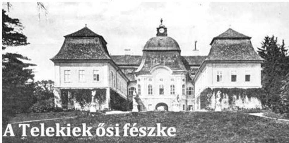
A Telekiek ősi fészke