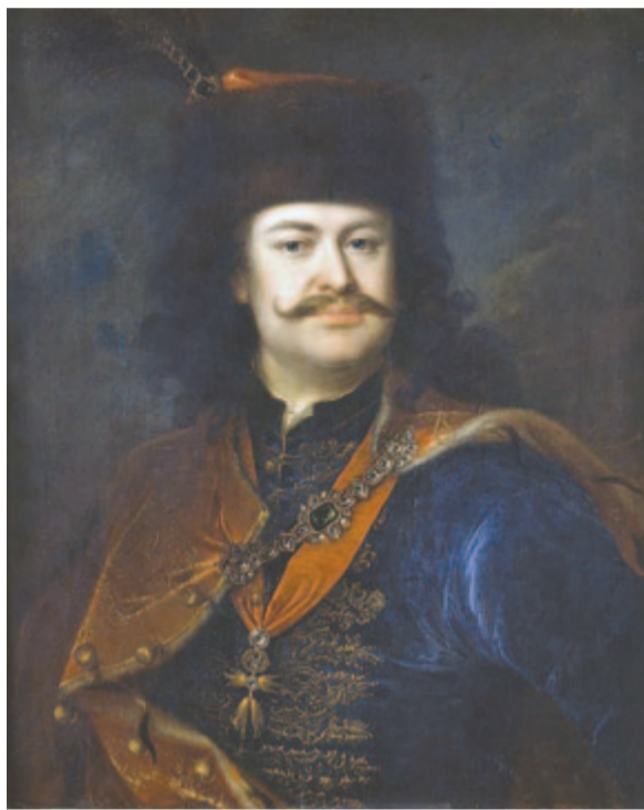
II. Rákóczi Ferenc

Rákóczi munkácsi birtokain 1703 elején felkelés tört ki, amelynek résztvevői Esze Tamás vezeté-