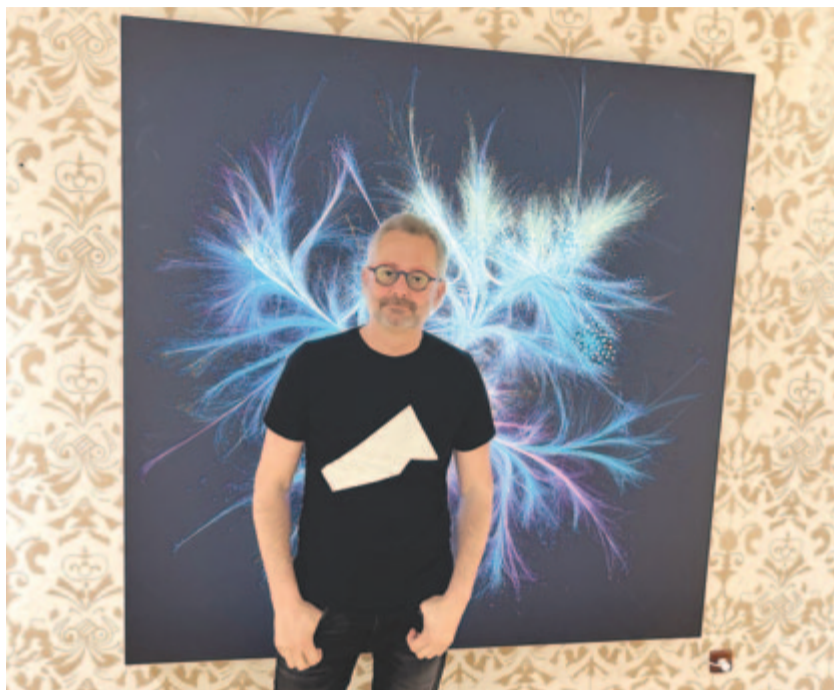
A Nature 150. születésnapjára készült címlap felnagyított, kiállításra készült változata előtt

A BarabásiLAB által készített munkák nagy része nem azzal a céllal jött létre, hogy múzeumban állítsák ki őket, hanem azért, hogy rajtuk keresztül a kutatók megértsék azokat a rendszereket, amelyeket tanulmányoznak. Az már csak a hab a tortán, hogy ezeket az alkotásokat a múzeumok és a galériák is felfedezték, hangsúlyozta a kutató, aki külön beszélt a Nature 150. születésnapi lapszámának főoldaláról, amelyen az ő munkája látható. Nem mellesleg a Nature a legrangosabb tudományos lap globális léptékben, a fő-