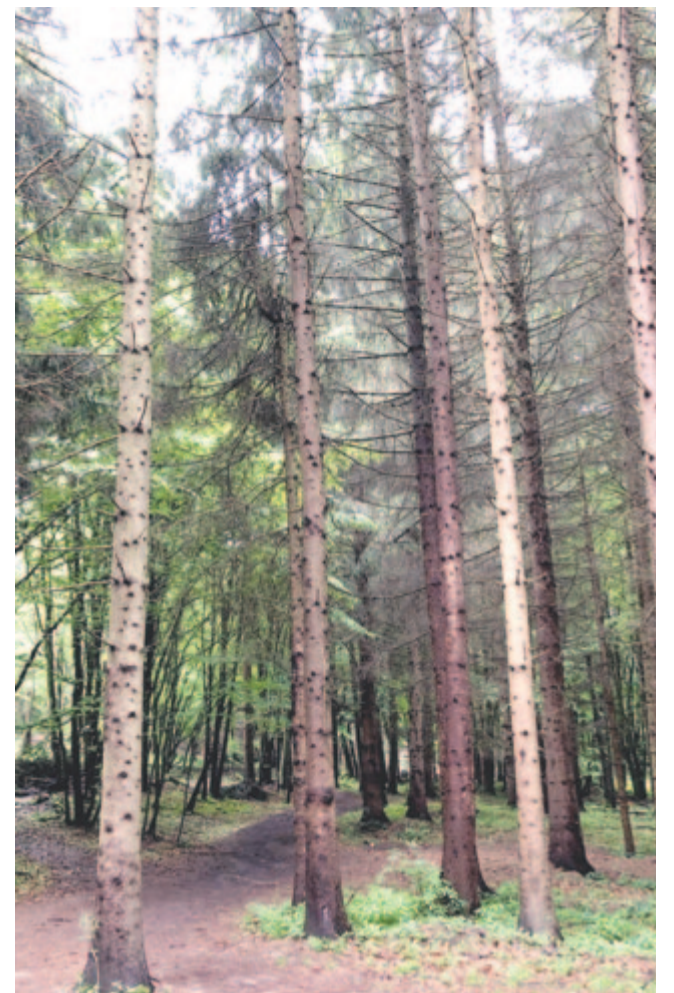
A gyantaszagú fenyvesekben mindig levett kalappal járok

Inkább megkerüllek valahogy: azt mondom, hogy valaki vagy, magok csirázatója, emberek álma,