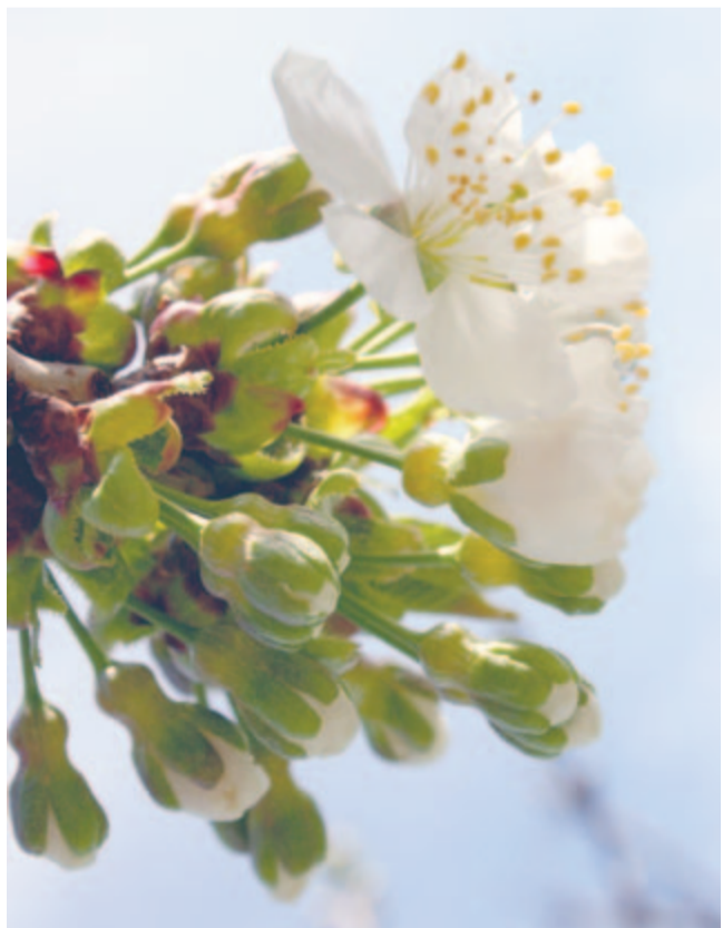
Fehér menyasszony fakaszt öntestéből virágokat

1993-ban a Nemzetközi Bányászszövetség Budapesten megtartott 47. kongresszusa május 13-át az egészség és biztonság nemzetközi napjává nyilvánította. A bányászatban világszerte évente mintegy 15 ezerre tehető a hivatalosan közölt