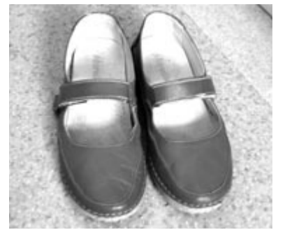
Mary Jane típusú cipő átkötőpánt nélkül

A szélesebb pánttal ellátott kocka sarkú szandálok praktikuságuk miatt főleg az irodai viselethez ajánlottak, mivel nemcsak kényelmesek, hanem hozzájárulnak a klasszikus megjelenéshez.