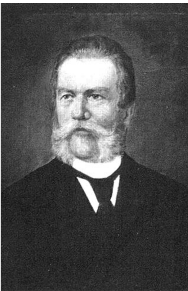
Vajda János, Bruch Lajos festménye (1880 körül)

1857-ben fogat Virrasztók című verse. A Virrasztókban Vajda egyrészt Széchenyi korábban idézett halodó nemzet gondolatát, másrészt Vörösmarty 1855-ös Előszó című versének a „ Most tél van és csend és hó és halál ” képét fejleszti tovább. A halottvirrasztás motívumára épül az egész költemény: a nemzet kiterítve, s a nagy halottat gyászolók veszik körül. Vajdánál a gyászolók a felelős emlékezők, az értelmiségiek. A költő ezt a képet tovább részletezi. Versének végső