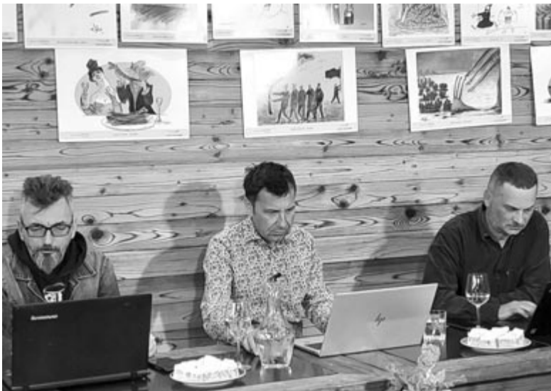
Három ítéző Nyáradszeredában, egy Déván pontozott

A rebarbarára épülő nemzetközi karikatúraversenyt 2019-ben indították, a témában ez az egyetlen a világon, és a második olyan verseny, amely növényre, gyümölcsre épül, az elsőt Ciprus török részén indították az olajbogyóra építve. Értékes verseny, eddig mintegy hat-száz karikaturista nevezett be az internetes versenyfelületen, idén 240 rajz érkezett (egy karikaturista legtöbb öt alkotással nevezhet). Az előzetes válogatáson 56 alkotás került be a döntőbe – a szervezők ötvenre számítottak, pontegyenlőség miatt végül maradt ez a szám. Örülnek, hogy a szeredaiaknak tetszik a kezdeményezés, mert itt is terjed a rebarbara, remélhetőleg két év múlva már ismerni és fogyasztani is fogják – mondta el a kezdeményező.