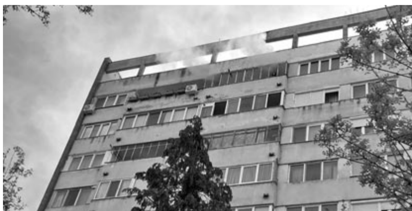
A marosvásárhelyi tüzeset

Ezt megelőzően Marosludason május 2-áról 3-ára virradó éjszaka 1.30 órakor egy négyemeletes tömbház földszinti lakásában keletkezett tűz oltásához hívták ki a dicsőszentmártoni és ludasi munkapont tűzoltóit, valamint a radnóti önkénteseket. Az épület húsz lakásából tizenkét személyt menekítettek ki, egy személyt a helyszínre érkező orvosok pánikrohammal szállítottak kórházba. A tűz 45 négyzetméteren terjedt el a lakásban. A tűz valószínűsíthető okának megállapítása folyamatban van – tájékoztatott Oltean Georgiana , a Maros Megyei Katasztrófavédelmi Felügyelőség szóvivője. (pálosy)