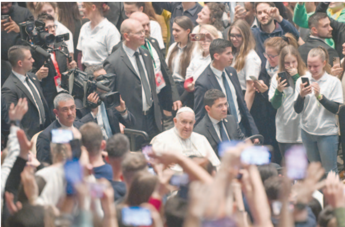
Ferenc pápa a fiatalokkal rendezett találkozásán a Papp László Budapest Sportarénában

A gyönyörű környezetben, a Fennvaló áldásával napsütötte Országához szomszédságában lezajló szentmise legfontosabb metaforái a jó pásztor, a nyitott kapu, a megbocsátás szépsége voltak. Vallási értelemben mindhárom Krisztus, a keresztény ember számára a Megváltó testesíti meg. Világi síkon az individualizmus zárt kapui és az elesettekkel szembeni közöny, a rászorulókat (migránsok) iránt tanúsított elutasítás arra jelent pápai felszólítást, hogy „Legyetek nyitott kapuk!”. De vajon kinek kell megbocsátást gyakorolnia, kaput nyitnia, jó pásztornak lennie? A napjainkban is jelentős vallási – és