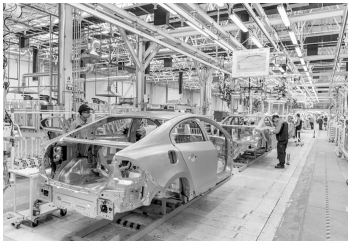
Kínai autógyár, illusztráció

Ha konkrét számokat nézünk, kezdjük a Li Autóval, amely úgynevezett hatótáv-növelő rendszerrel ellátott SUV-eket, azaz plug-in hibrideket gyárt. Csak márciusban több autót adott el, mint az amerikai tőzsdén jegyzett Xpeng a teljes negyedévben. A Li Auto márciusban