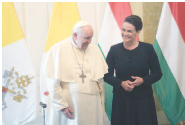
Novák Katalin köztársasági elnök fogadja Ferenc pápát a Sándor-palotában