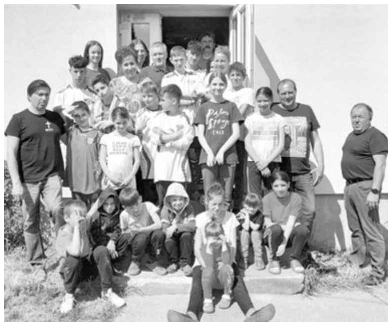
Ismét Vicében jártak a jótévedők, kellemes napot töltöttek a bentlakókkal

A mostani adománygyűjtési kampányba leginkább Gyulakuta és Nyáradszereda református és Szabéd unitárius gyülekezetének tagjai kapcsolódtak be, de érkeztek felajánlások más magán személyektől is, valamint a Nyáradszeredai Önkéntes Tűzoltók Egyesülete és a Gondviselés segélyszervezet Maros egyházköri fiókszervezete részéről is. (GRL)