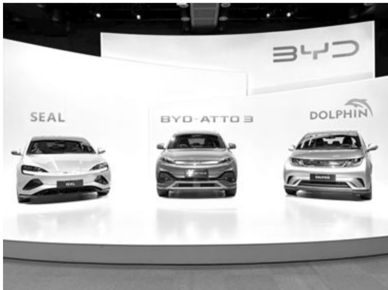
BYD elektromos autók

Míndez azt jelenti, hogy az európai szereplők is fel kell vegyék a kesztyűt, és olyan autókval kell előrukkoljanak – méghozzá gyorsan –, amelyek valós és életképes alternatívái a kínai típusoknak. A verseny éleződik, ami jó a fogyasztóknak, hiszen a gyártók azon lesznek, hogy őket válasszuk, ezért mind jobbat és jobbat fognak készíteni. Kérdés, hogy mit fog ez jelenteni a gazdaság számára? Az viszont már világos, hogy Európa autonagyhatalmi szerepe fölött gyülekeznek a viharfelhők, ezek pedig alighanem végzetesek lesznek a közel monopóliumhelyzetben lévő számára.