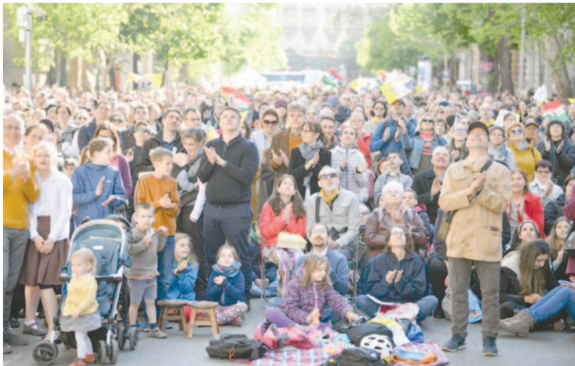
Részvevők Ferenc pápa Kossuth téri szentmiséjén