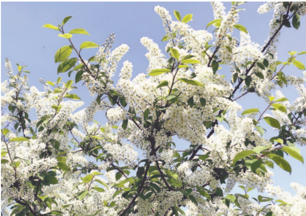
Májusfa illattal integet

Kelt 2023-ban, 269 évvel Széchényi Ferenc, a Magyar Nemzeti Múzeum alapítójának születése után