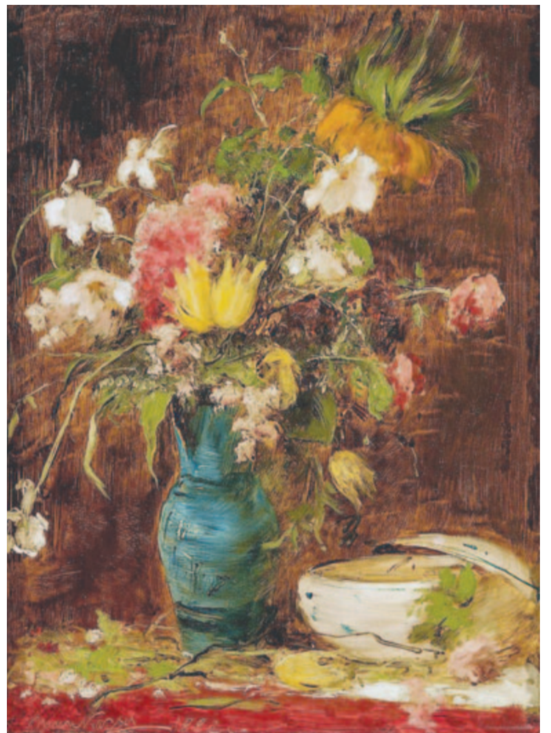
Munkácsy Mihály: Virágcsendélet tállal (1882)

(...) Az út, amin oly sokáig tévelyegtél itt tündökölt előtted a hajnali fényben s már nem is egyedül rovod a végtelen távolságot (...) Micsoda forró és túlradó nap is ez a mai