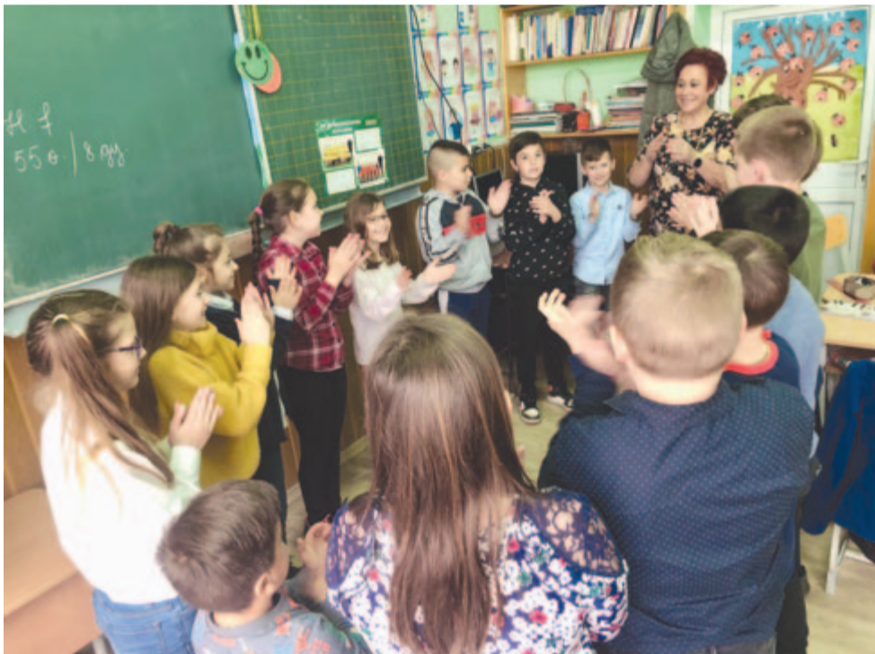
A nyáradszeredai iskola harmadikosai az új oktatási módszerrel tanulnak

Megtudtuk, hogy az új módszer bevezetéséhez megkapták a megyei szaktanfelügyelő hozzájárulását is, ugyanis az új társas tanulásban is a hazai tantervet követik, a hazai tankönyveket használják.