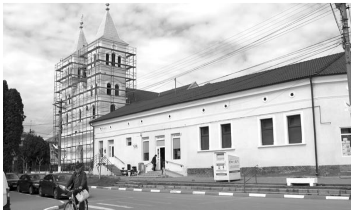
A katolikus templom és a plébánia