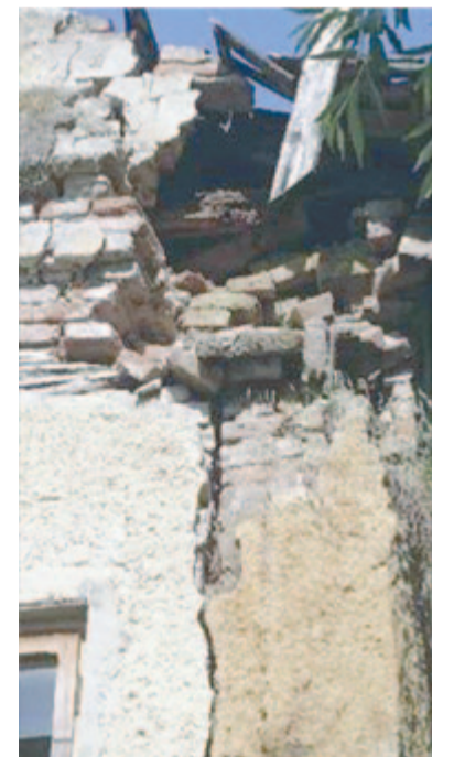
Pár évvel ezelőtt