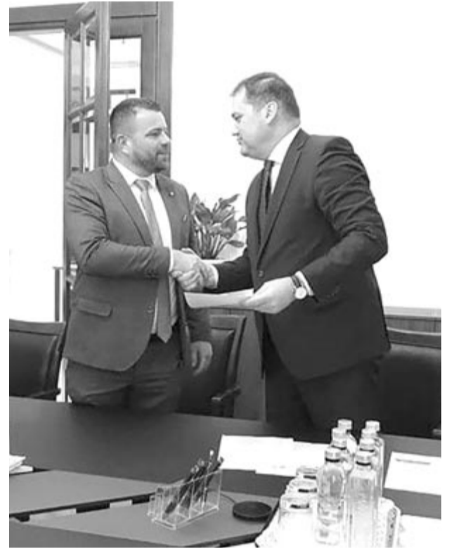
Múlt héten írták alá a balavásári és szovátai beruházások szerződéseit

A kivitelezési közbeszerzés megtörtént, a múlt héten aláírt szerződés értelmében a cégnek két hónapja van a tervezésre és az engedélyek beszerzésére, valamint egy éve a bölcsőde felépítésére. A kivitelezési folyamatot az Országos Beruházási Társaság (CNI) felügyeli, majd a kivitelezés lezárása után a terület és az épület az önkormányzat tulajdonába kerül. A bölcsőde a községek központi iskola udvarán kap helyet, és igencsak környezetbarát megoldásokkal