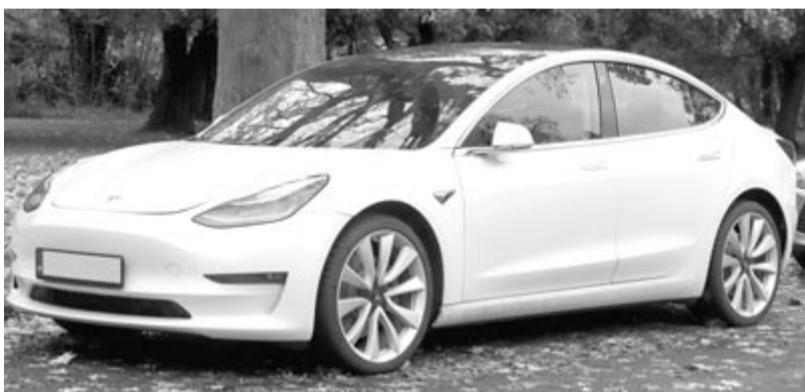
Tesla Model 3