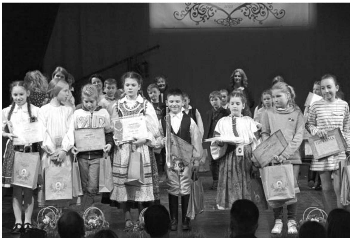
A nyertes regemondók