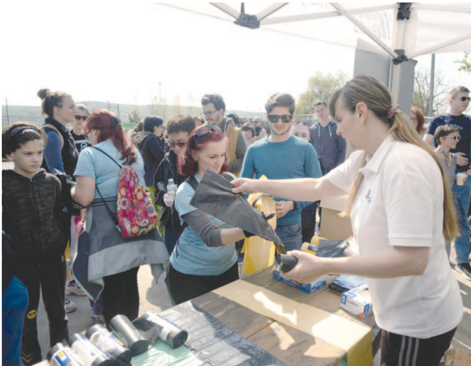
Az önkéntesek átveszik a szemeteszákákat és a védőkesztyűket