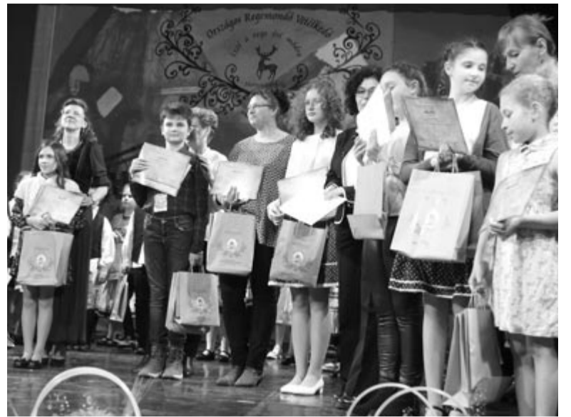
A regerajzpályázat nyertesei