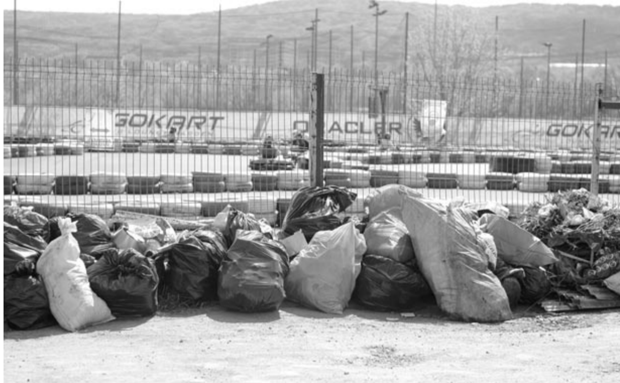
Az összegyűjtött szemét egy része