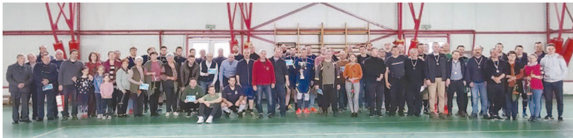
Együtt a résztvevők

Nyárádszeredában ismét megrendezték a református lelkesek számára kiírt te-remlabdarúgó-tornát a TEPSI-kupáért, amelyet a megnyitó áhítat során Koós Mátyás magyarországi lelkes a példakép ligájának és az egymással való kapcsolat erősítése lehetőségének nevezett.