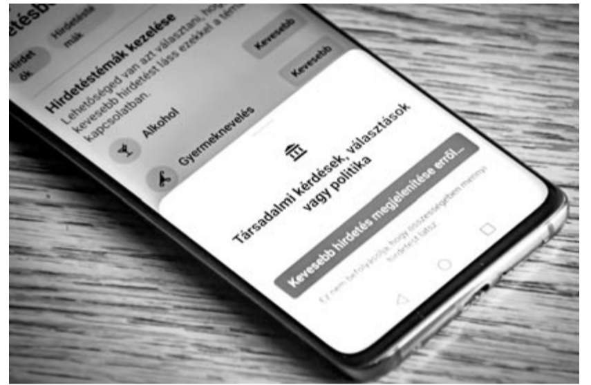
Facebook – politikai hirdetés, illusztráció

A Financial Times arra is kitér beszámolójában, hogy ha a Meta tényleg úgy dönt, hogy betiltja a politikai hirdetéseket az Európai Unióban, az nem lesz jelentős hatással a vállalatra pénzügyi szempontból, mivel ezek a reklámok viszonylag kis szeletet adják a bevételnek. Még az Egyesült Államokban is a cég