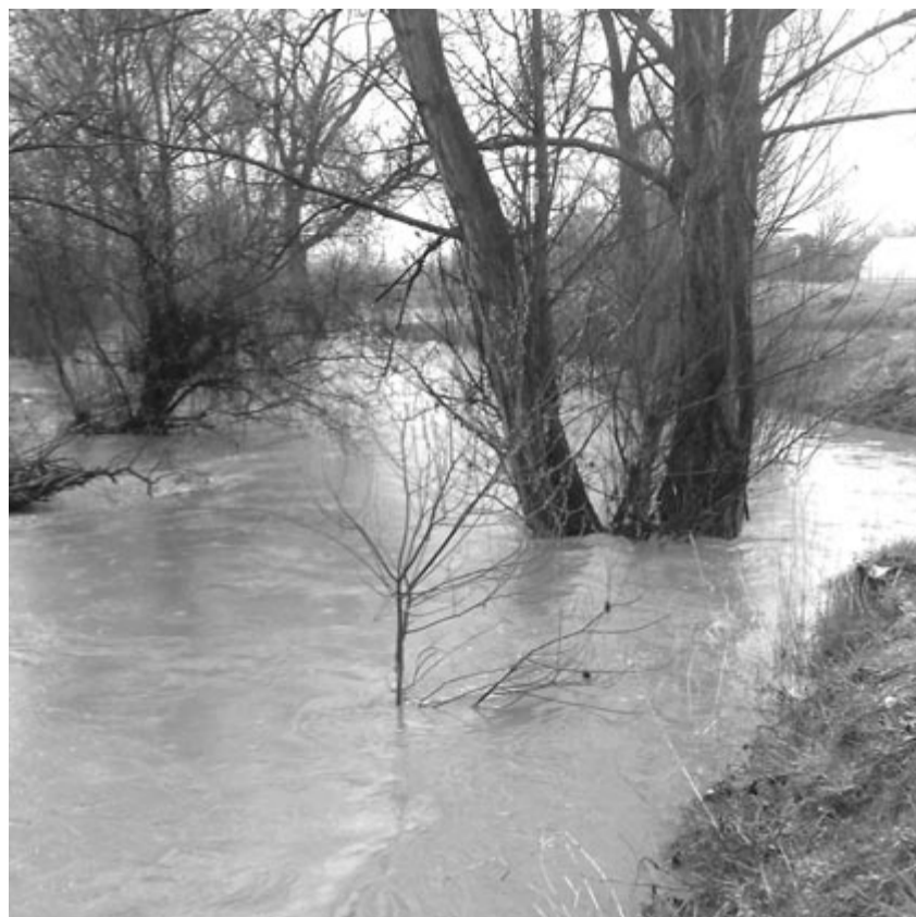
Kedden megduzzadtak a folyóvizek, de a mederben maradtak

Nyárádszereda térségében is magas volt a vízállás, a Vécse-csatorna hozama elérte a csúcst, ezért lezárták, a