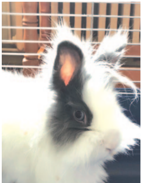
Liza, a féltve őrzött családtag