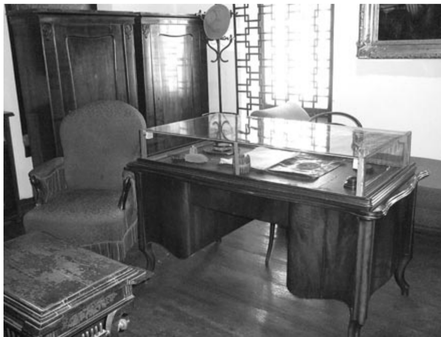
Arany nagyszalontai szülőházában berendezett dolgozószobája

Széchenyit heroszi, szinte isteni magasságban láthatjuk. Az ünnepélyes felmagasztalás és a „hétköznapi” tudat, miszerint minden életáldozat kimondhatatlanul drága, egymásnak feszül, és ez a feszítőerő lendíti-emeli a gyászoló közösséget az elhunyt hős mellé.