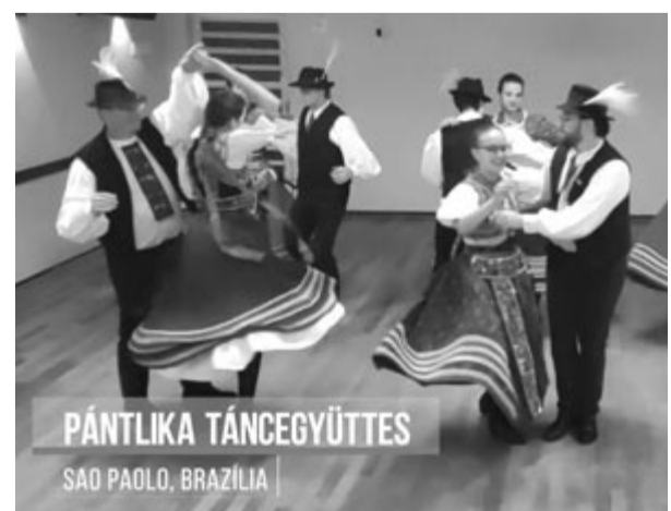
PÁNTLIKA TÁNCÉGYÜTTES SAO PAULO, BRAZÍLIA