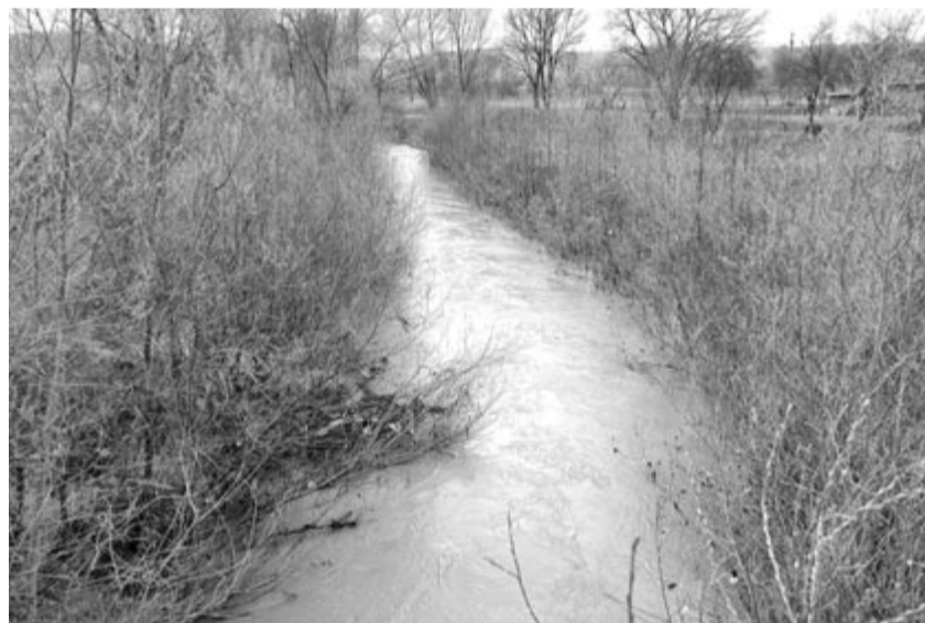
Szerdára visszahúzódott a Nyárad a középső szakaszon