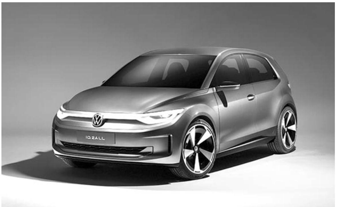
Volkswagen ID 2all

És ha már az árán tartunk, a Citroën új, olcsó elektromos autójának árai várhatóan 25.000 font körül fognak alakulni. A jelenlegi technológiával ennél sokkal alacsonyabban nem igazán lehet levinni az árat. A technológia fejlődésével, új gyártási módszerek feltérképezésével ez a szám a jövőben tovább csökkenhet.