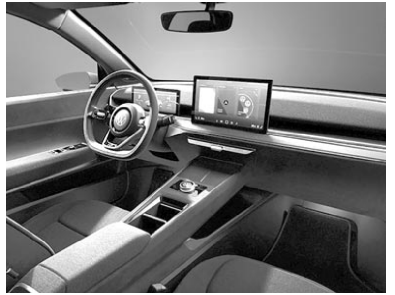
Volkswagen ID 2all beltér, középen a nagy fizikai hangerő-szabályozó

A beltérre nem lehet panaszunk, de vizsgáljuk meg egy kicsit a külsőt is. Az ID 2all esetében nem crossoveres, SUV-s vonásokkal van dolgunk, hanem egy hagyományos hatchback formával, mely bevallottan sokat merít a Volkswagen hagyományos formavilágából. A gyártó vezetője, Thomas Schafer szerint ez már annak az új irányvonalnak a része, amely a Volkswagent egy „valódi szerelem” márkává hivatott tenni. Ebben az értelemben három alappillérré építkeznek: a stabilitás, az izgalom és a szerethetőség. Szintén a beltérhez kapcsolódik a 12,9 hüvelykes képátlójú érintőkijelző, amelyhez klasszikus – fizikai – hangerő-szabályozó is fog tartozni. A gyártó külön hangsúlyozta közleményében, hogy az autóban elérhetőek lesznek olyan funkciók, amelyek általában a drágább autók kiváltságai