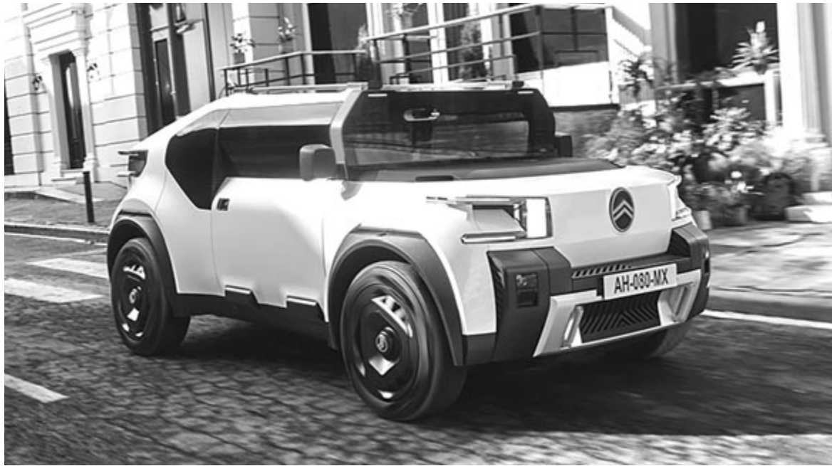
Citroën Oli, a francia gyártó olcsó villanyautó-konceptója

Az ID 2all végleges verziója 2026-ban érkezik, Spanyolországban fogják gyártani. A típusból készült átcímkeztet Cupra változat is, illetve a Skoda is készül valami hasonlóval, igaz, az már SUV-sebb irányt fog követni. De nem ez az