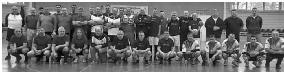
A 9. Pressing-kupáért kiírt torna résztvevői

A torna végeredménye: 1. Marosszentgyörgyi Nordenlor 9 pont (8-4), 2. VakPali 3 (3-3), 3. PRESSing 3 (4-6), 4. MindJó Öregfiúk 3 (5-7).