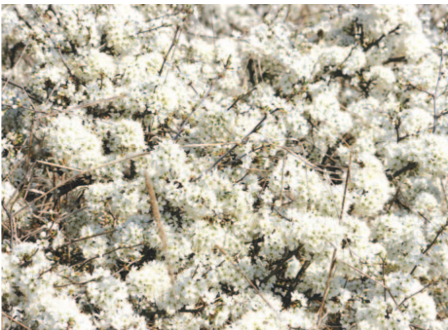
Festéket kevernek, szirmoknak fehérét

Kelt 2023-ban, 24 évvel azután, hogy a NATO 1999-ben megkezdte Bácska bombázását; a kereszténységben az örömhír ünnepe: Gábel arkangyal hírt visz Máriának, hogy 9 hónap elteltével megszületik Jézus