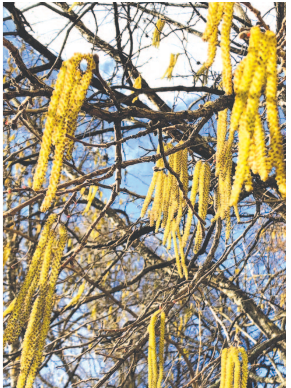
Tetszelegve forog-pörög, mutatja magát a barka