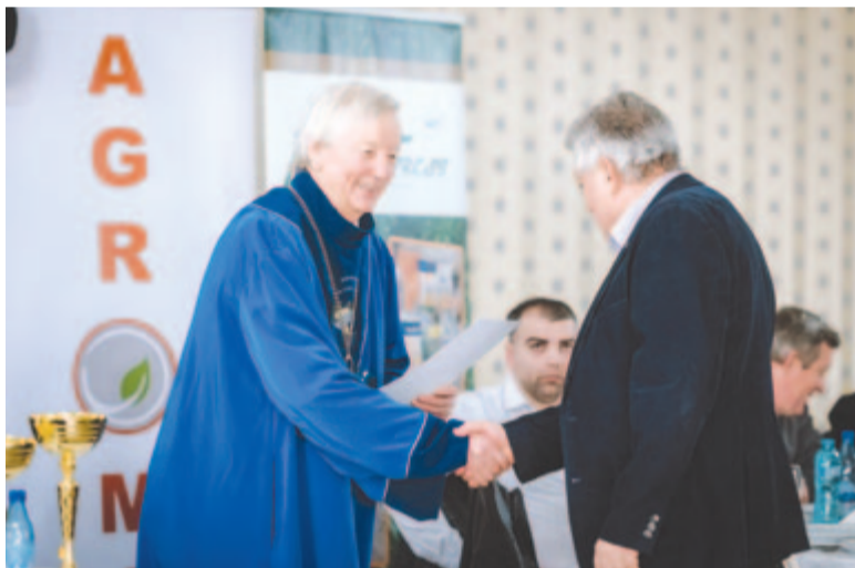
Idén 98 bor kapott aranyat, a nagyarany Somogyecsióra került