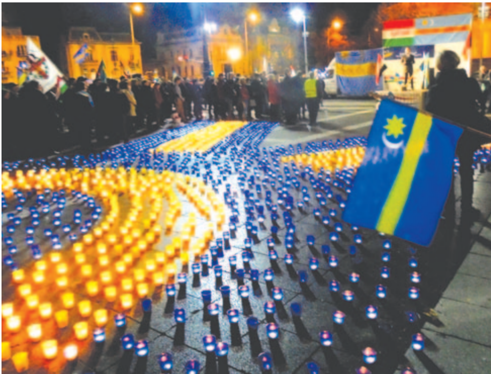
Székely szabadság napja a Hősök terén

Március 10-én, 1916-ban lépett át a halhatatlanságba gróf Teleki Samu felfedező, a Kilimandzsáró meghódítója, országgyűlési képviselő, a Rudolf- és a Stefánia-tavak felfedezője.