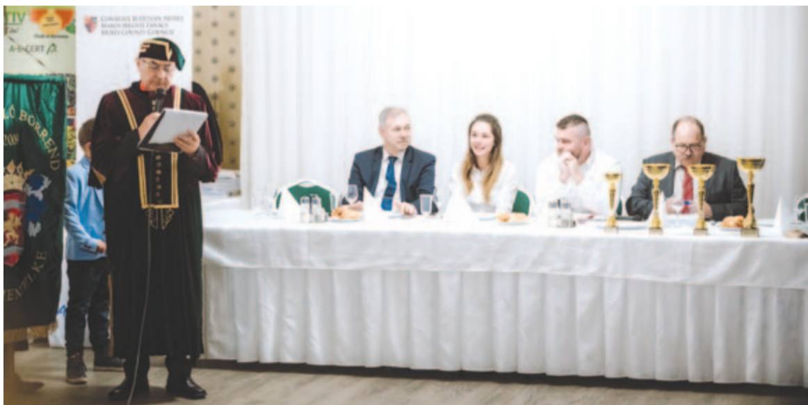
Nagy sikerű volt az idei verseny, és több újdonságot is hozott