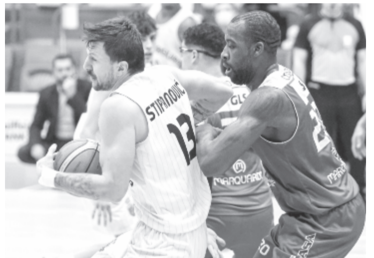
Az U-BT újabb erődemonstrációt tartott, és Nagyszébenben legyőzte az egyik közvetlen riválisnak számító házigazdát.