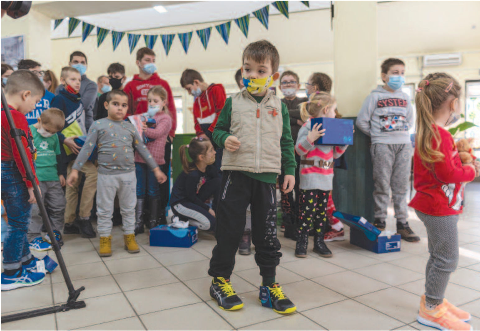
Gyerekek a Fuss pont most! jótékonyági futás keretében összegyűlt adományokkal az átadóünnepségen a magyarfülpösi Szivárvány Ház gyermekotthonban

A Fuss pont most! jótékonyági kezdeményezésnek köszönhetően száz pár minőségi sportcipővel ajándékozta meg szombaton a magyarfülpösi Szivárvány Ház által felkarolt, mélyszegénységben élő gyerekeket az anyaországi „Egy vérből vagyunk” Alapítvány, valamint Potápi Arpád János, a Miniszterelnökség nemzetpolitikáért felelős államtitkára. A szórványban élő gyerekek óriási örömmel fogadták az ajándékot, hiszen – amint Gui Angéla, az alapítvány elnöke lapunknak elmondta –, nekik ez nem a huszadik cipőjük, hanem sokaknak az egyetlen lábbelije.