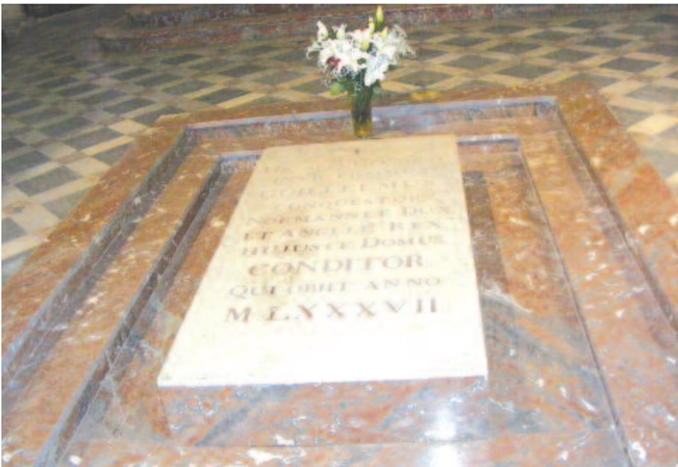
Hódító Vilmos sírja, Caen, Szent István-székesegyház

A középkori várhoz a város hosszú főutcáján érünk. Az utca két oldalán fehér kőből épült paloták sorakoznak, földszintjükön üzletek, vendéglők, ezek a korai órában még zárva vannak, az utcán is csak egy-két ember lézeng. Az utca végén egyből előbukkan a vár