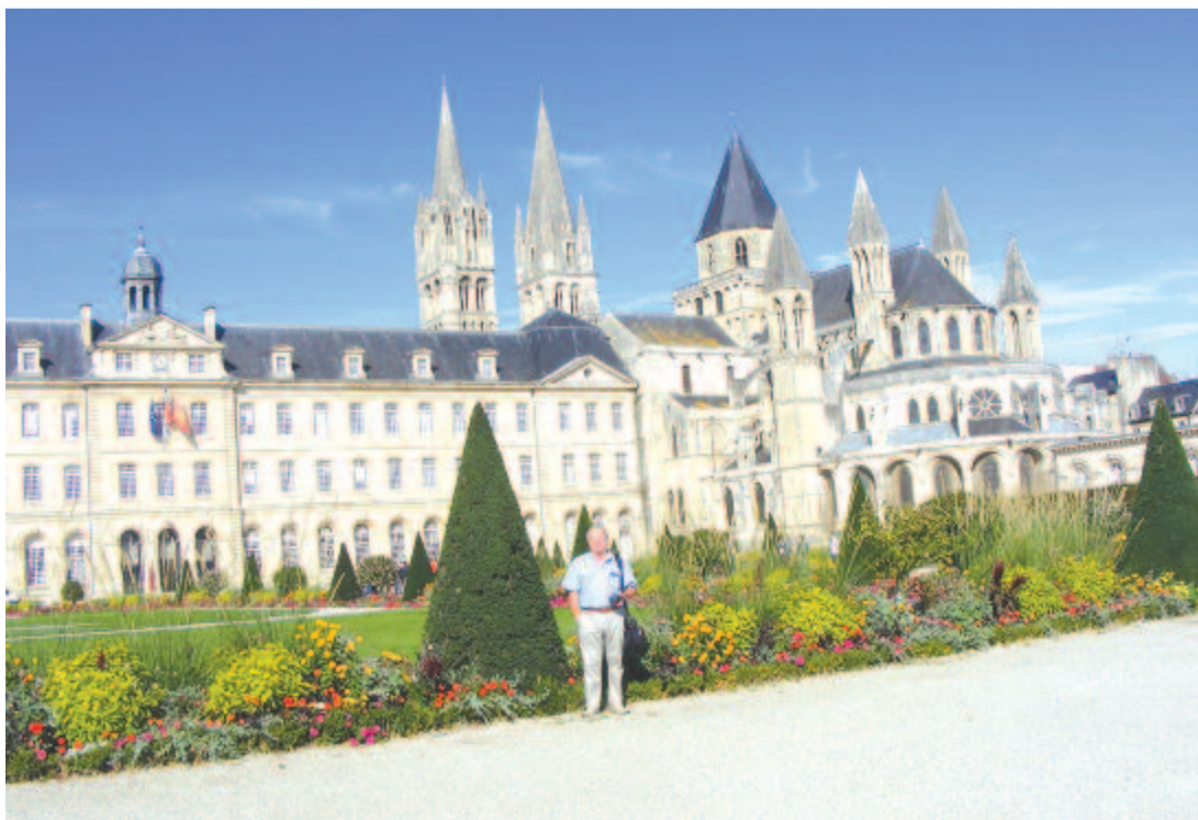
Apátság és Szent István-székesegyház, Caen

A hatalmas templomhoz csatlakozik a háromemeletes apátsági épület különböző objektumaival. Múzeumában megdöbbentő kiállítás tekinthető meg a második világháborúban elszenvedett pusztításokról, az emberek szenvedéseiről.