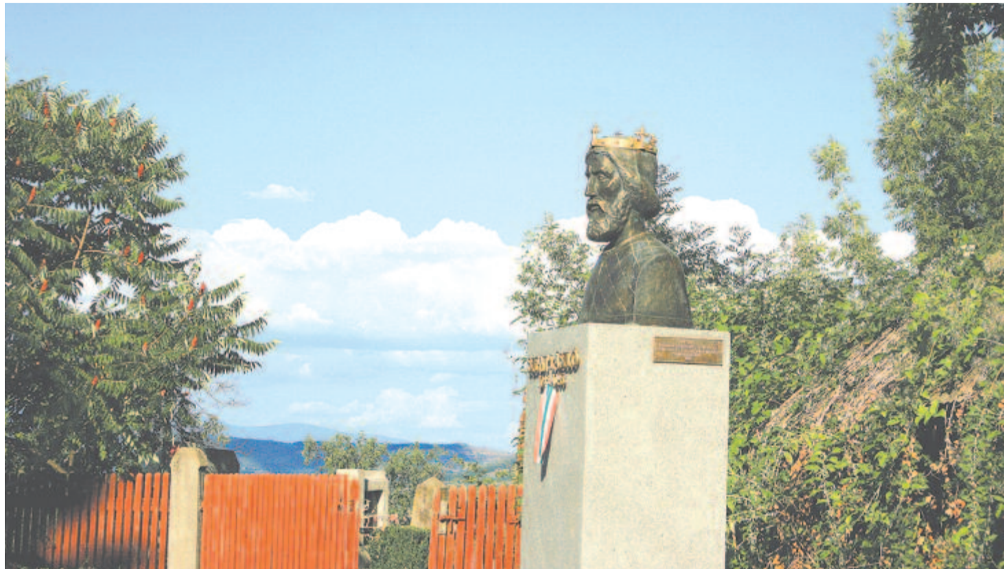
Gomolyfelhők a Bekecs felett Nyárádszentlászlórol nézve

75 évvel ezelőtt, 1945. július 16-án hajtották végre az Egyesült Államok első nukleárisfegyver-tesztjét a Jornada del Muerto sivatagban, 56 km-re délkeletre az új-mexikói Socorro-tól. A kísérlet a Manhattan Project során egy plutónium alapú bombát robbantottak. Teller Ede ott volt, később így írt erről: Olyan volt, mint amikor egy teljesen sötét szobában hirtelen elhúzzák a függönyö-