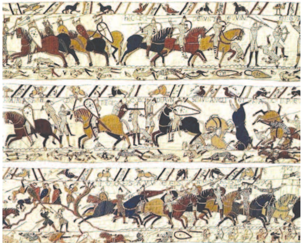
A bayeux-i falikárpit részletei

Vilmos, a legendás normann herceg és angol király 1028-ban született, Normandia hatodik hercege, Ördög Róbert törvénytelen (házasságon kívüli) fiaként. Kemény küzdelmet vívott azért, hogy őse, Rollo herceg és apja, Róbert herceg örökébe léphessen törvénytelen, de egyedüli fiúgyerekként. Apja elhunytakor még kiskorú volt, és nem sok beleszólása volt a marakodó fúrak vizzályaiba. Annál inkább később: a felserdült Vilmos határozottan tört magasra mutató célja felé. Ma-