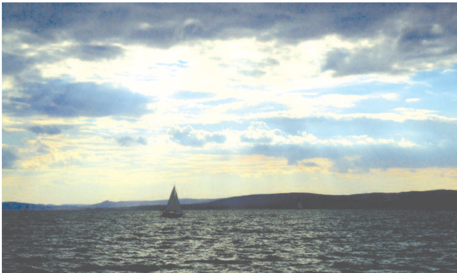
Vihar készül a Balatonon