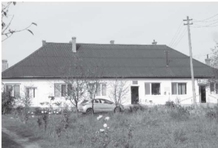
A hatvan év alatt öt orvos szolgált Csíkfalván