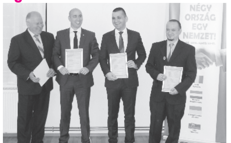
Negyedik éve találkoznak rendszeresen a négyes kapcsolat küldöttei

A testvértelepülések polgárai közvitákon és műhelymunkákon vesznek részt, amelyeken szó lesz Románia tizenkét éves EU-tagságáról és az ezzel járó előnyökről, a megszorításokról, az ideai európai parlamenti választások eredményeiről és várható hatásairól, a bevándorlásról és a bevándorlók helyzetéről, a kultúrák közötti párbeszédéről és általában Európa jövőjéről. Bátorítani szeretnék az európai polgároknak a közéletben való demokratikus részvételét, de a testvértelepülési kapcsolatok jövőjéről, a további együttműködésről is tárgyalnak, és cselekvési tervet állítanak össze.