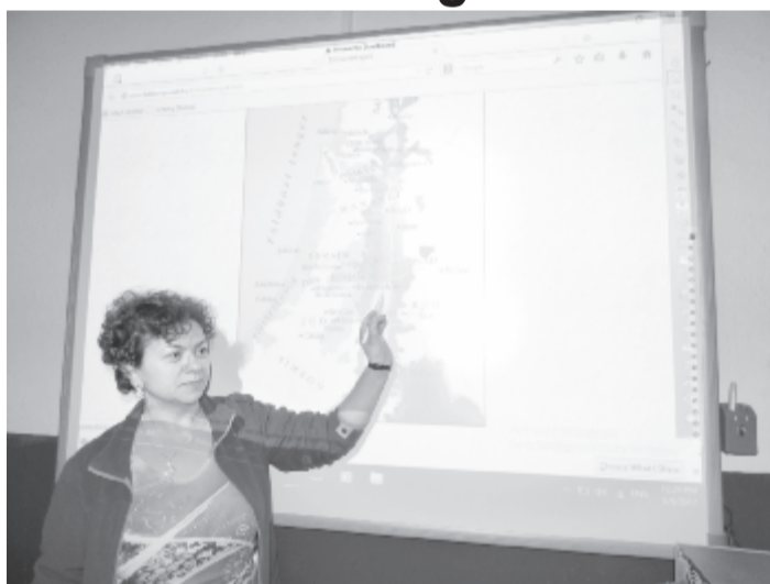
Egyes vidéki iskolákban hosszabb-rövidebb ideje sikeresen használják az oktatásban a digitális táblát

A nyárádgálfalvi iskola két éve szerzett be egy digitális táblát a Surtec áruház támogatásának köszönhetően. Amíg kikapasztalták a használatát, nehézkesen