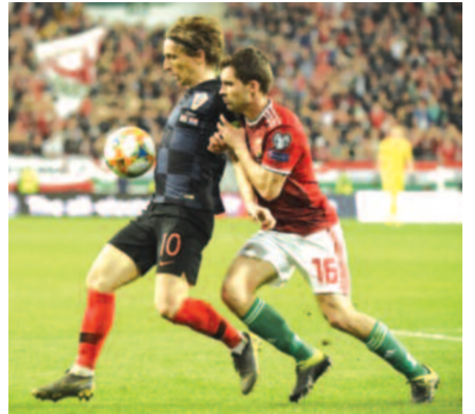
A horvát Luka Modric (b) és Pátkai Máté a Magyarország – Horvátország labdarúgó-Európa-bajnoki selejtező mérkőzésen a Groupama Arénában 2019. március 24-én. A magyar válogatott 2-1-re győzött.

„Ki kell húzni a fejeket a homokból” – véli a gol.hr. „Az azeriek elleni bizonytalan játék szemmel láthatóan nem volt véletlen. Akkor azt mondtuk, Horvátországnak érezhetően jobban kell játszania, ha Budapesten nyerni szeretne, különösen a védekezésben kell javulni. A válogatott azonban ugyanolyan szinten játszott, s figyelembe véve, hogy ezúttal egy olyan ellenféllel találta magát szemben, amely sokkal jobb az azerinél, a vereségen egyáltalán nem kell csodálkozni – írja a lap.